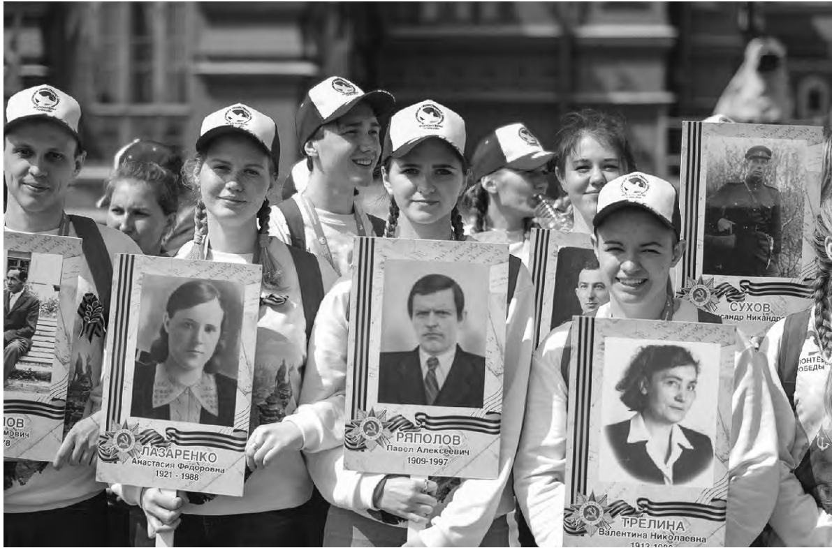
В строю волонтеров на Красной площади (вторая справа в первом ряду) — автор этих строк.

приняли участие в шествии «Бессмертного полка». Мы шли, крича ветеранам «Спасибо!», за жизнь, которую они нам подарили, и мирное небо над головой. Мне было приятно пройти с портретом прадеда, так как я давно мечтала это сделать.