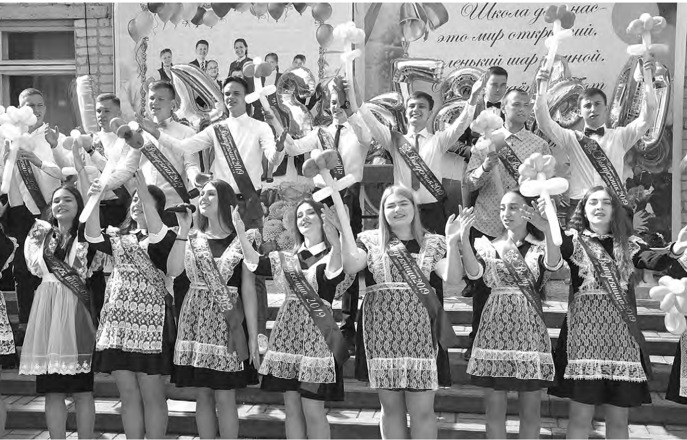
Выпускники средней школы № 4 готовы к новому этапу в жизни, об этом они поют песню.