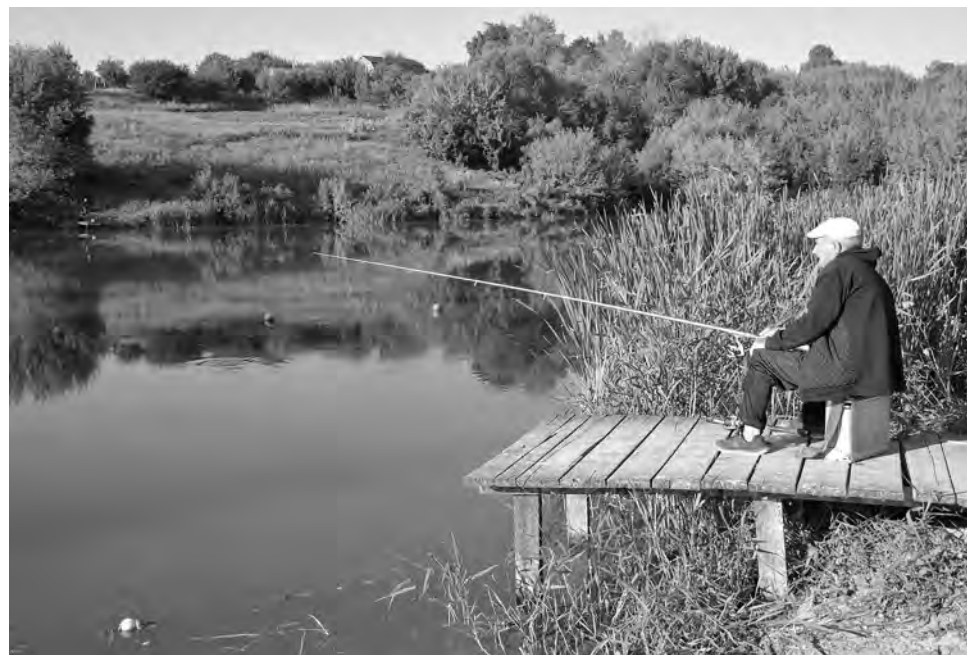
На обустроенном водоёме рыбачить — одно удовольствие.