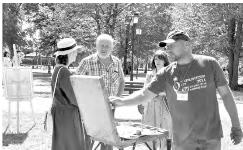
Фрагмент международного пленэра, который прошёл в нашем городе.