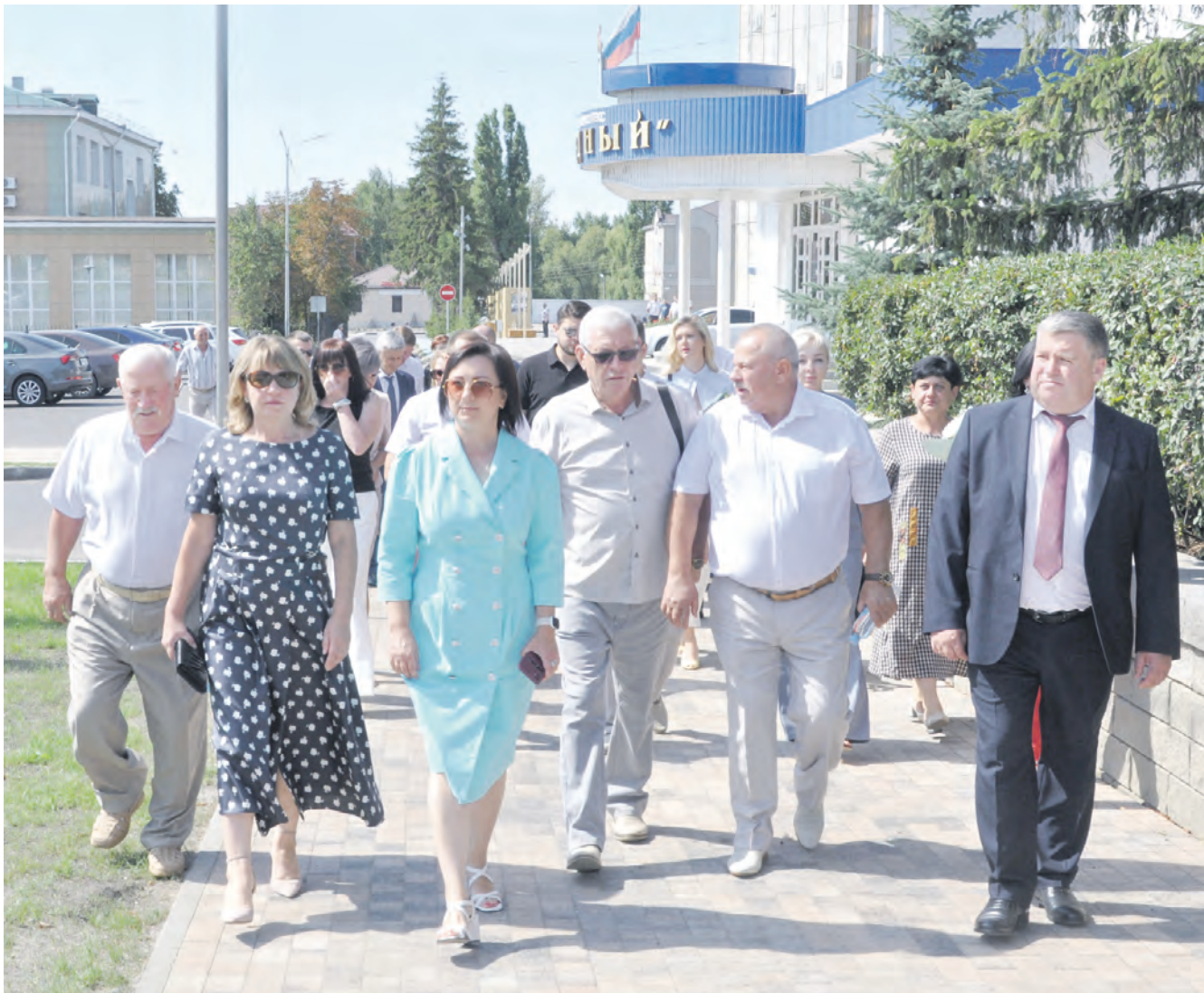
В День города почётная делегация осматривает благоустроенную территорию, прилегающую к Центральной площади.