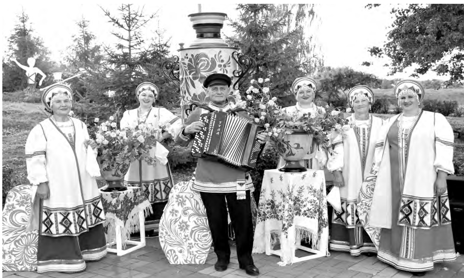
Народный ансамбль «Барыня» украсил праздник ярким выступлением.