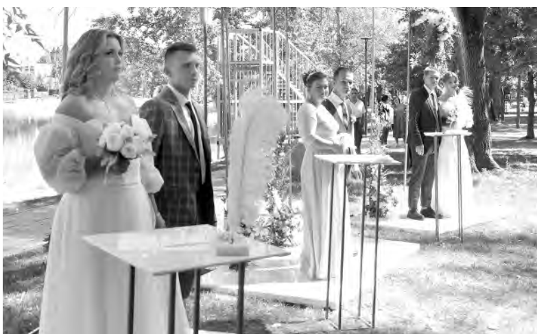
Праздничная церемония чествования молодёжи в парке культуры и отдыха.