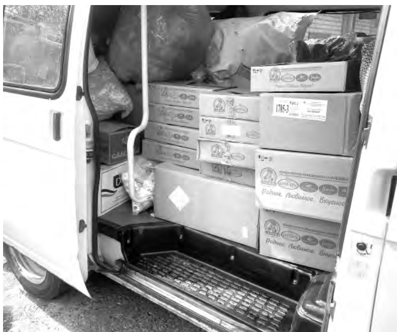
Гуманитарный груз, собранный по инициативе Алексеевского женсовета.

Концерт продолжился на одном дыхании, а в конце все дружно сфотографировались.