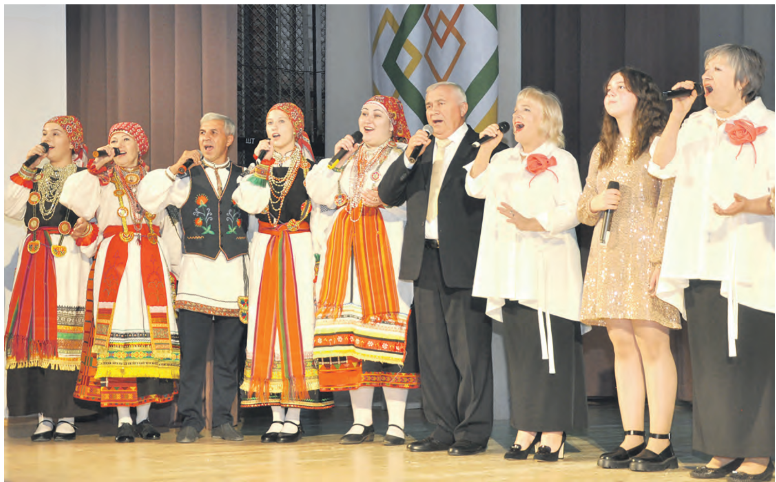
Творческие коллективы городского округа поздравили алексеевцев с Днём города.