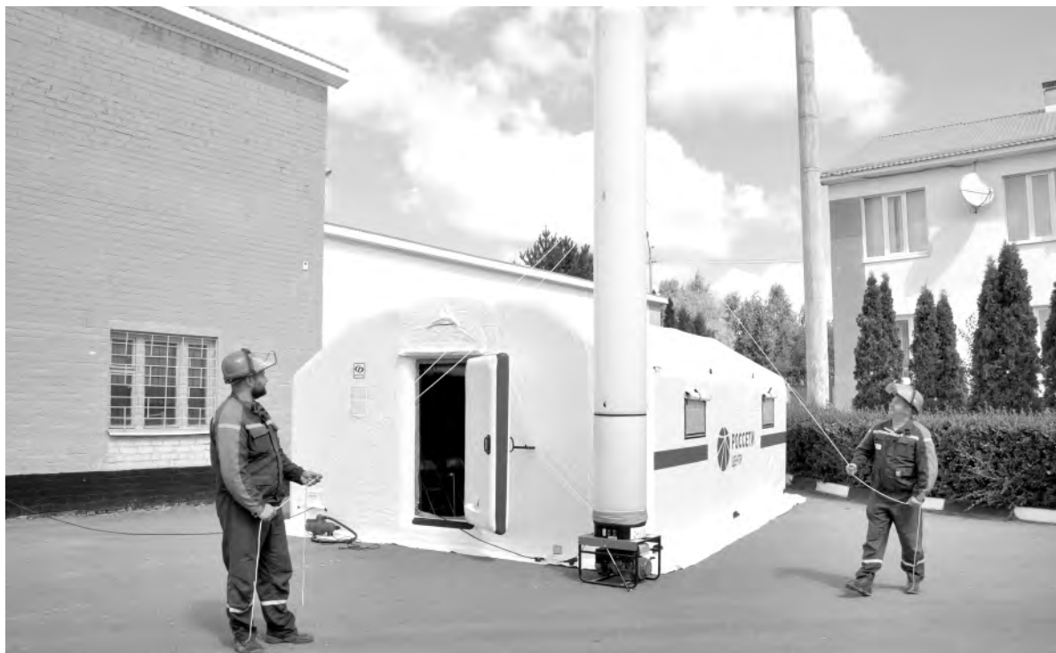
Алексеевские энергетики отработывают комплекс аварийных мероприятий.