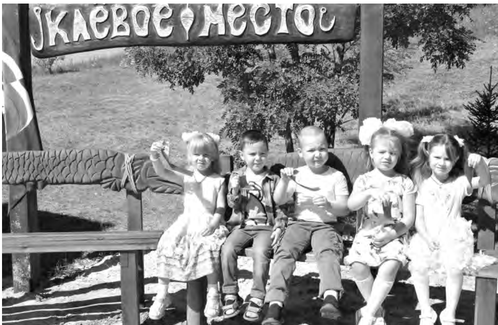
«Клёвое место» открыли воспитанники группы «Ручеек» Центра развития ребёнка — детского сада «Капелька».