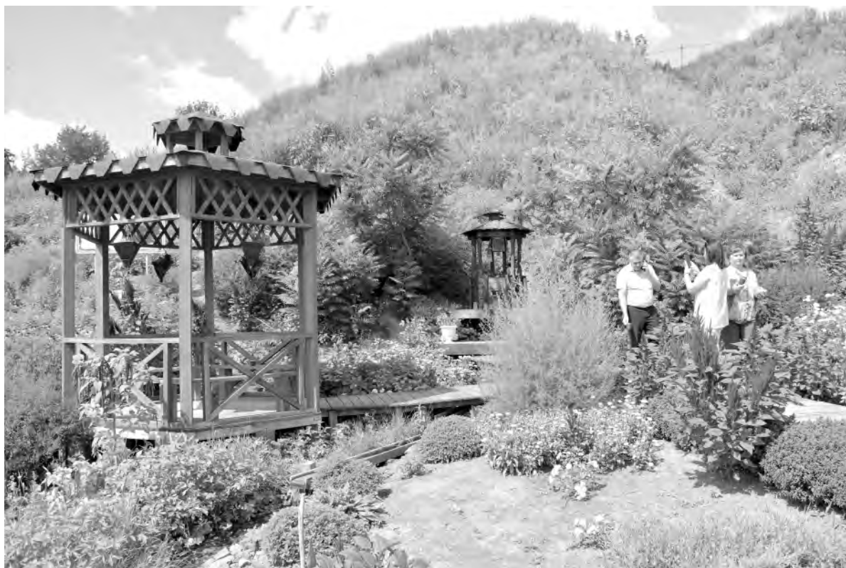
Благоустроенная территория родника «Иванниковы корыта» утопает в зелени и цветах.

Вячеслав ГЛАДКОВ, губернатор Белгородской области.