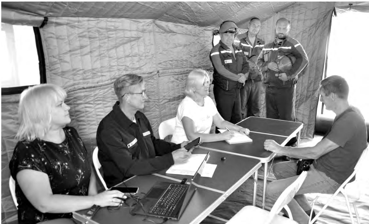
Тренировочный штаб, развёрнутый на базе Алексеевского РЭС.