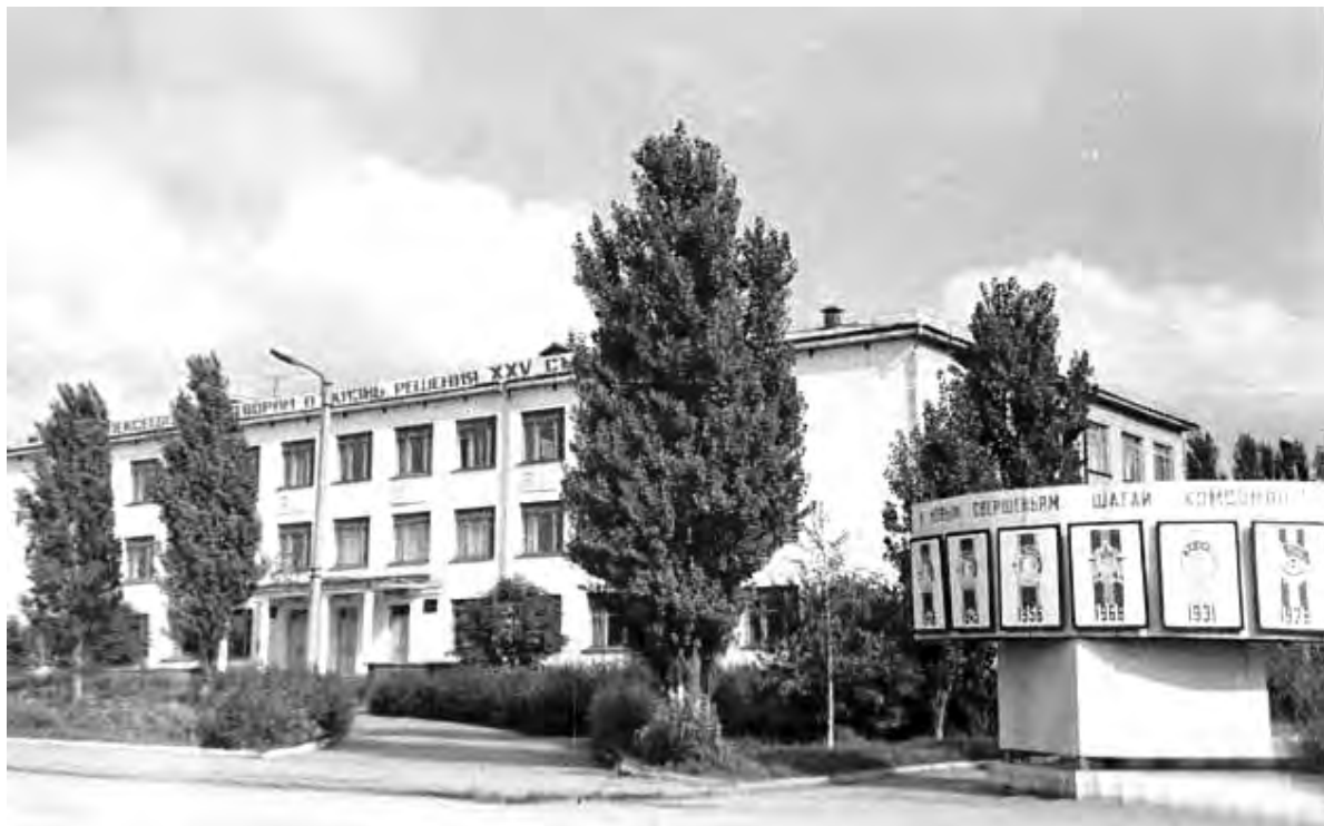
Здание Алексеевского техникума, 1980-е годы.