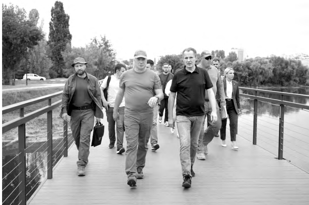
Марат Хуснуллин и Вячеслав Гладков во время посещения набережной «Берега».

Вячеслав ГЛАДКОВ, губернатор Белгородской области.