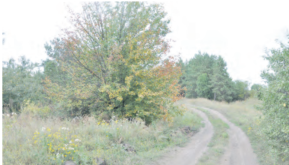
Природа малой родины.