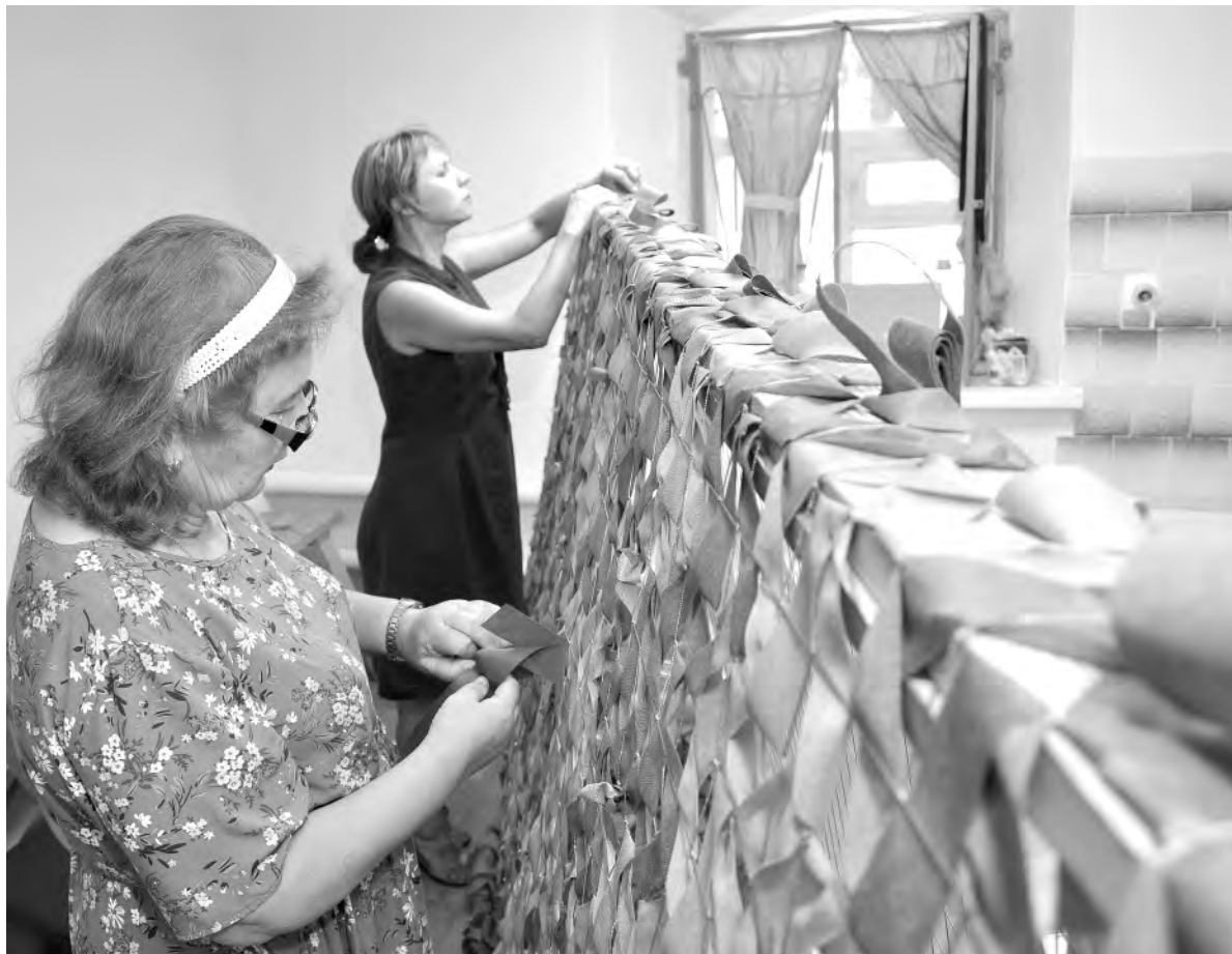
Сети, сплетённые руками алексеевских волонтеров, хранят молитвы и добрые слова, которые они мысленно посылают бойцам на передовой.

«Не оскудеет рука дающего» — женщина живёт по этому принципу, поэтому никому не отказывает в просьбе, отдаёт