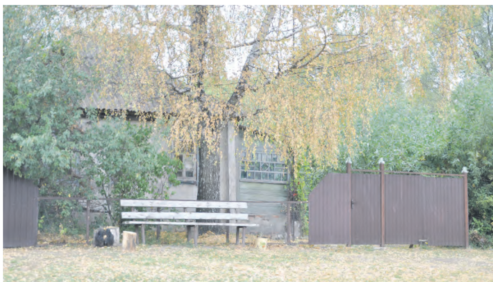
Берёза уже в красках осени.