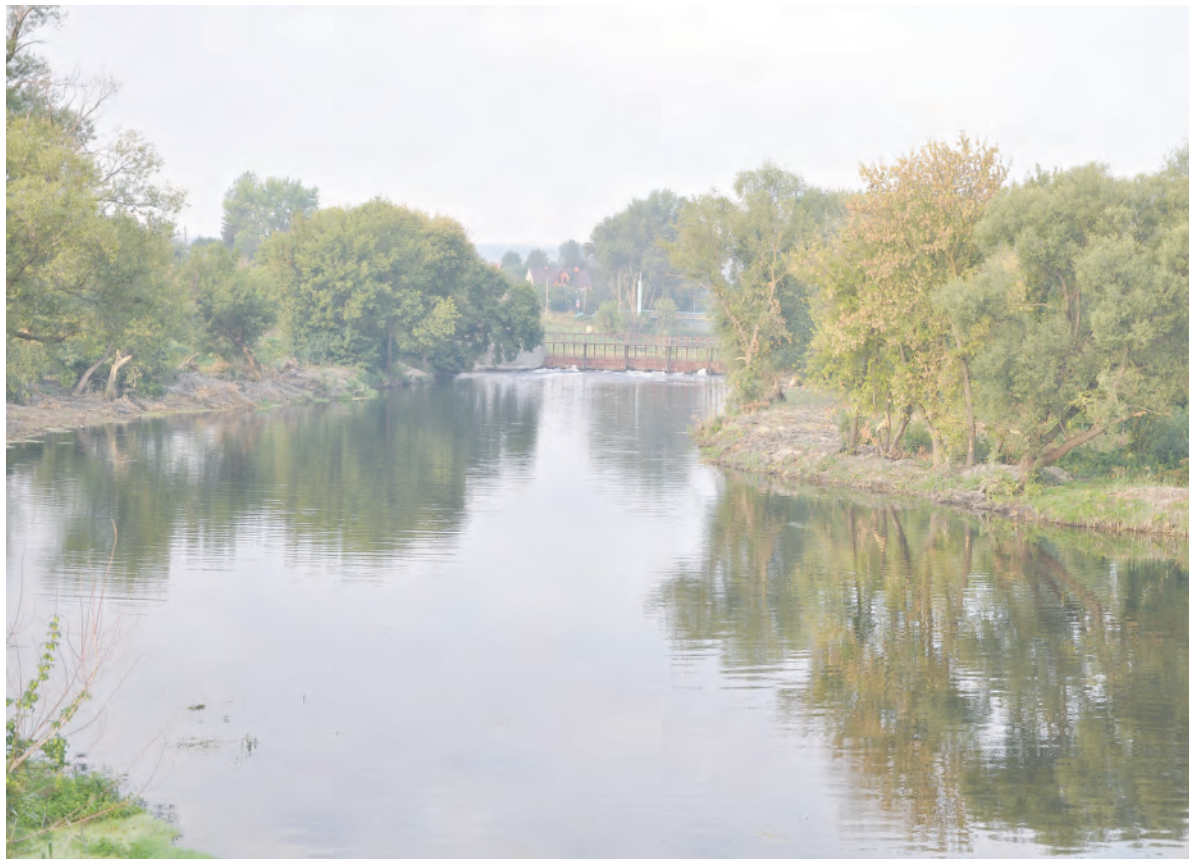
Водная гладь Тихой Сосны.