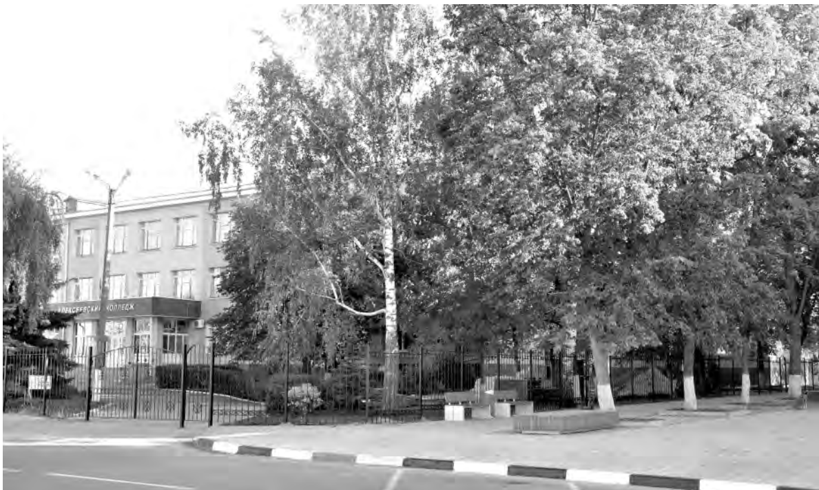
Центральное здание Алексеевского колледжа в наши дни.