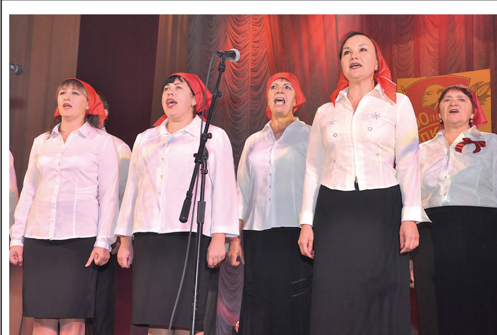
На сцене «Солнечного» — сводный хоровой коллектив.