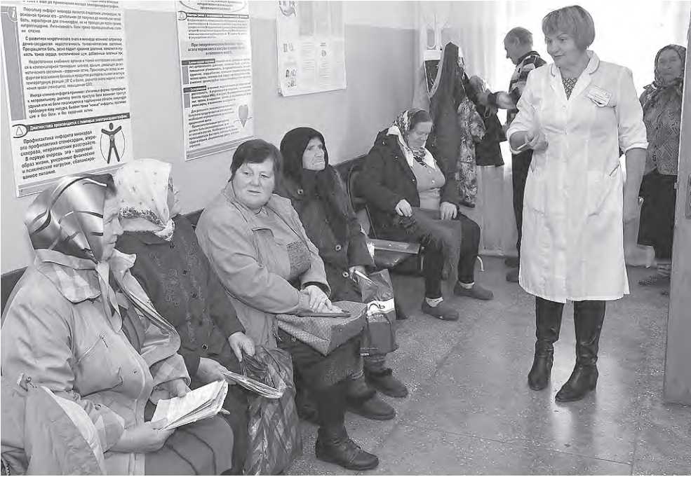
Получить необходимые консультации и рекомендации пожелали многие жители Афанасьевки.

И. ХАНИНА, главный врач Алексеевской центральной районной больницы.