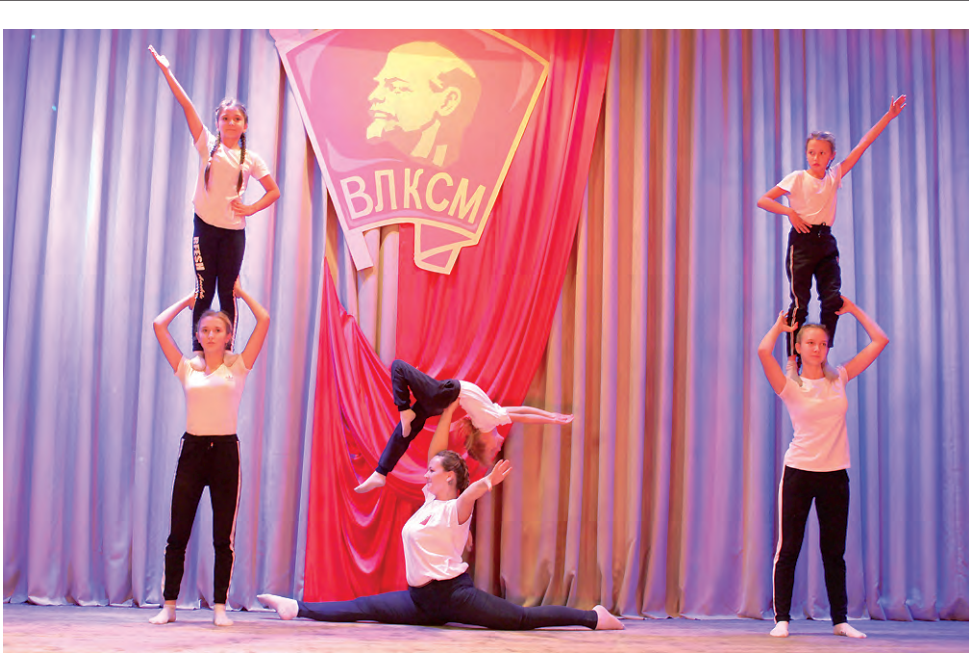
Воспитанники Красненской детско-юношеской спортивной школы показали свою композицию.