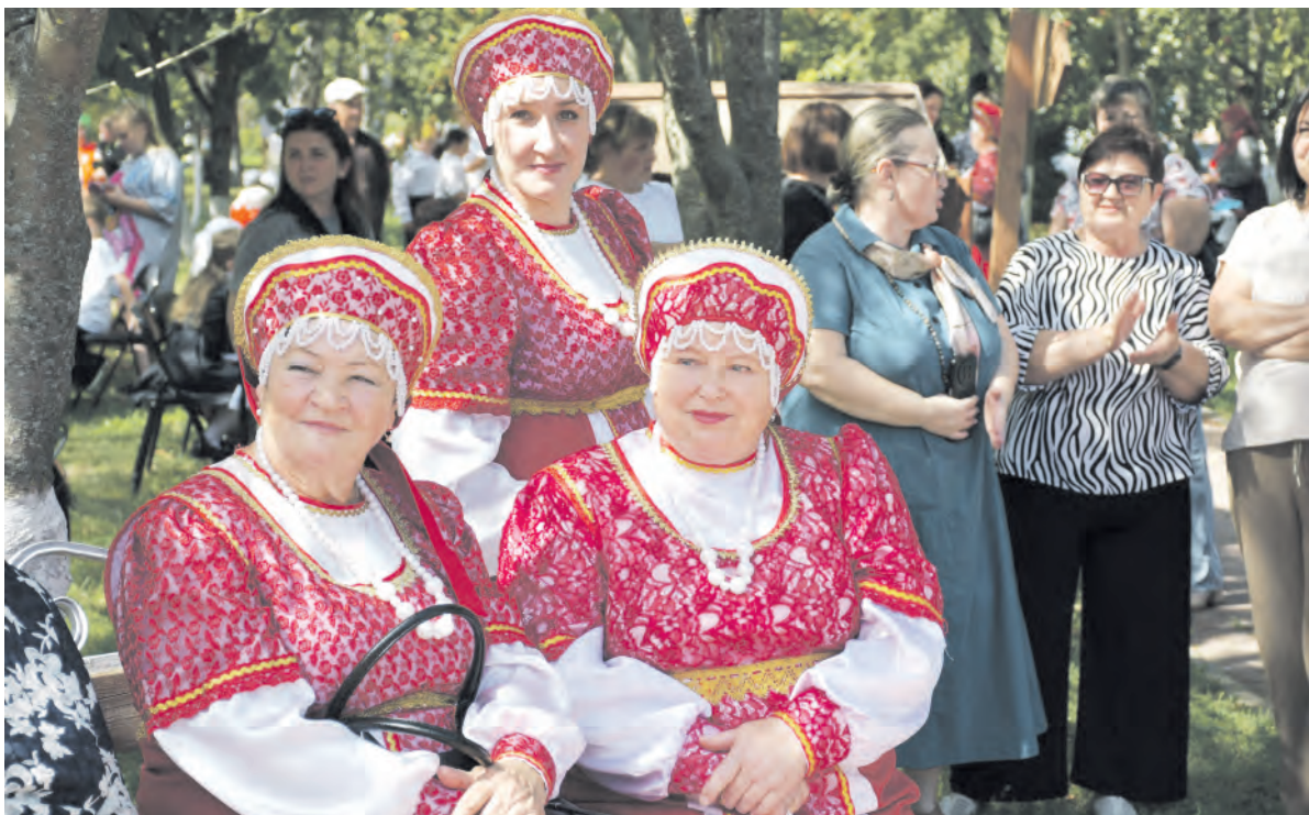
Солисты ансамбля русской песни «Надежда» в ожидании выхода на сцену.