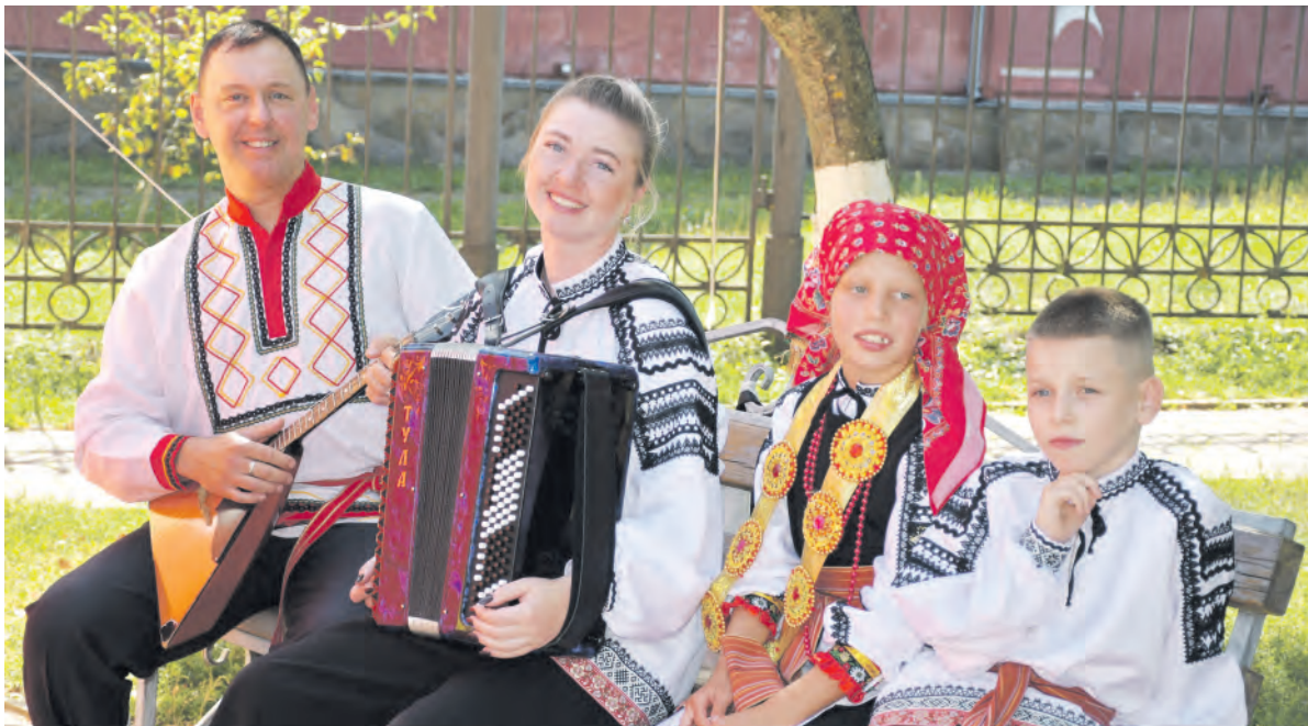
Как всегда ярко выступили педагоги и воспитанники Красненской детской школы искусств.