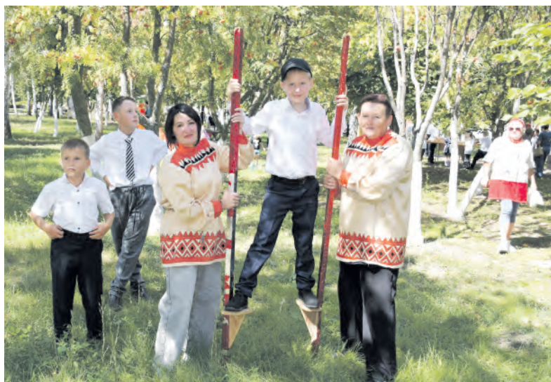
Забывтая русская забава оказалась весьма популярной.