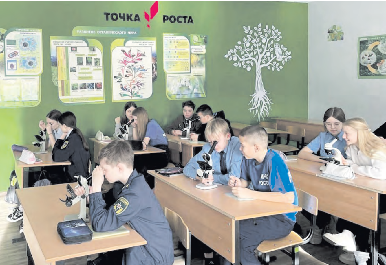
На базе работающей в школе «Точки Роста» дети имеют возможность углублять свои знания по физике, химии и биологии.