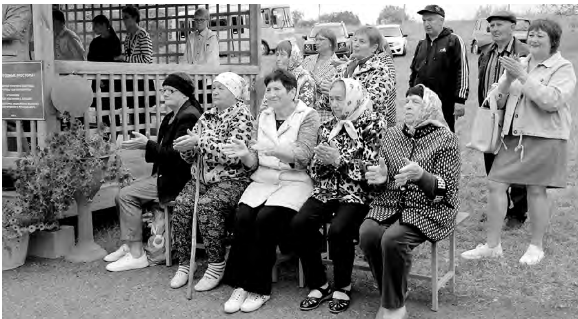
В памятном событии приняли участие хуторяне, школьники и жители Большовской территории.

По данным исследователей дубу-долгожителю примерно 400 лет. Обхват ствола достигает 4,5 метров, а его высота превышает 50 метров.