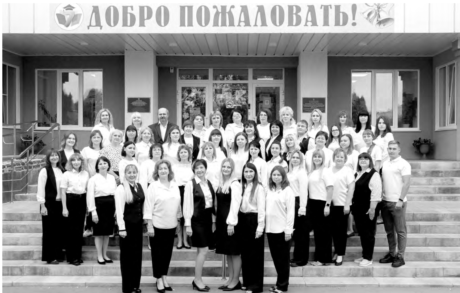
Коллектив Алексеевской средней школы № 7 достойно выполняет дело всей жизни.