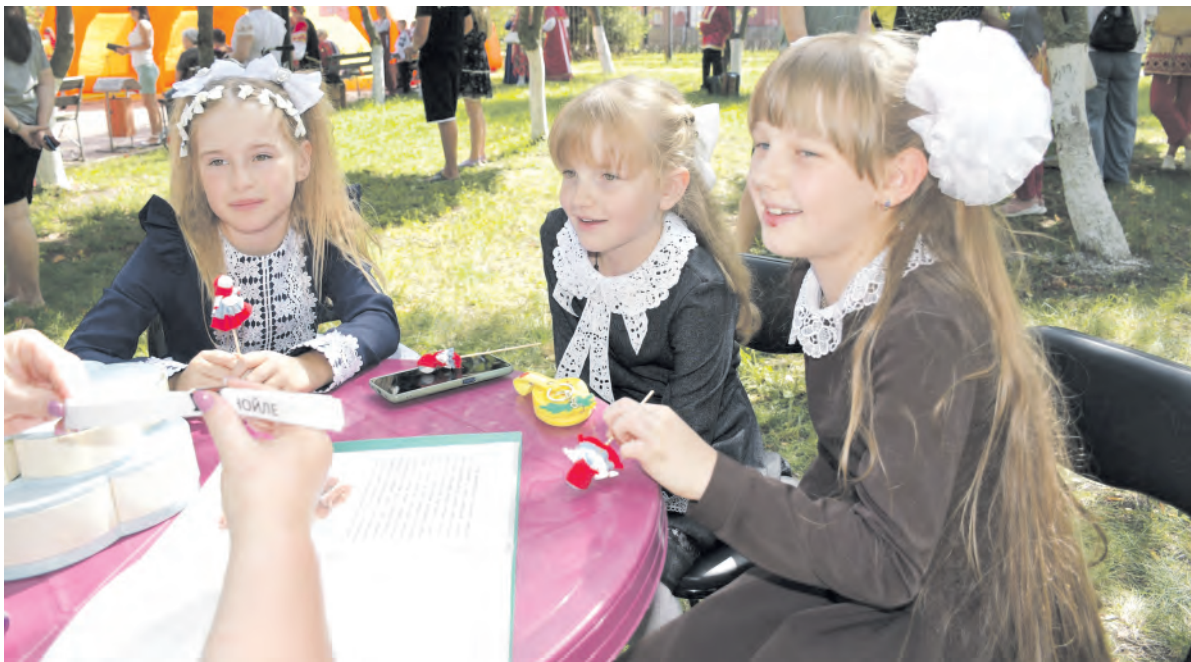
На игровой площадке детской библиотеки было особенно интересно.

Заря Учредители: министерство общественных коммуникаций Белгородской области; администрация Алексеевского городского округа, администрация Красненского района Белгородской области, Совет депутатов Алексеевского городского округа Белгородской области, муниципальной совет муниципального района «Красненский район», АНО «Редакция газеты «Заря».