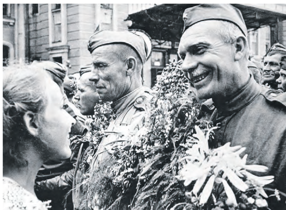
Не описать словами радость встречи с вернувшимися с полей сражений солдатами.

Заря Учредители: департамент внутренней и кадровой политики Белгородской области; администрация Алексеевского городского округа, администрация Красненского района Белгородской области, Совет депутатов Алексеевского городского округа Белгородской области, муниципальной совет муниципального района «Красненский район», АНО «Редакция газеты «Заря».