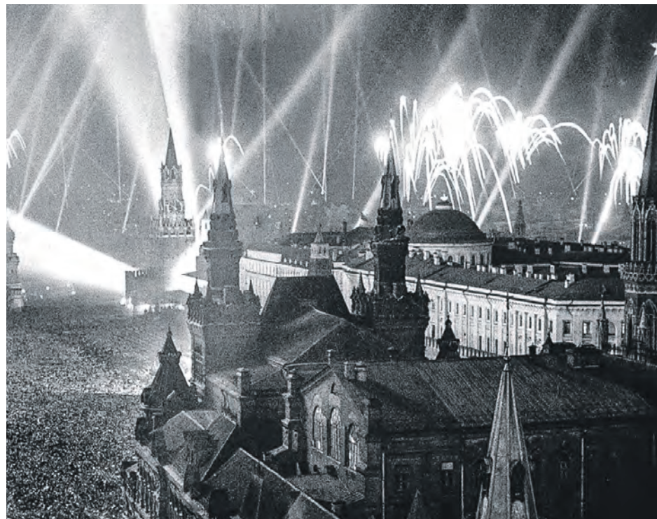
Салют на Красной площади 9 мая 1945 года.