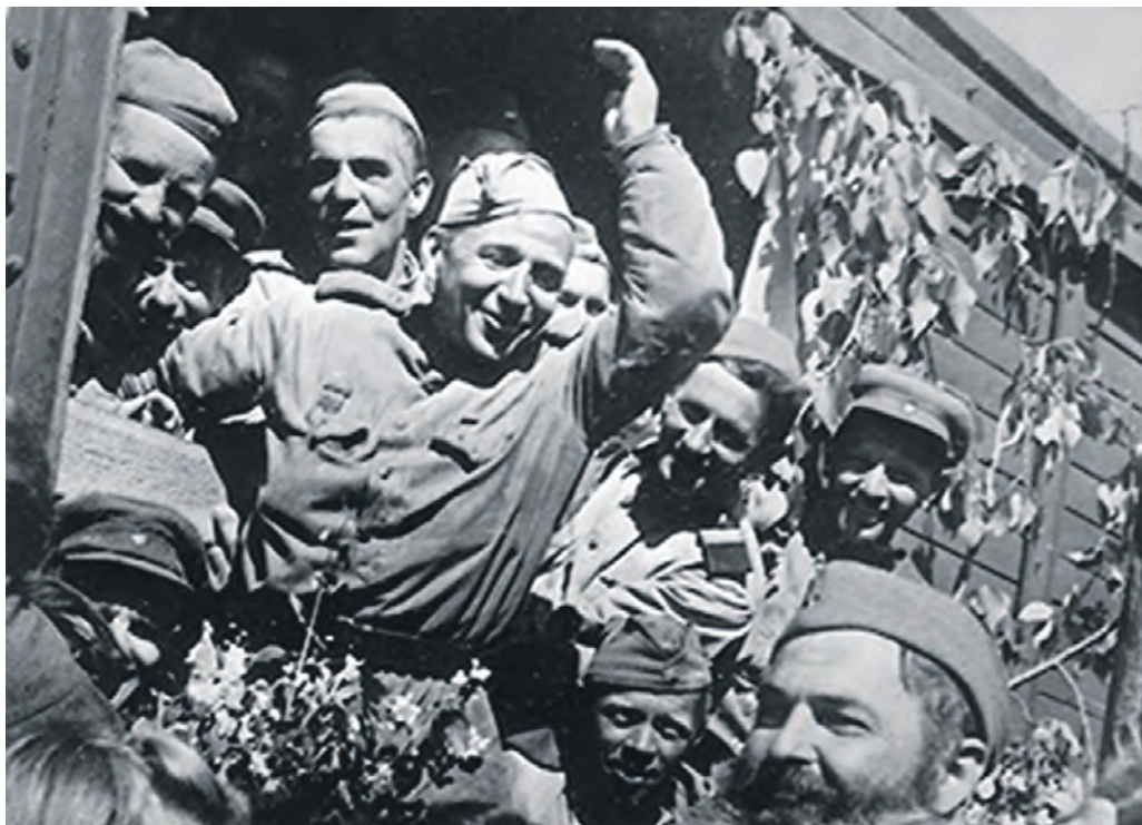
Воины-победители возвращаются на Родину.