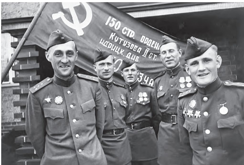
Герои Советского Союза Мелитон Кантария (слева) и Михаил Егоров (справа), водрузившие Знамя Победы над Рейхстагом.

Снимки взяты из свободного доступа в сети Интернет.