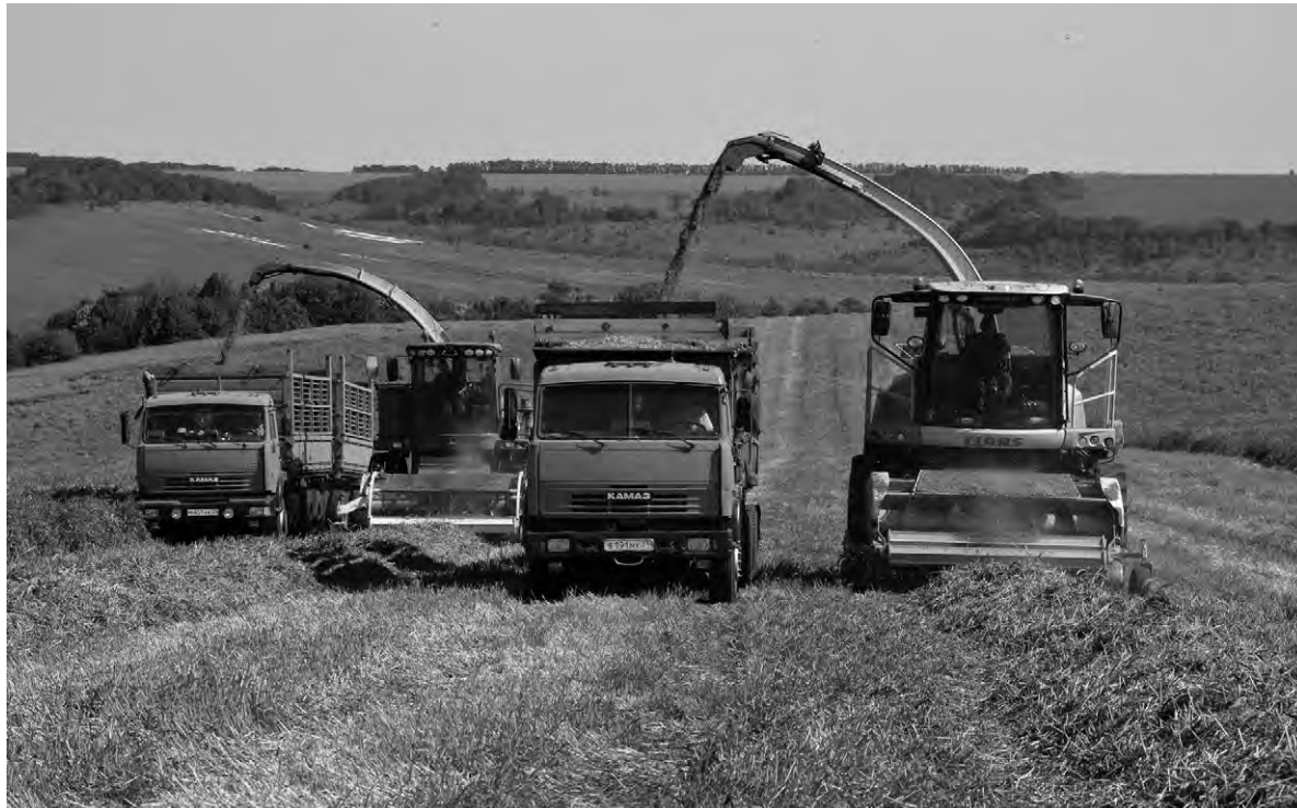
Тучные травы, выращенные на полях Агросоюза «Авида», обеспечили бурёнкам сетищенского ЗАО «Молоко Белогорья» сытную зимовку.

Осенью текущего года произведён хороший задел под