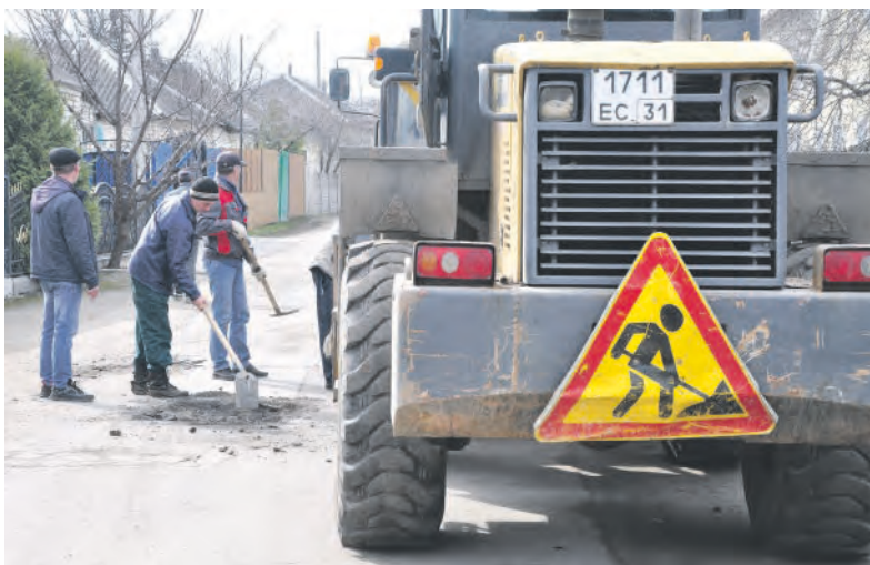
Ямка на дороге маленькая, однако заделать надо.