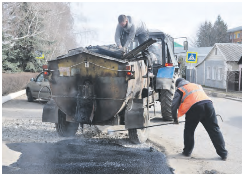
«Заплатка» на улице Слободской, где было нарушено дорожное покрытие.