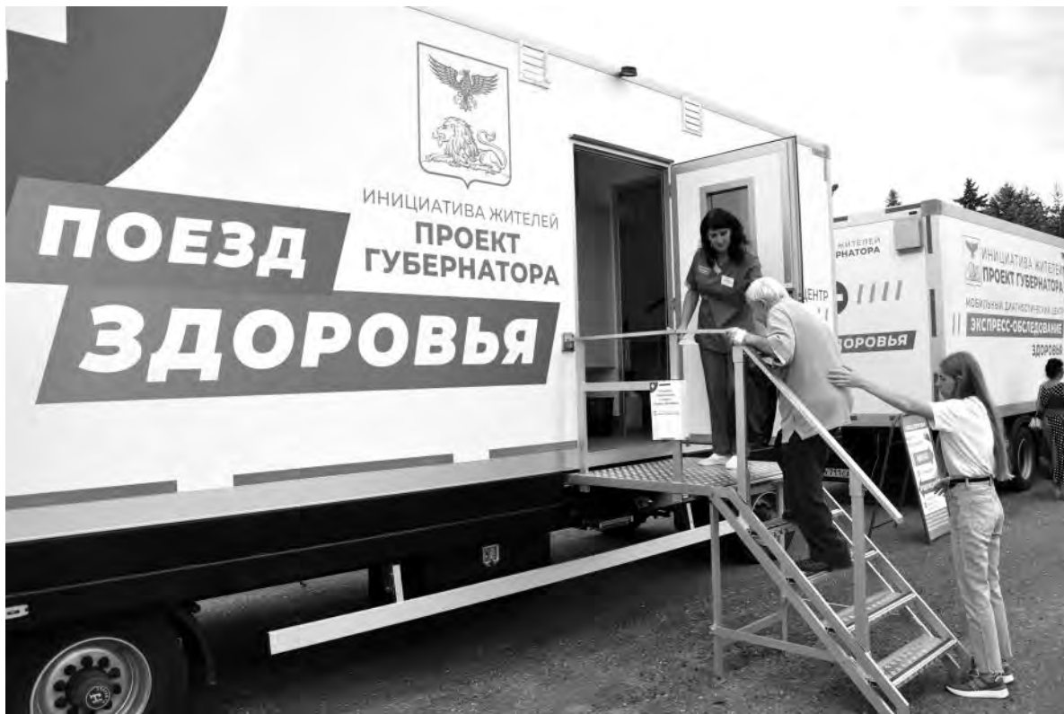
«Поезд здоровья» действует в микрорайоне стадиона «Южный» города Алексеевки.