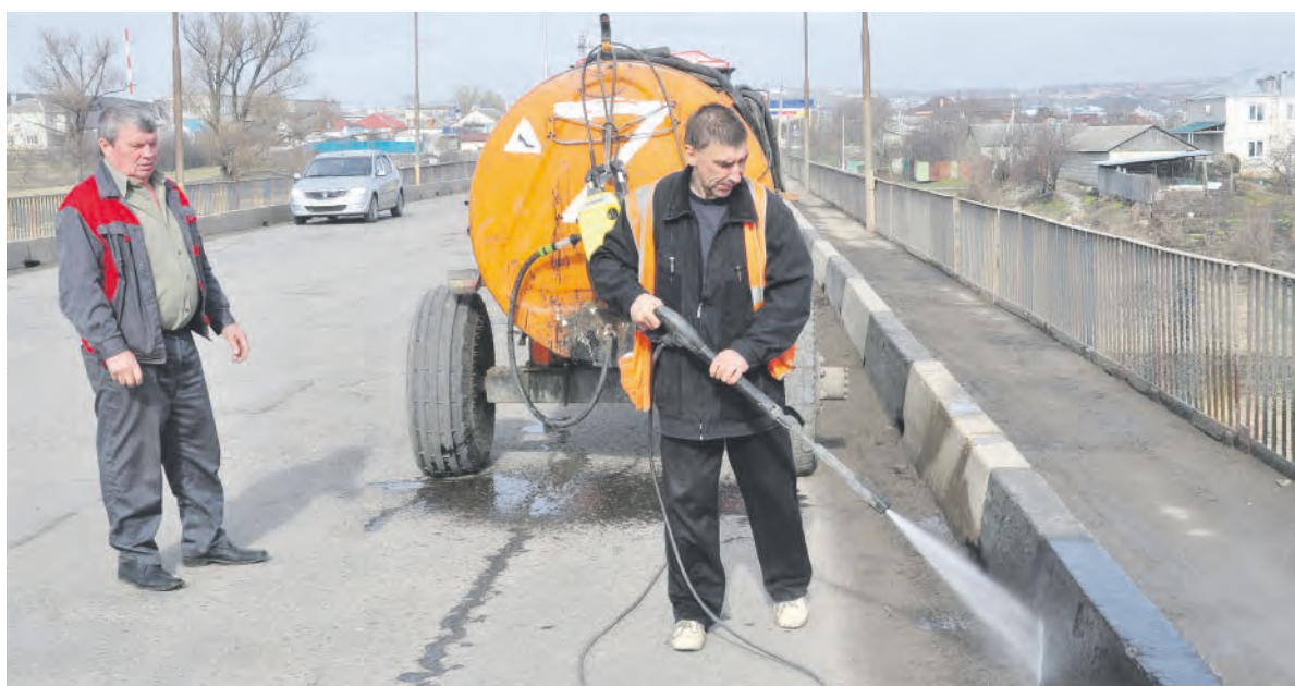
Вот так «умывают» Николаевский мост через Тихую Сосну.

Заря Учредители: министерство общественных коммуникаций Белгородской области; администрация Алексеевского городского округа, администрация Красненского района Белгородской области, Совет депутатов Алексеевского городского округа Белгородской области, муниципальной совет муниципального района «Красненский район», АНО «Редакция газеты «Заря».