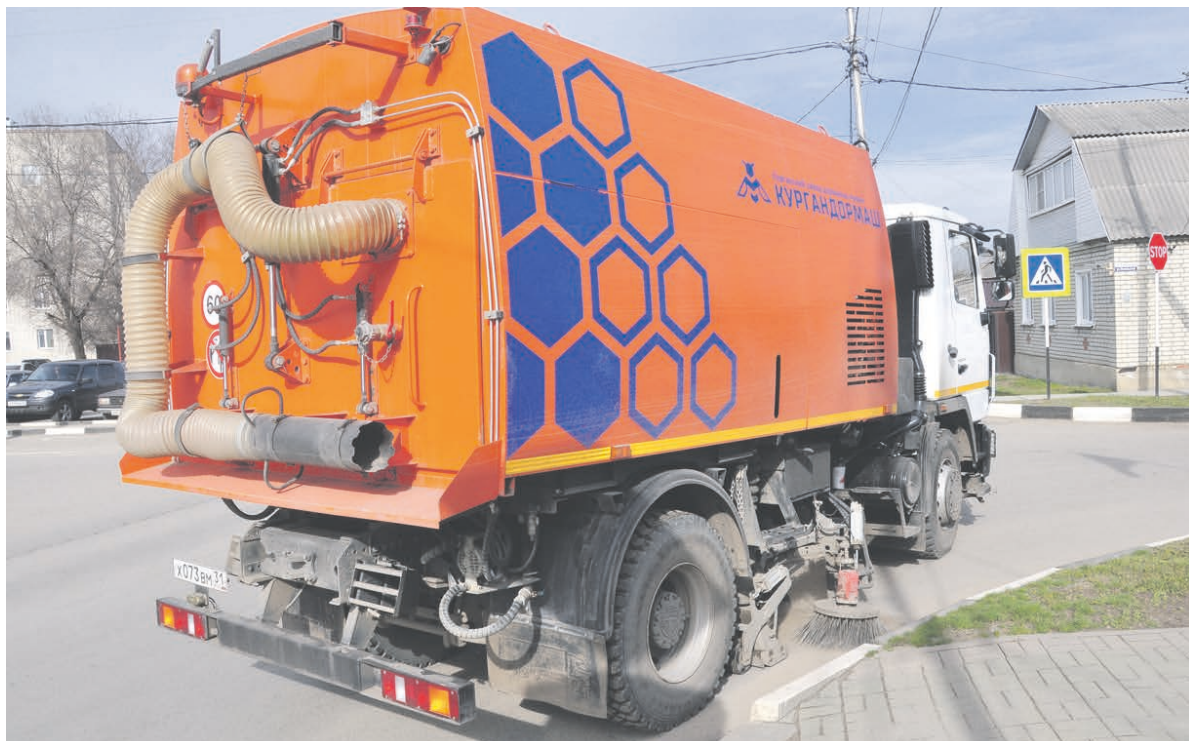
Дорожный «пылесос» особенно тщательно подчищает участки дорог возле бордюров.