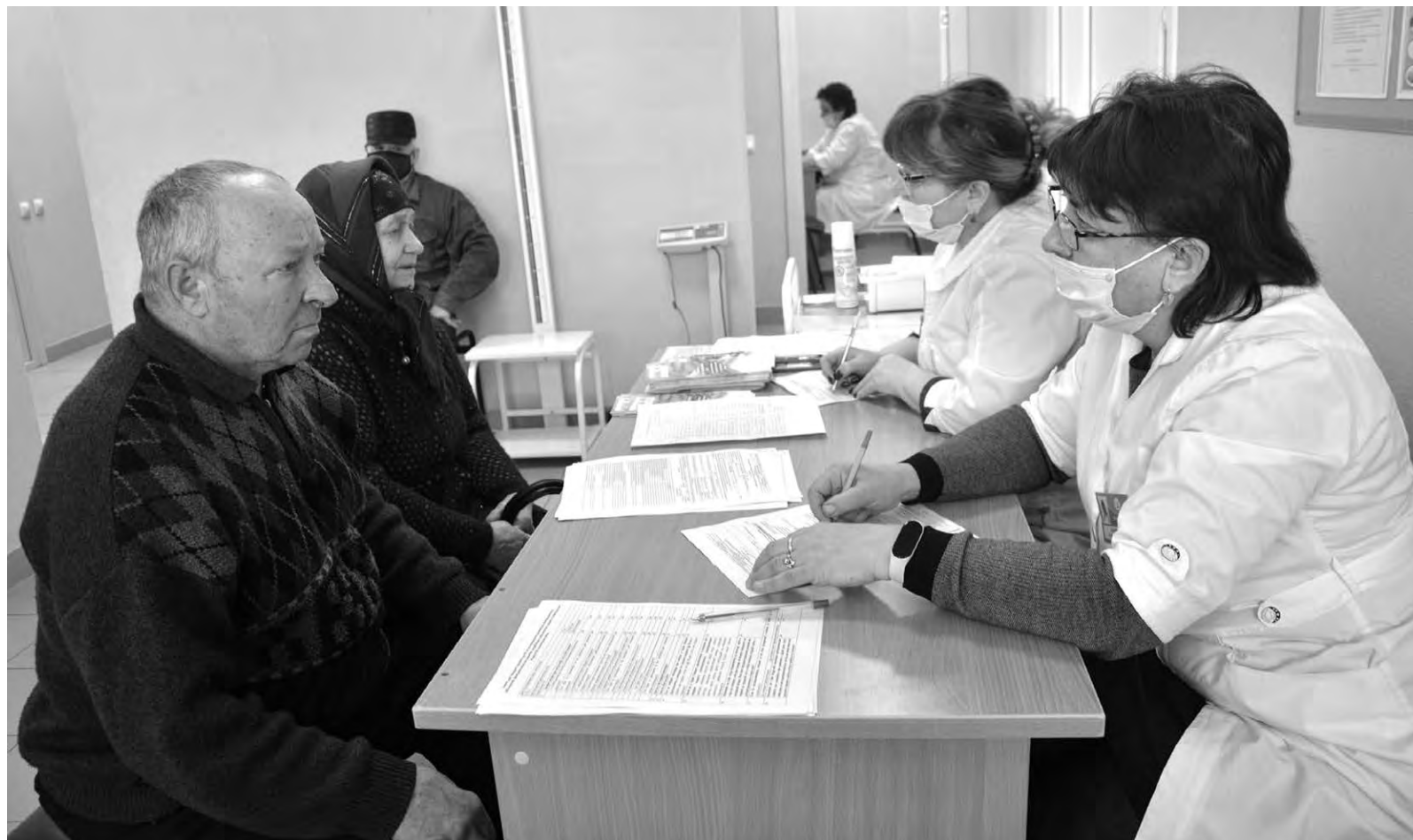
Приезду медицинского экспресса особенно рады пожилые жители.

В начале текущего года «Поезд здоровья» побывал в Готовье и в селе Камызино. За пять дней здесь прошли комплексное обследование 244 человека. В Камызине медработники выполнили 36 флюорографических обследований и столько же маммографий, четыре спирометрические диагностики. Врач терапевт осмотрел 124 пациента, стоматолог — 118, невролог — 20, эндокринолог — 25, дерматове-