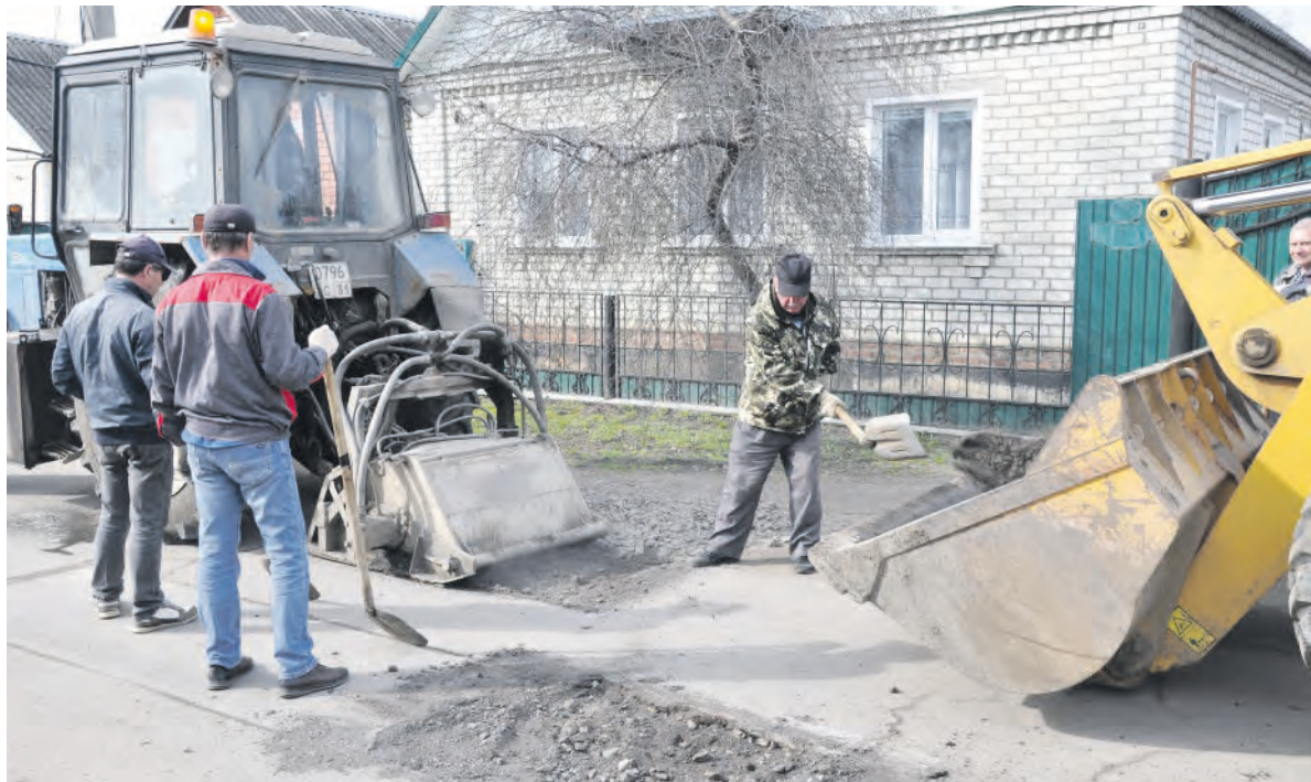
Ремонтные работы в 3-м переулке Маяковского.