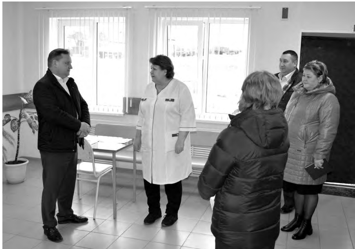
Члены рабочей группы во время посещения офиса семейного врача.

Вячеслав ГЛАДКОВ, губернатор Белгородской области.