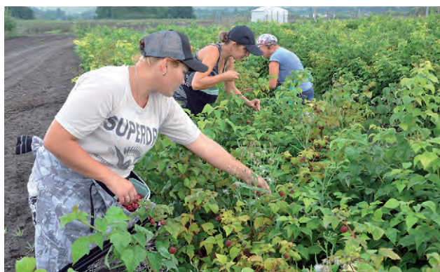
Соб. инф.

В настоящее время в «Колтуновских садах» активно идёт сбор фруктов и ягод: алычи, вишни, малины, ранних сортов яблок. Урожай — всем на загляденье!