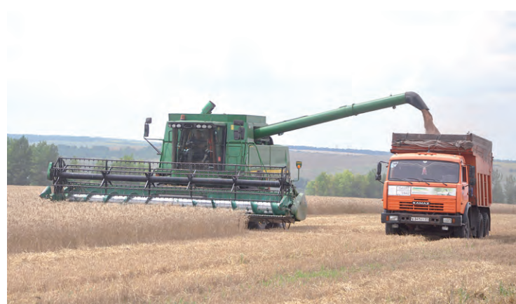
Появилось погодное «окно» — и техника приступила к жатве.