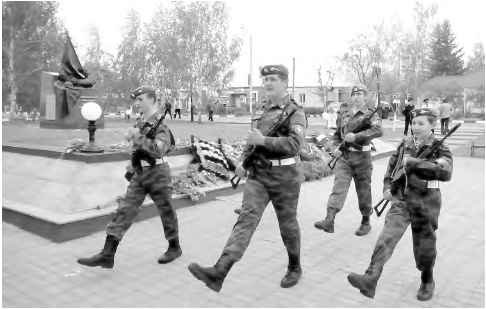
Курсанты военно-патриотического клуба «Поиск» отрабатывают строевую подго-товку.