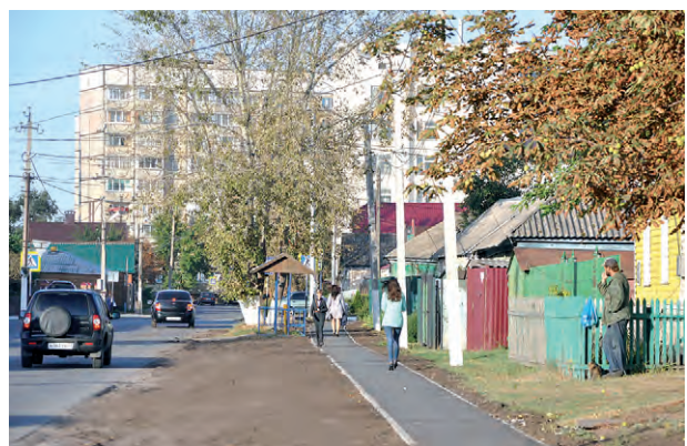
Соб. инф.

Заметными и очевидными становятся перемены в облике Алексеевки, вызванные продолжением благоустройства. Обращают на себя внимание не только масштабные работы, такие, как обновление дворовых территорий, но и менее затратные. На снимке: новая асфальтовая пешеходная дорожка, проложенная по улице Степана Разина от пересечения с улицей Льва Толстого до улицы Некрасова. Во время учебного года учащимся созданы дополнительные удобства для посещения средней школы № 2 и возвращения домой.