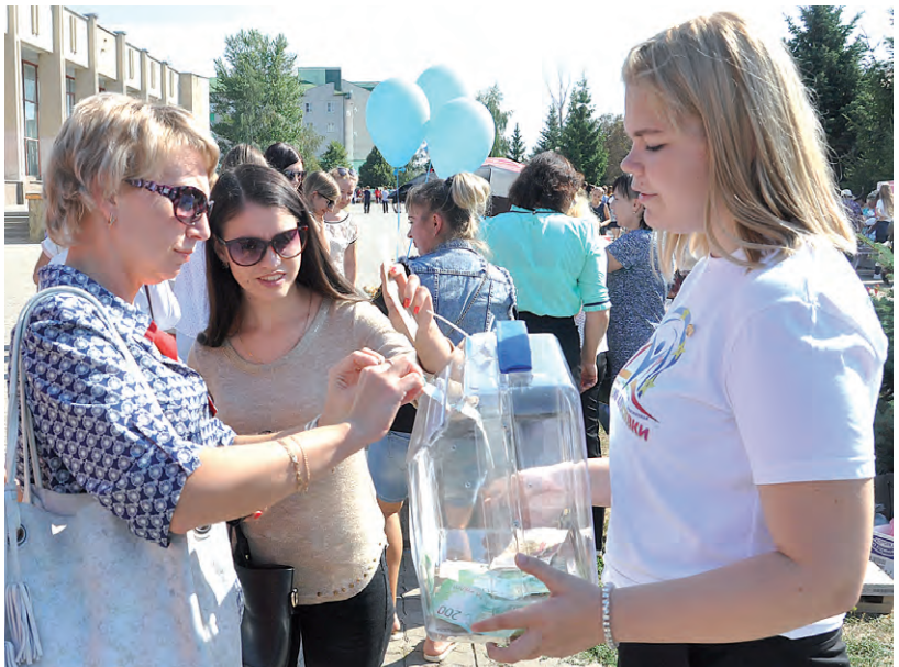
Каждый из присутствовавших мог внести свою лепту в виде пожертвований.