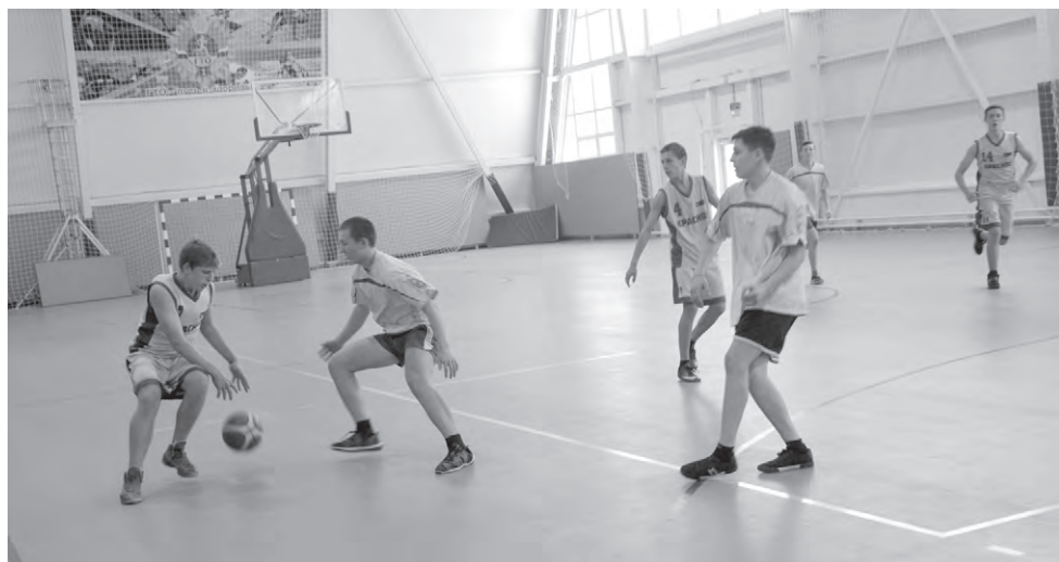
За призы боролись более сотни баскетболистов.

М. МАМОНОВА , заместитель директора Красненской детско-юношеской спортивной школы.