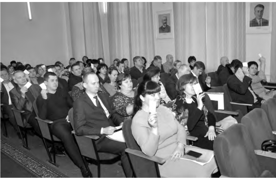
Рабочий момент конференции.