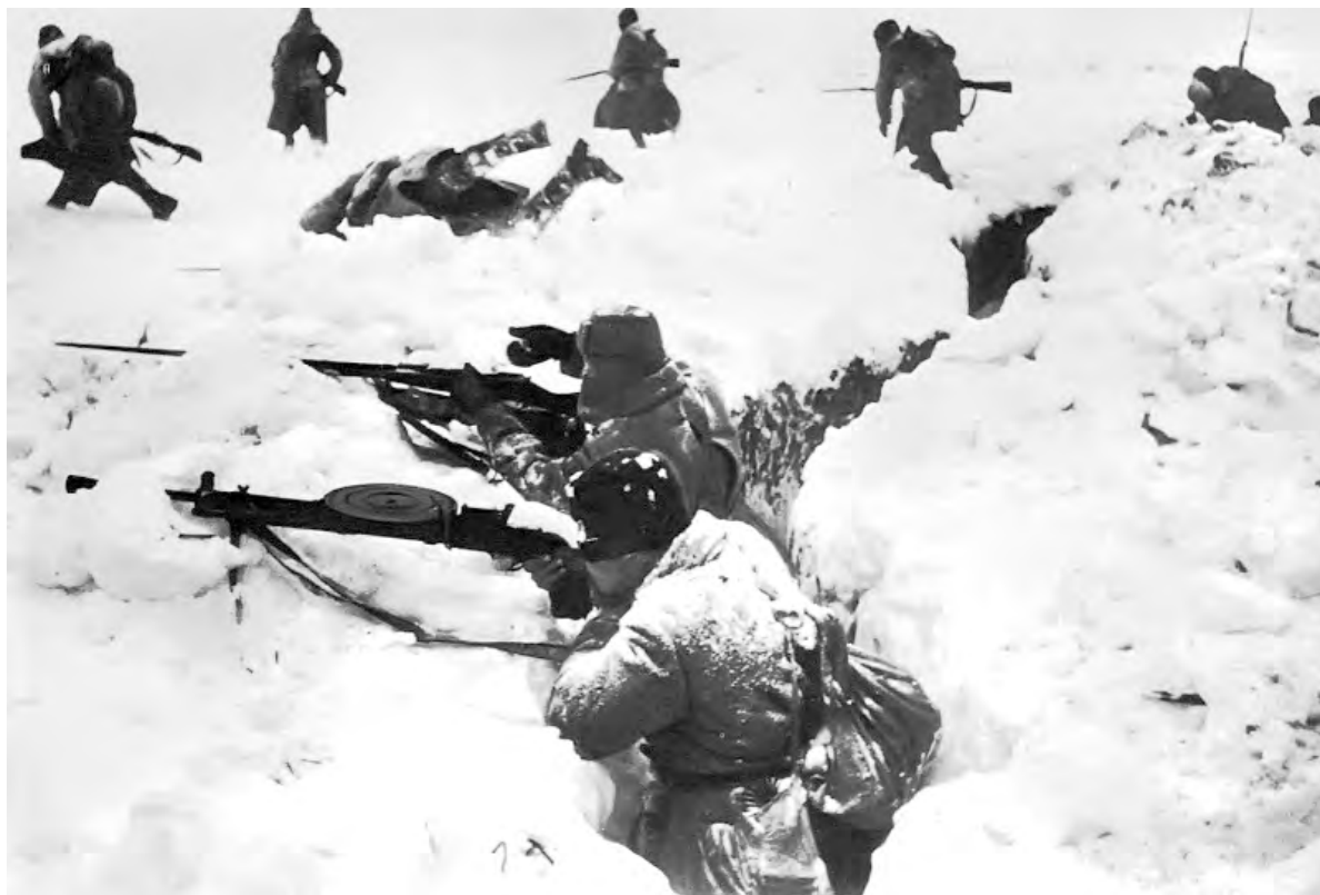
Зимние бои 1943-го года.

Бинокор ещё раз посмотрел в бинокль и сразу же перешёл к детальной конкретизации боевой задачи по овладению Алексеевкой. Выполняя её, ко-