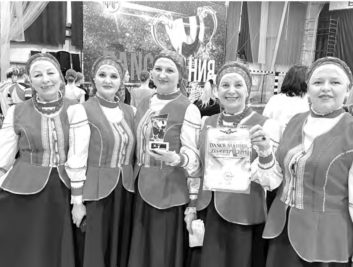
Участницы хореографического коллектива «ВЕРА» после награждения.

нее время они собираются вместе и оттачивают каждое движение по несколько раз. Благодаря этому их выступления дарят зрителям радость, а им — вдохновение. Марина ПЕТРИЩЕВА, методист Красненского отдела культуры.