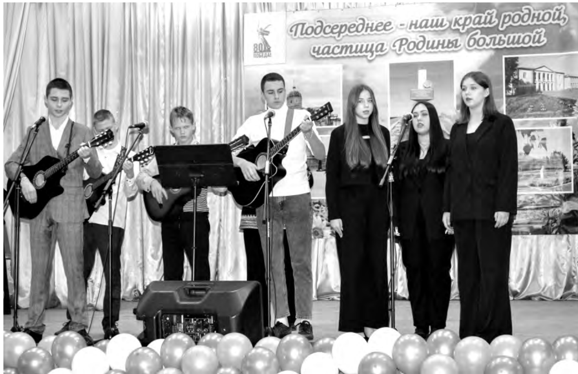
Старт культурно-спортивной эстафете дан на сцене Центра культурного развития села Подсереднее.

Патриотичной была концертная программа от артистов Иловского Центра культурного развития, музыкальной школы и талантливых жителей села. Никого не оставили равнодушными песни в исполнении народных самодеятельных коллективов: вокального ансамбля «Судьба» и фольклорного ансамбля «Сударушка», солистов и дуэтов, молодёжных инструментальных коллективов. Яркие