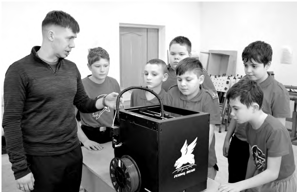
Изучение конструкции 3D-принтера входит в один из разделов уроков труда.