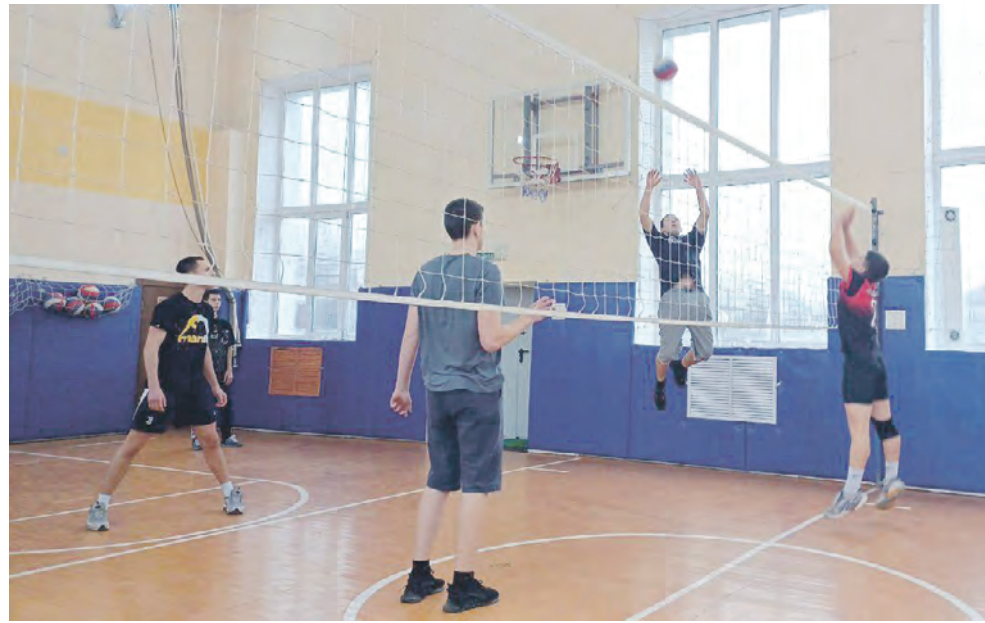
Юные волейболисты в борьбе за победу в соревнованиях.

Заря Учредители: министерство общественных коммуникаций Белгородской области; администрация Алексеевского городского округа, администрация Красненского района Белгородской области, Совет депутатов Алексеевского городского округа Белгородской области, муниципальной совет муниципального района «Красненский район», АНО «Редакция газеты «Заря».