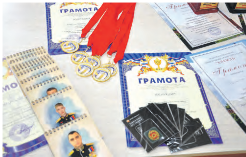
Заслуженные награды ждут своих победителей.