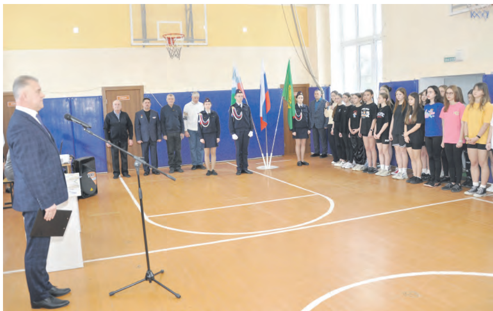
Торжественное построение участников — неотъемлемая часть волейбольного матча.