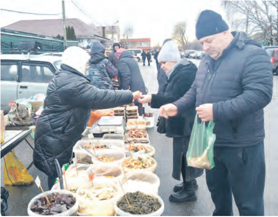
Соб. инф.

Уважаемые жители и гости Алексеевского муниципального округа! Каждое воскресенье в нашем городе на предрыночной площади (ул. Лермонтова) проводится продовольственная ярмарка. В продаже всегда имеется широкий ассортимент от фермеров, производителей и предпринимателей. В наличии плодоовощная продукция, свежие рыба и мясо, мёд, деликатесы и многое другое. Ярмарка работает каждое воскресенье с 8 до 12 часов. Приглашаем вас за вкусными покупками. По вопросам участия в ярмарке можно обращаться по телефонам 8 (47234) 3-00-72, 3-04-46, 3-14-70.