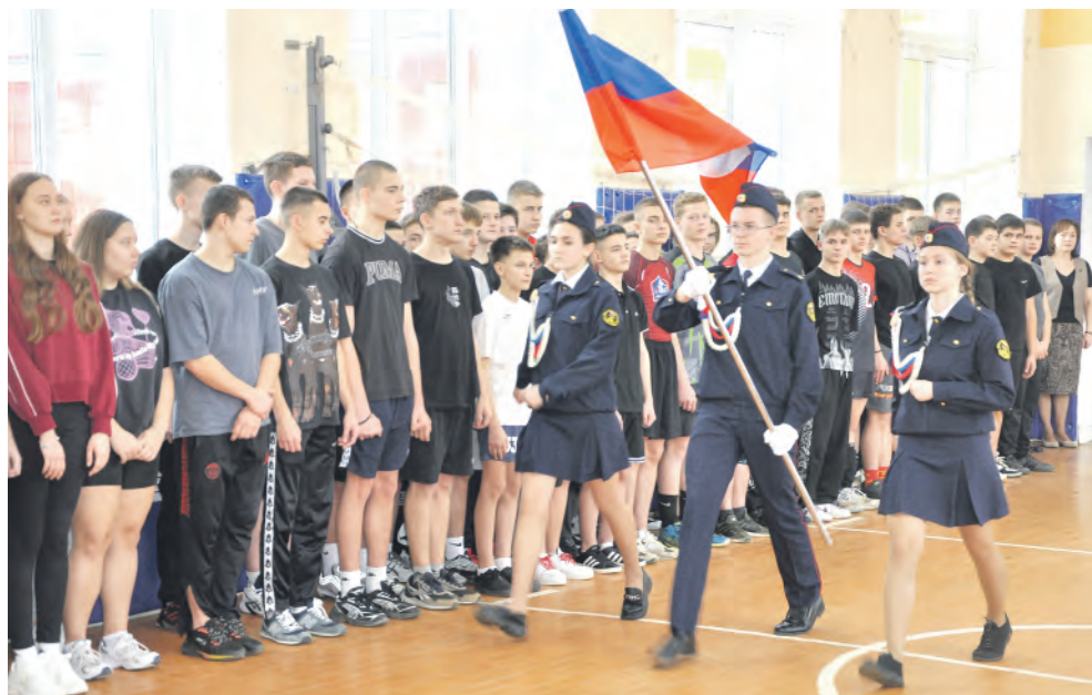
Официальное начало турнира началось с выноса Государственного флага РФ.