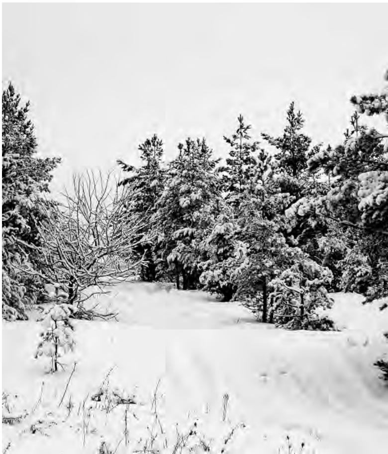
Начало февраля порадовало снегом.