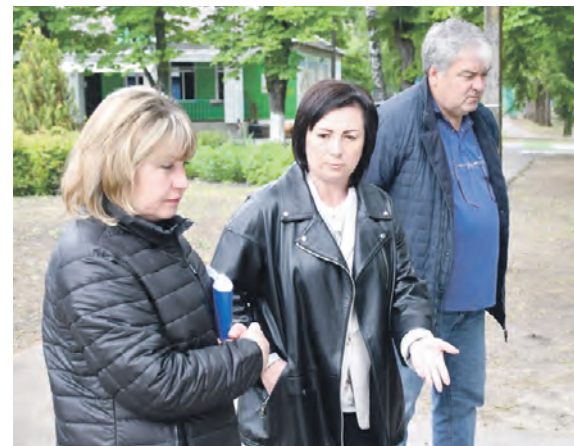
Соб. инф.

Кроме того, первый заместитель главы администрации горокруга встретила с многодетными семьями в рамках муниципального этапа форума «Белгородская семья», который прошёл в Центре культурного развития «Солнечный».