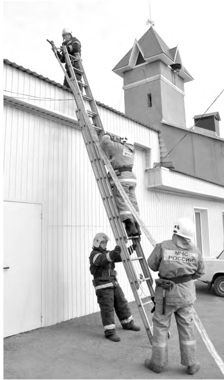
Отработка нормативов — занятие ежедневное.

— По прибытии пожарные определяют, что и где горит, какие действия следует предпринимать, именно в первые минуты решается исход битвы с огнём. Необходимо за полторы-две минуты развернуть рукавные линии и подключить их к источнику водоснабжения. После ликвидации возгорания руководитель тушения пожара (обычно это начальник караула или командир отделения) должен доложить в пожарную часть по радиостанции о результатах операции, составить донесение о пожаре, сделать 6-10 снимков места происшествия.