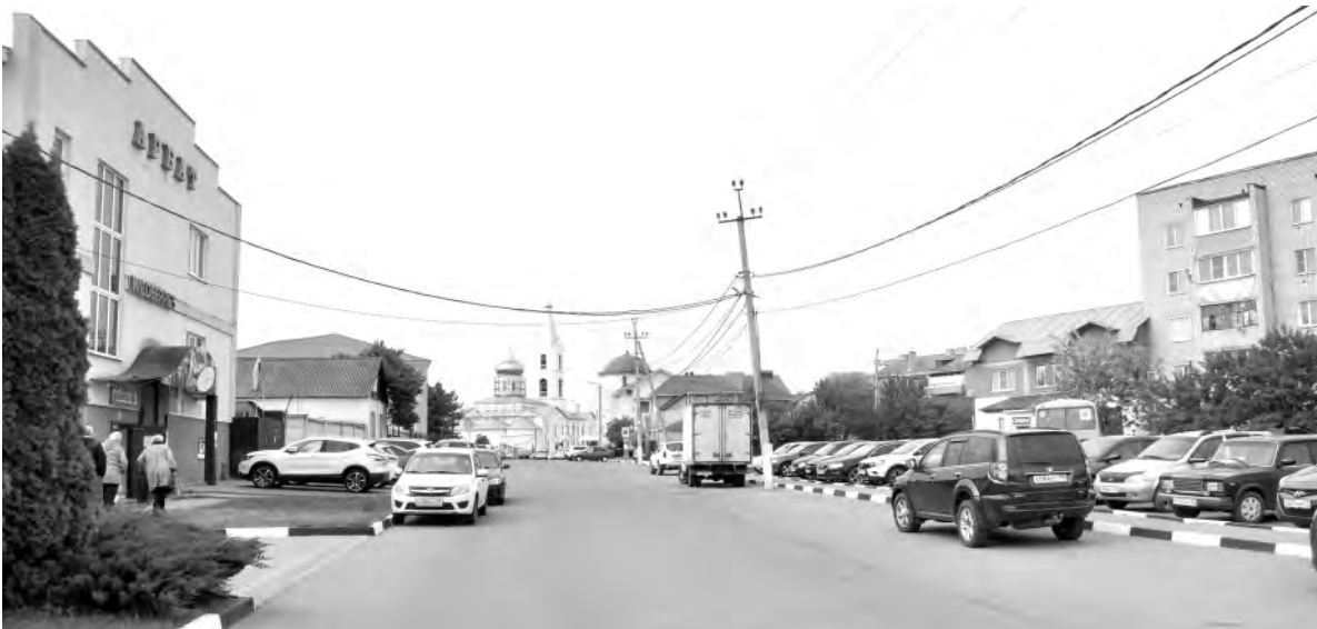
Это же место в наши дни.