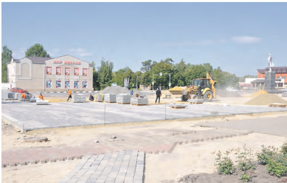
Благоустройство площади стало возможным благодаря победе во Всероссийском конкурсе лучших проектов.