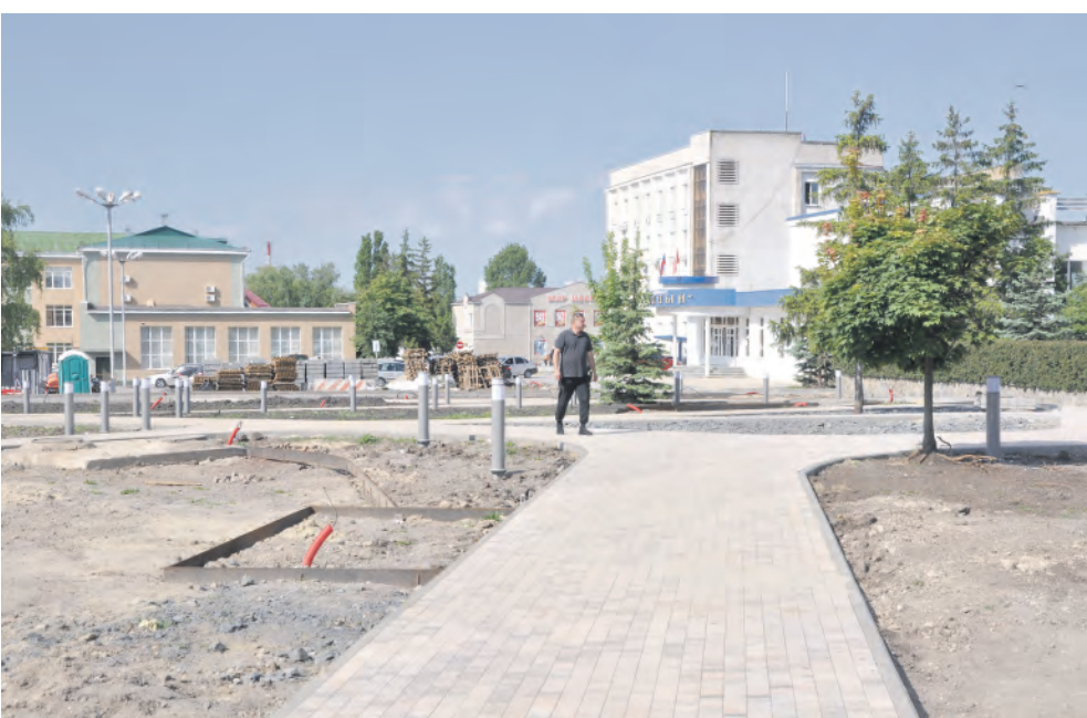
Общественное пространство преобразится в рамках проекта по формированию комфортной городской среды.