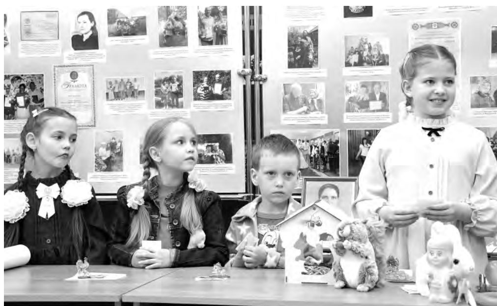
Юные посетители познавательного вечера тоже не скучали.