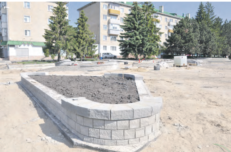
Новые малые архитектурные формы.