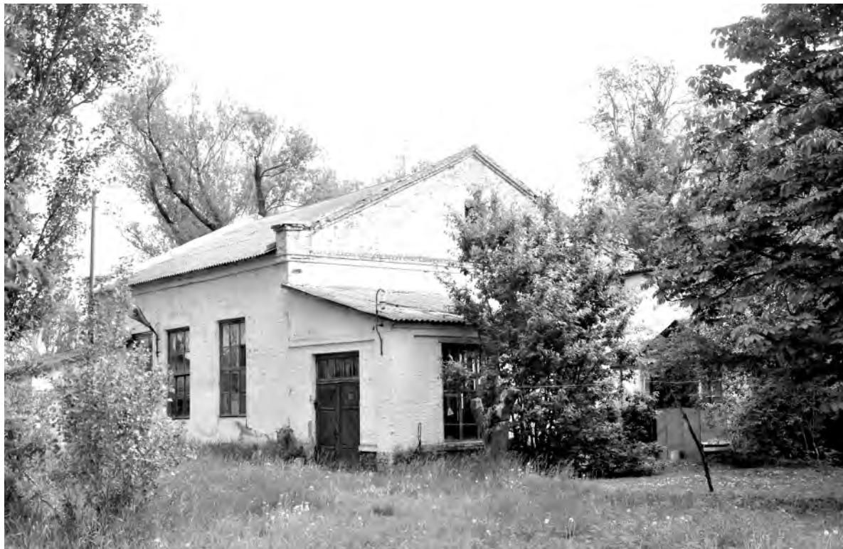
То самое здание водокачки рядом с Центральным городским парком.