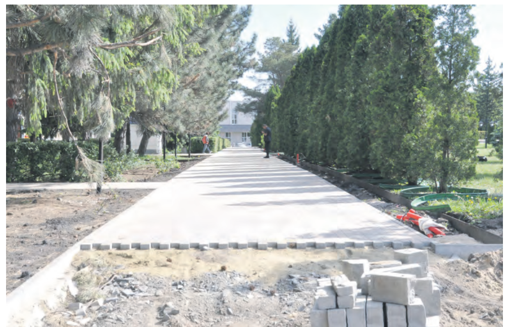
Обновится и прилегающая к площади Победы территория.

Заря Учредители: министерство общественных коммуникаций Белгородской области; администрация Алексеевского городского округа, администрация Красненского района Белгородской области, Совет депутатов Алексеевского городского округа Белгородской области, муниципальной совет муниципального района «Красненский район», АНО «Редакция газеты «Заря».