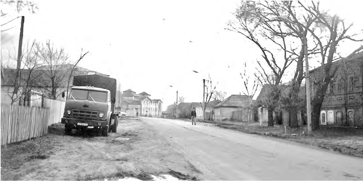
Ул. Никольская (Плеханова), 1980-е годы.