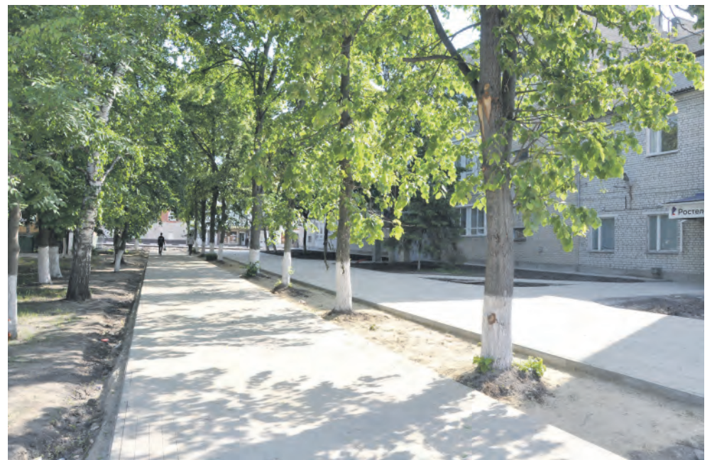
Аллея между Алексеевским колледжем и зданием Почты России.