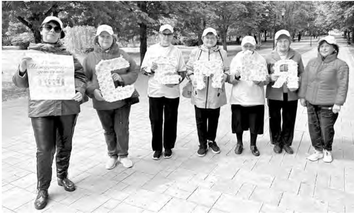
«Серебряные» волонтеры Алексеевского горокруга во время акции.

Согласитесь, когда в семье появляются дети, жизнь супругов начинает играть новыми красками. Эта радость не-