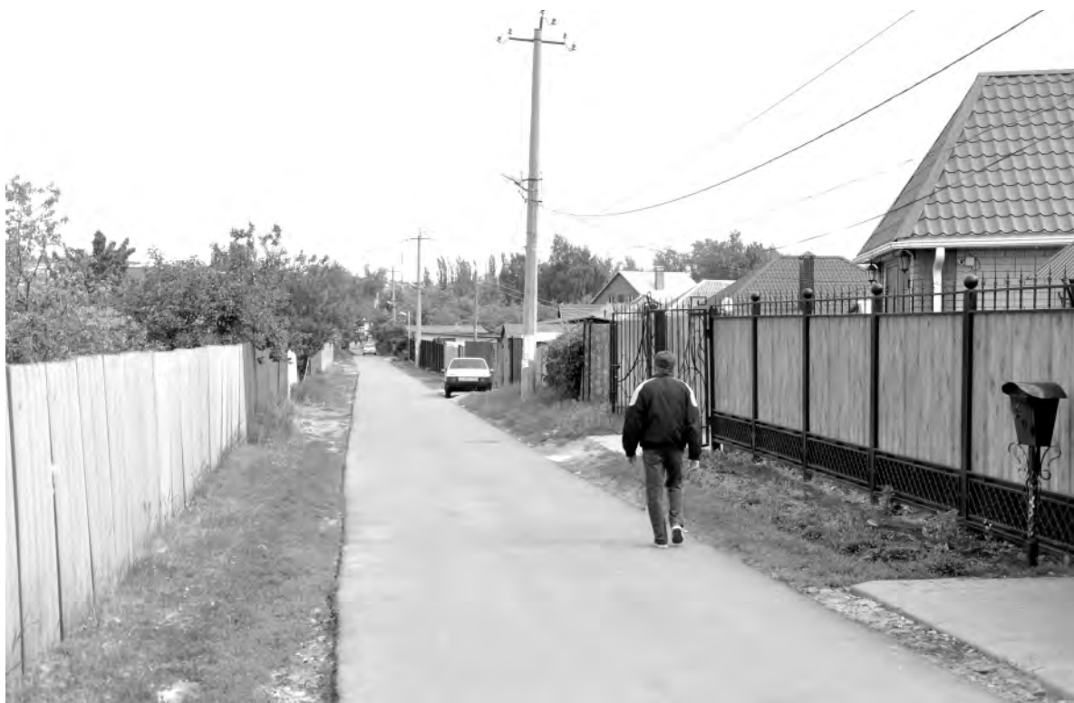
Узкоколейка (ныне переулок Фрунзе).