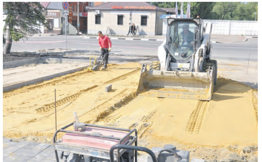
Работа «кипит» с утра до вечера. Демонтажные работы завершены. Уложена часть тротуарного покрытия.