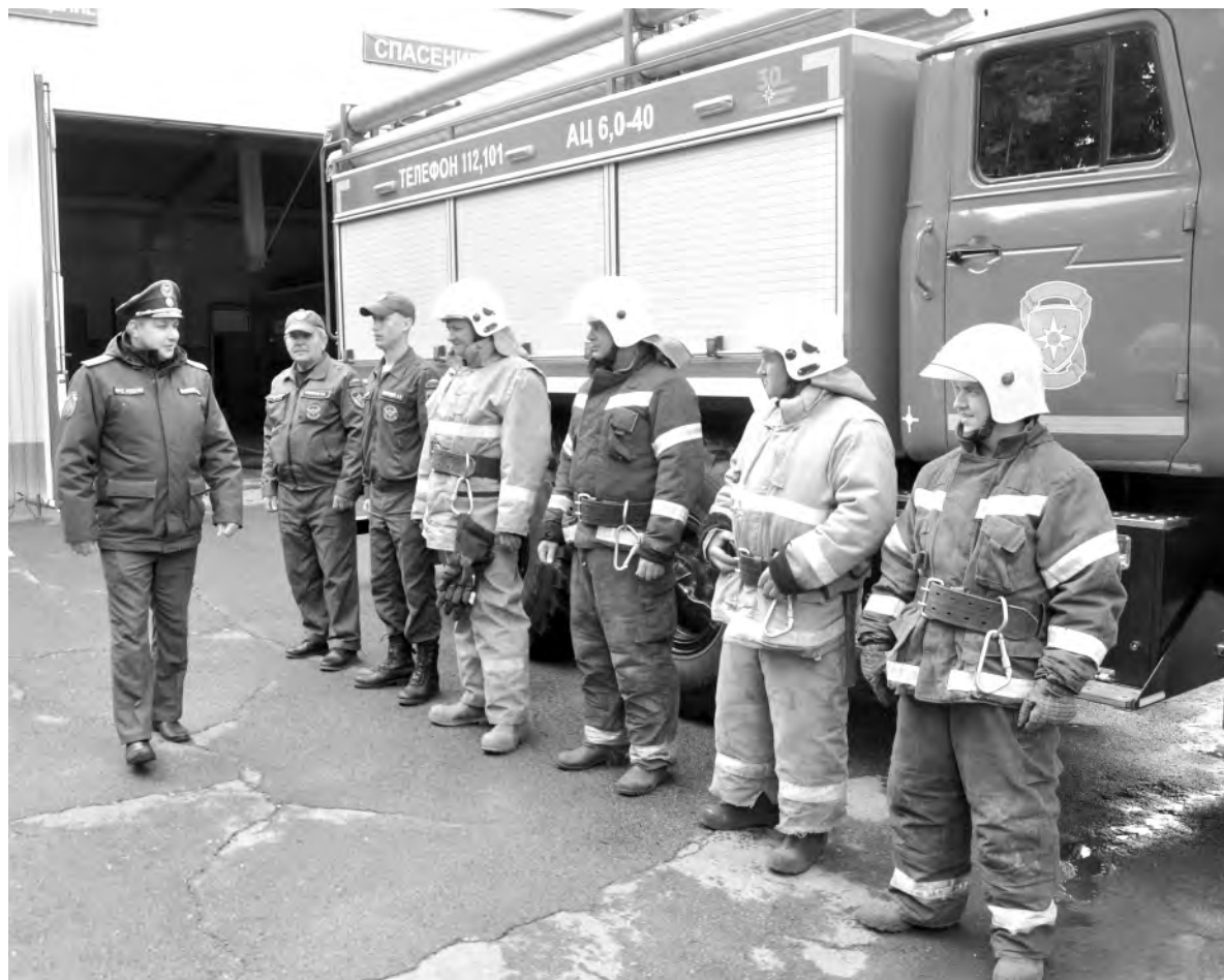
Утренний развод. Все должны быть в форме.

Вячеслав ГЛАДКОВ, губернатор Белгородской области.