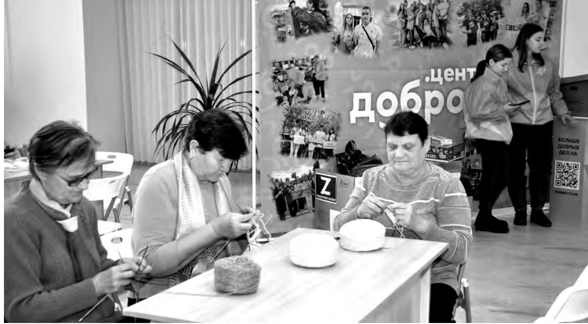
Своим мастерством по вязанию носков делятся алексеевские геронтоволонтеры социальной гостиной «Вдохновение». Тёплые изделия они отправят бойцам «за ленту».