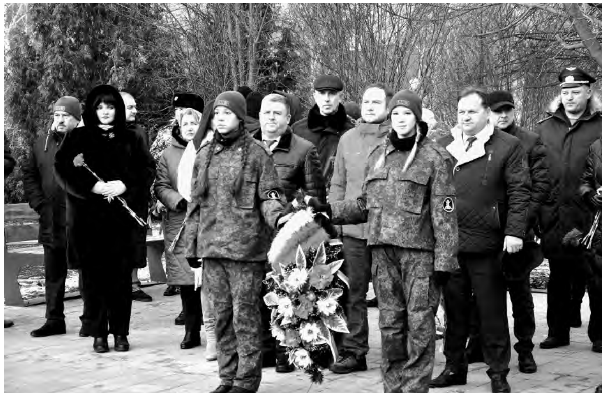
Алексеевцы пришли почтить память земляков, участников локальных войн и вооружённых конфликтов.

В школах района прошли торжественные линейки и уроки мужества. Дети исполнили гимн Российской Федерации и прочли стихотворения о доблести русских солдат. Активисты «Движения Первых» приняли участие во многих мероприятиях. Среди них — экскурсионная поездка в Белгородский музей-диораму «Огненная дуга», где новоуколовские школьники