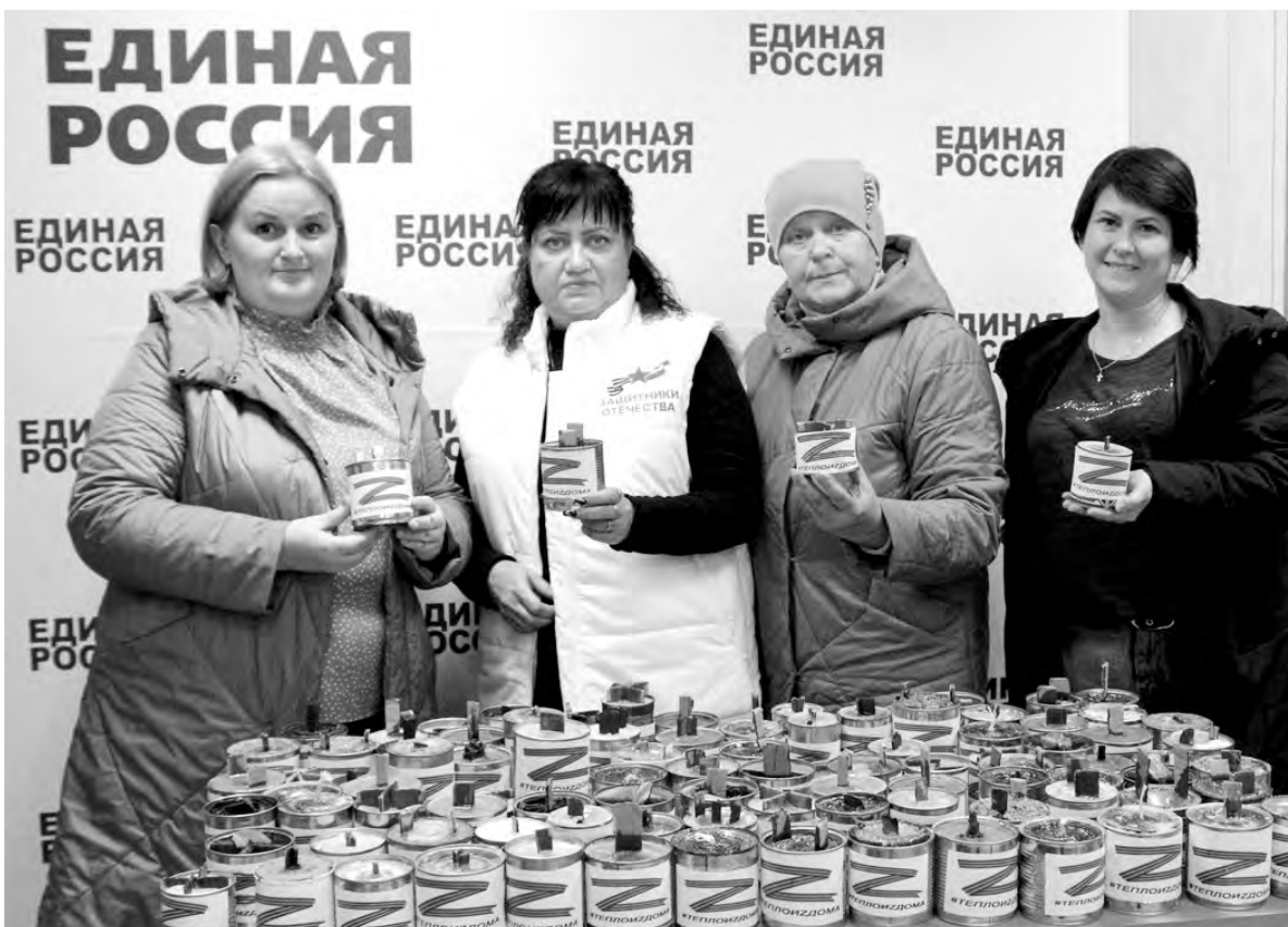
Дружный отряд красненских добровольцев.