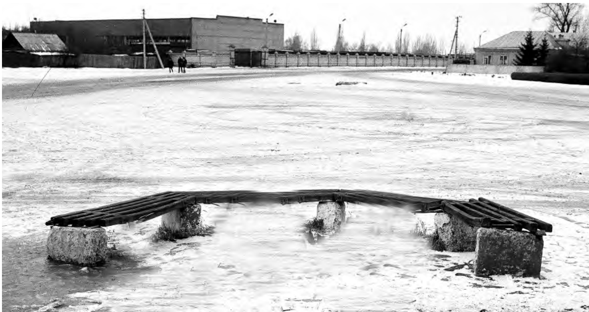
Перед Центральным рынком, 1990-е годы.