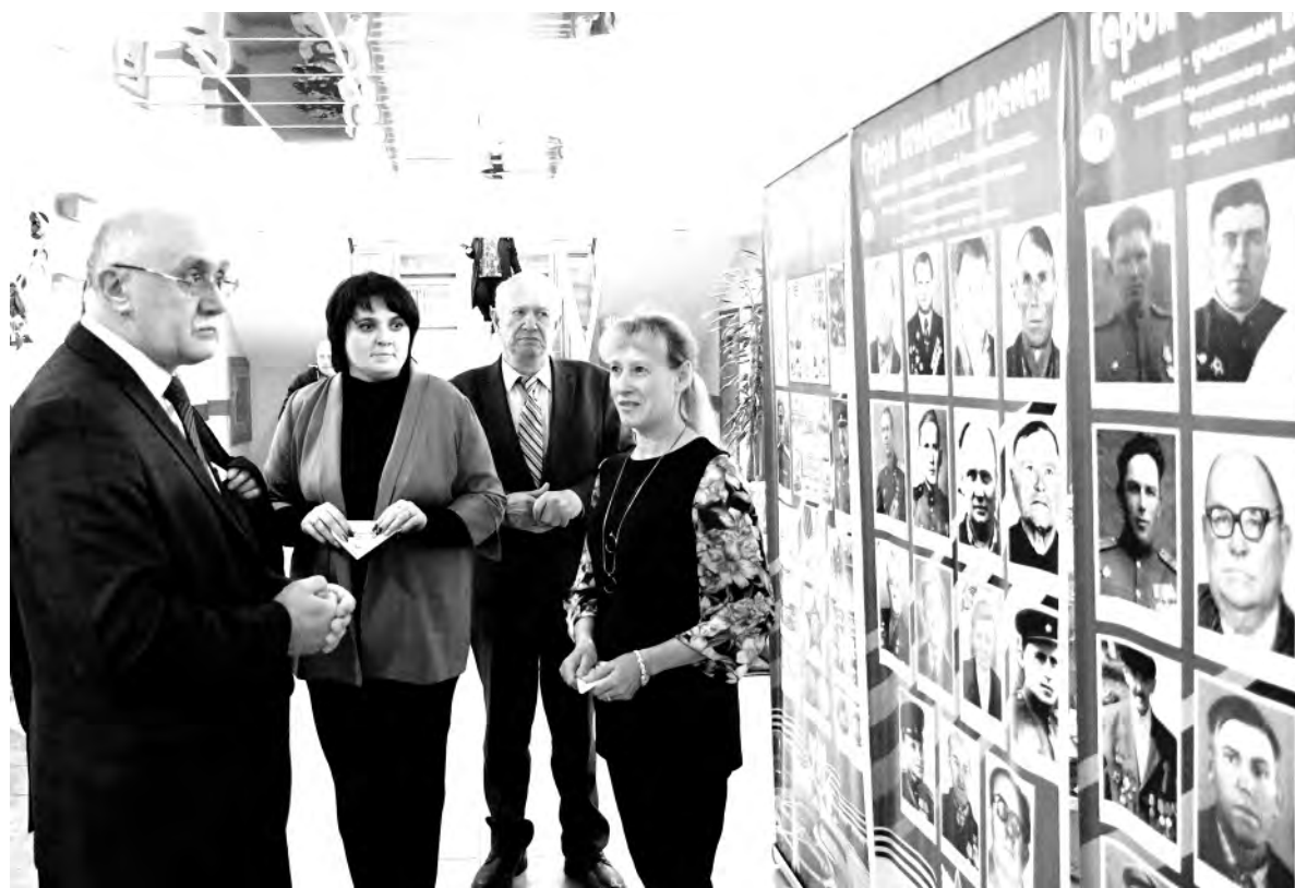
Участники мероприятия «Во славу Героев России» знакомятся с выставкой фотографий красненских ветеранов Великой Отечественной войны.

наглядно ознакомились с историей Прохоровского танкового сражения. Учащиеся района убрали снег у памятников фронтовикам, а ещё своими руками сделали «Ёлку Герою». Это акция по изготовлению подарков для участников специальной военной операции, масштабность которой показала, насколько дети гордятся героями настоящего времени.