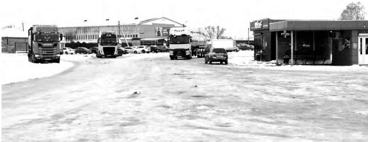
Это же место сейчас.