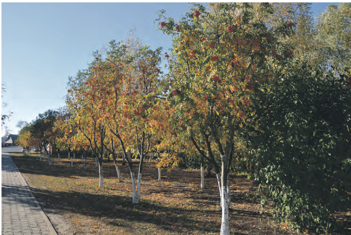
Деревья примеряют свои самые яркие наряды.

Середина октября — самое яркое время осени. Живописная роспись покрыла деревья. Переливаясь золотом, они блестят на тёплом солнышке бабьего лета. Французский публицист Альбер Камю как-то назвал осень