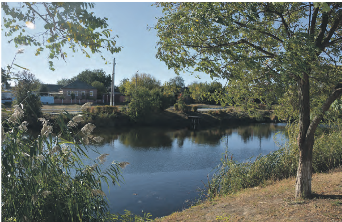
Осенняя природа полна очарования.