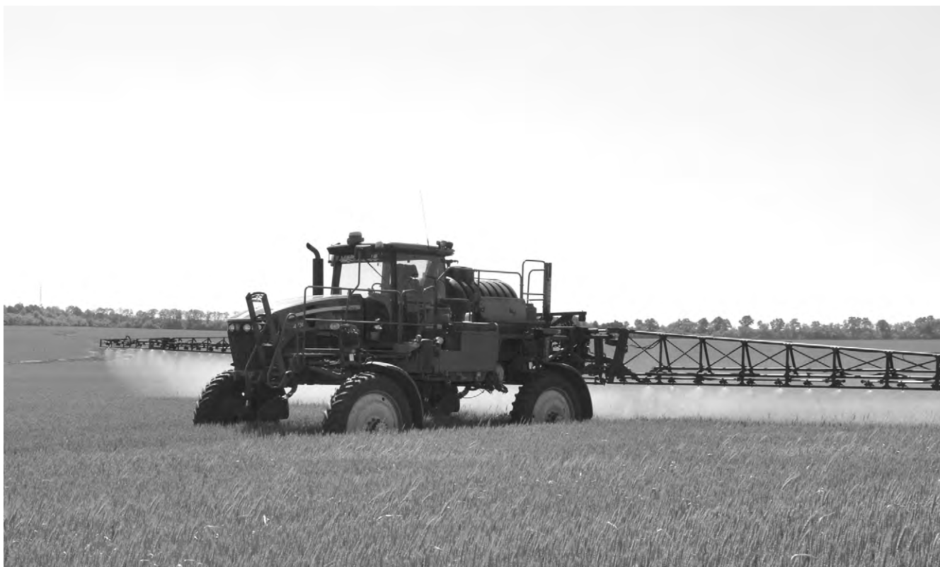
Обработка посевов озимой пшеницы на поле ООО «Агротех-Гарант» Алексеевский.