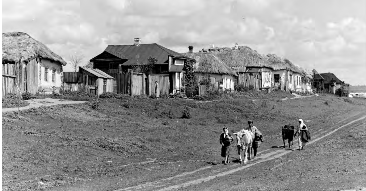
Большинство хуторов, в которых бытовали крестьянские отцы и деды, обезлюдели и исчезли. Увидеть их можно лишь на архивных фото.

В Сборнике статистических сведений по Воронежской губернии за 1892-й год отмечено 57 подворий, на которых проживало 380 «душ обоего пола». Крестьяне уже вышли из крепостной зависимости, стали вольными людьми и хозяйствовало на своей земле. Но её-то было в обрез. Хуторяне обрабатывали всего 126 десятин (примерно по две десятины на подворье), выгоны занимали 14 десятин, под усадьбами находилось 29 десятин. Лес, если можно так назвать, рос на 3 десятинах (десятина по нынешним мерам примерно равна гектару). Хутор относился к Наголинской волости. До уездного центра Бирюча он находился в 30 вер-