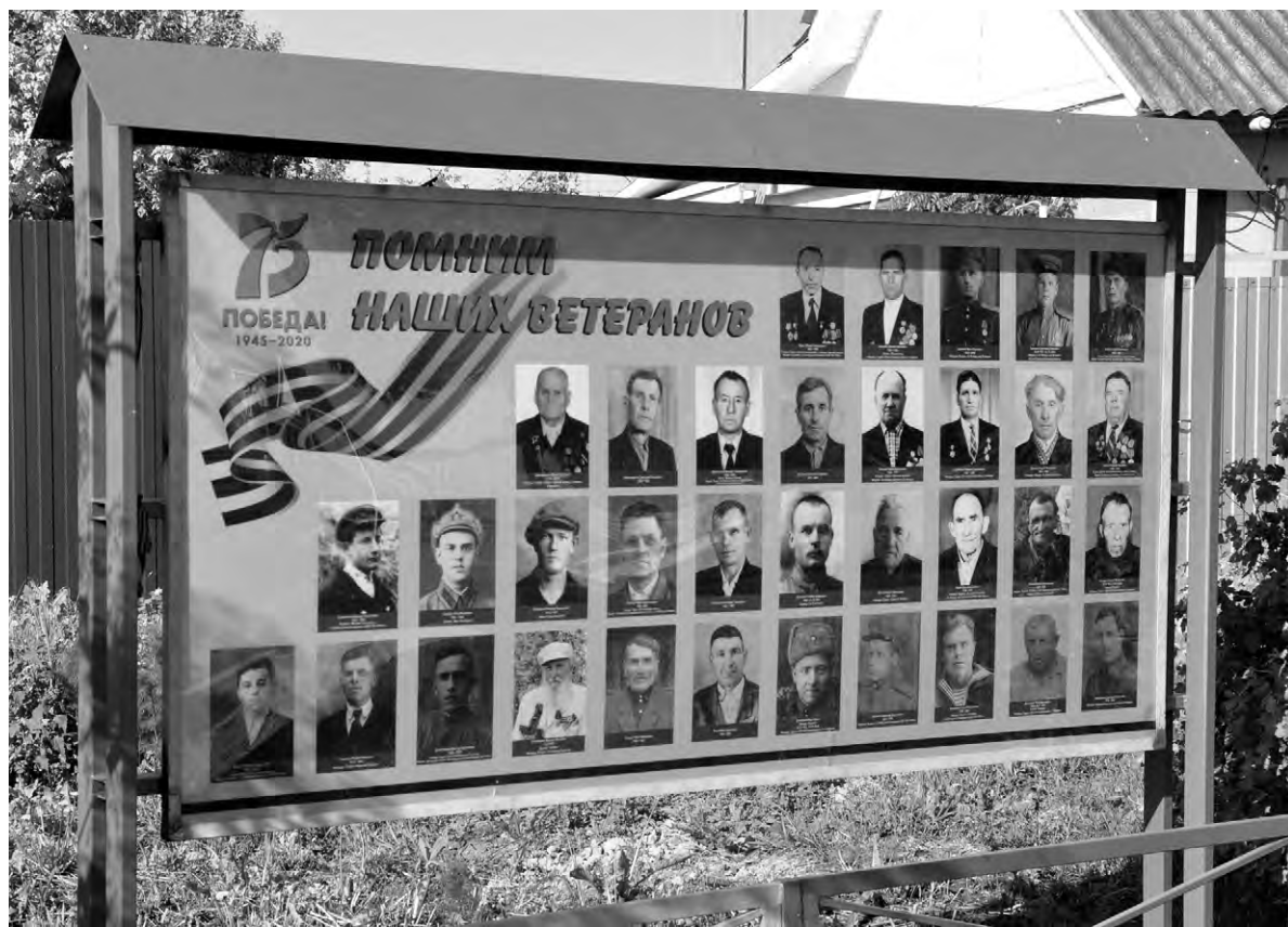
Стенд «Помним наших ветеранов» на улице Пономаренко

Это не просто гадкий поступок, это — кощунство! В то время как вся страна отмечает 75-ле-