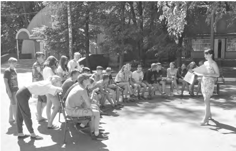
Квест для обитателей «Солнышка».

После чествования именинницы делегация гостей из райцентра отправилась ещё к