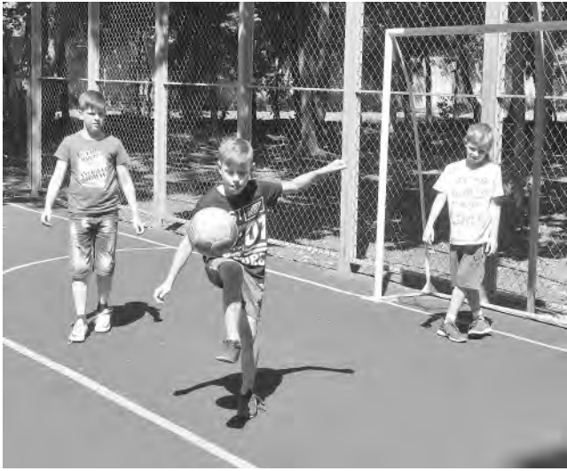
Футбол — увлекательная игра.