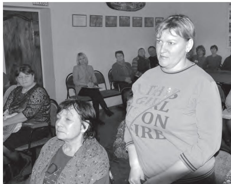
Актив села задал немало вопросов.