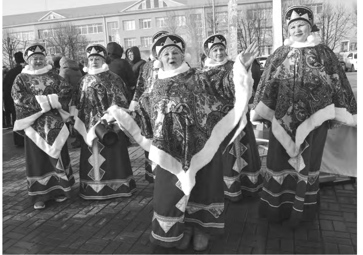
Выступления участников народного ансамбля «Раздолье» пользуются успехом у зрителей.

— У нас каждый желающий найдёт занятие по душе и сможет выбрать творческое направление, которое ему близко, и даже попробовать свои силы, став участником сразу нескольких коллективов. В учреждении действуют 29 кружков и клубов по интересам. Коллективы «Душа России» и «Раздолье» имеют звание «Народный», — продолжает