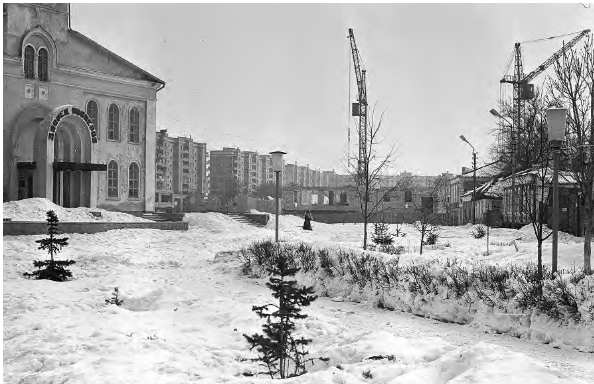
Никольская площадь (III- интернационала). Конец 1980-х.