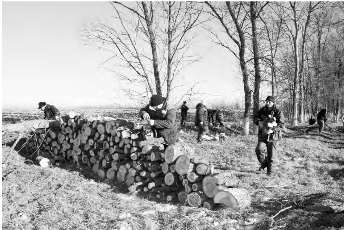
В субботнике по очистке лесополосы приняли участие 60 человек.