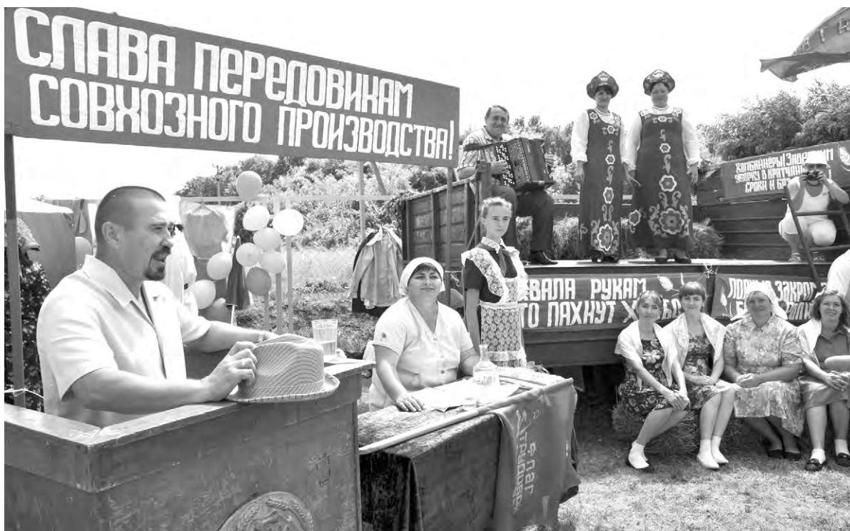
Новоуколовские культурработники всегда представляют оригинальные театрализации на районных праздниках.