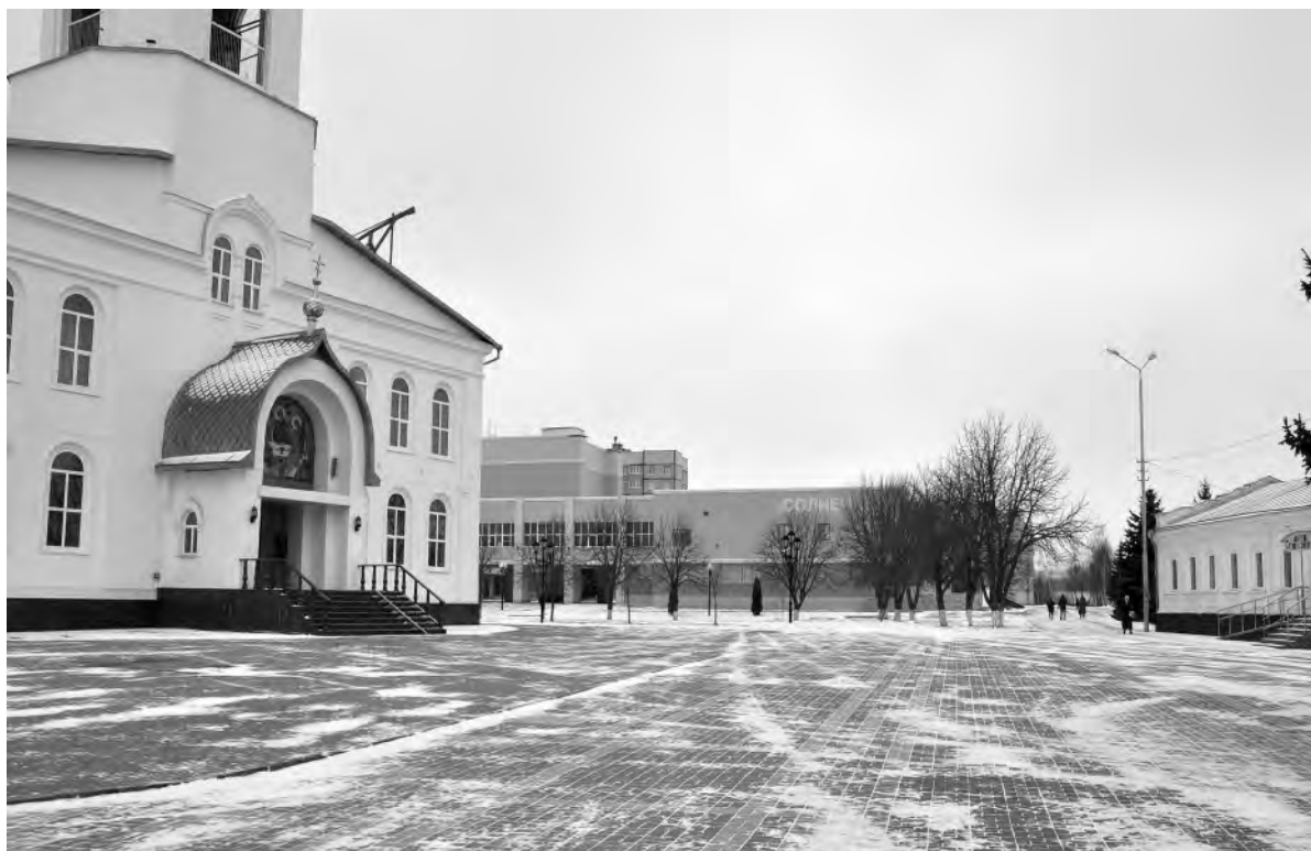
Это же место сейчас.