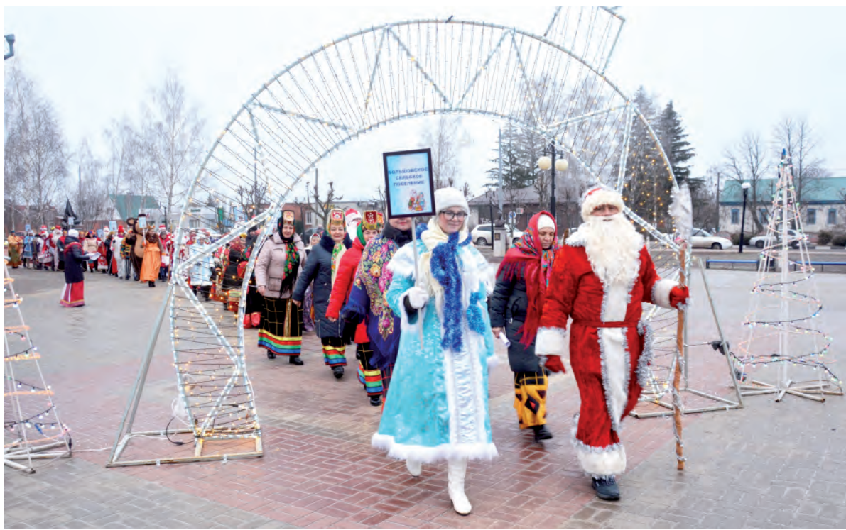
Участники сказочного парада в райцентре Красном.

Приближается Новый год, а вместе с ним наступает череда праздничных мероприятий. К примеру, в райцентре Красном состоялось торжественное открытие главной ёлки района. Несмотря на морозную погоду, всем было тепло от количества ряженных персонажей, развлечений и полученных эмоций.