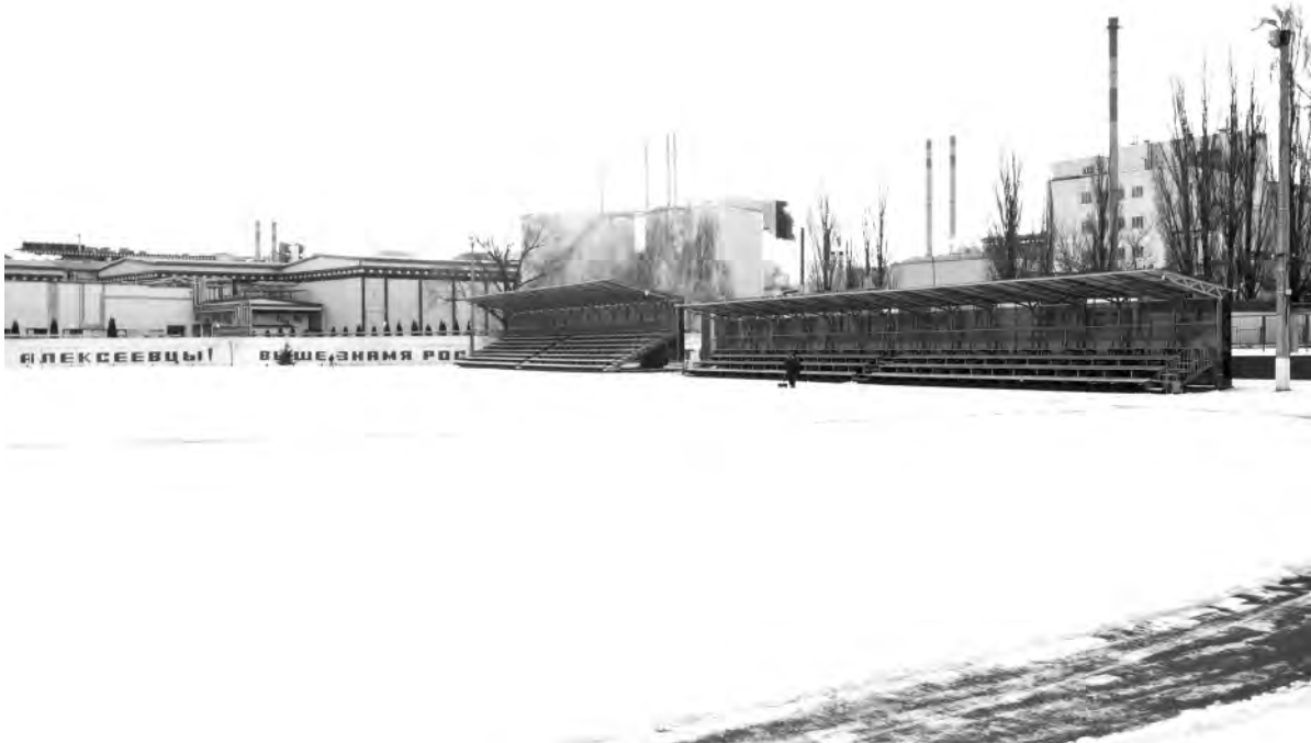
Центральный стадион Алексеевки зимой. Наше время.