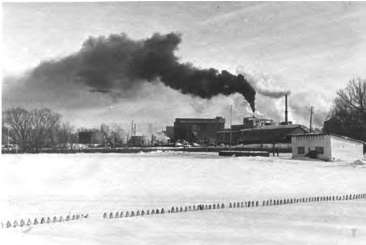
Стадион «Эфирщик» 1960-е гг.