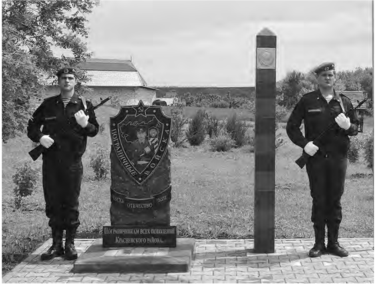
Новая памятная зона увековечит подвиг красненских пограничников всех поколений.