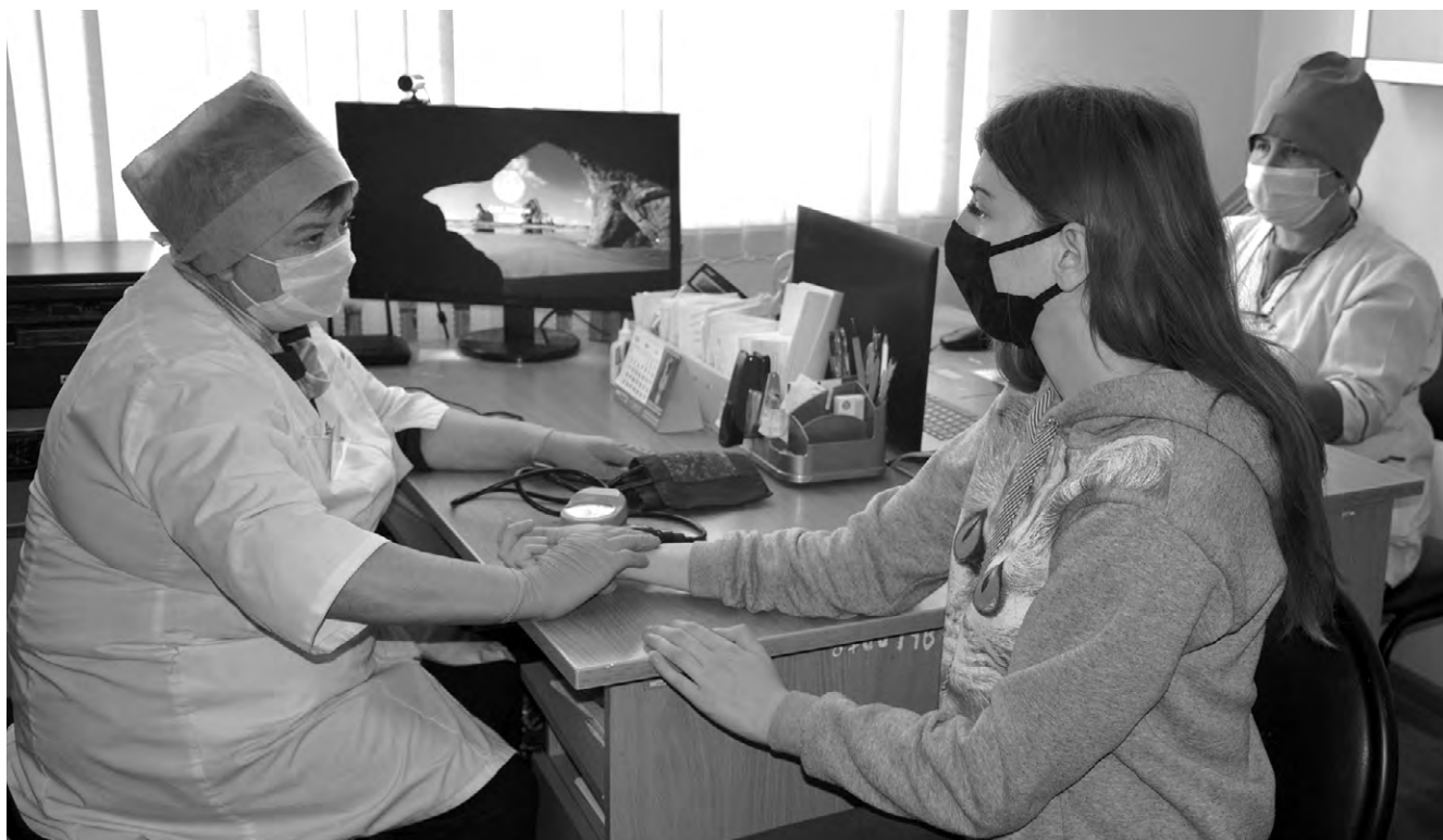
Доверительное отношение пациентов к медперсоналу — залог успешного лечения.