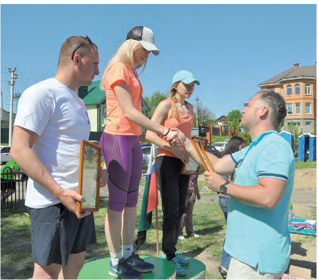
Награждение победителей и призёров кросса.