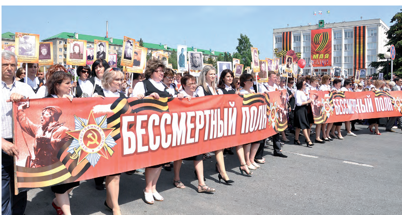
Шествие «Бессмертного полка» в Алексеевке — кульминационный момент праздника.