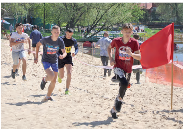
Борьба в забеге на 3000 метров.