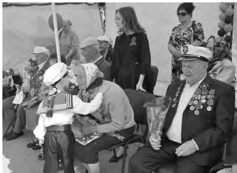
Ради таких моментов стоит жить, считают алексеевские ветераны.