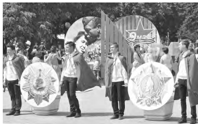
В почётном карауле — молодёжь Алексеевки.