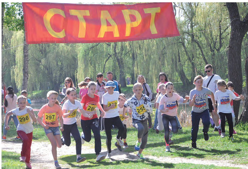
На старт турнира в этом году вышло 448 участников.