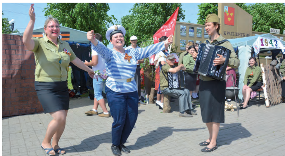
Лесноуколовские артисты исполнили танец «Яблочко».

С 10 по 20 мая проходит Всероссийская декада подписки. Стоимость полугодового комплекта межрайонной газеты «Заря» 488 руб. 46 коп. Участникам Великой Отечественной войны, инвалидам 1 и 2-й групп по предъявлению удостоверения стоимость составляет 428 руб. 10 коп. Подписаться можно в отделениях почтовой связи или у почтальонов.