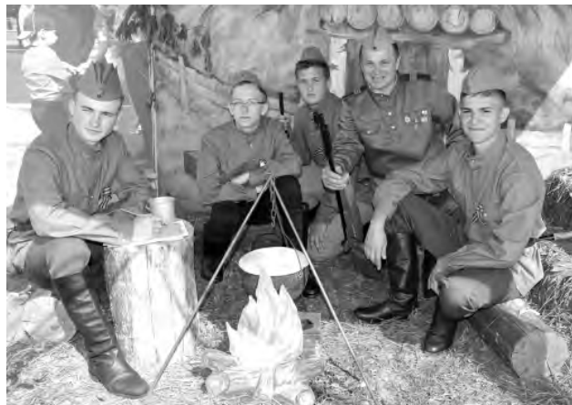
Камызинские школьники на привале.

Но самым впечатляющим, пожалуй, было шествие «Бессмертного полка», в котором, по приблизительным данным, приняли участие около восьми тысяч человек. В этот людской поток с портретами родных и близких фронтовиков, пройдя по улице Победы, разделился на три части: одна прошествовала на Никольскую площадь, к Братской могиле советских воинов, погибших в бою с фашистскими захватчиками; другая — к памятнику Неизвестному солдату, который находится в сквере по ул. Гагарина, третья — к памятнику не вернувшимся с войны рабочим и служащим эфиркомбината, установленному в сквере 300-летия Алексеевки. Во всех трёх местах состоялось возложение венков и были организованы «солдатские привалы».