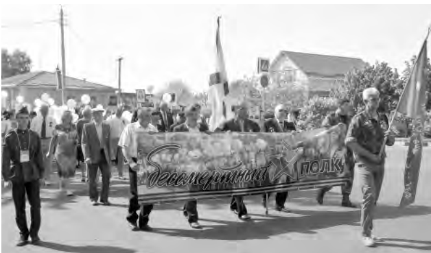
Шествие красненцев под знаменем «Бессмертного полка».

Массовые гуляния проходили по всему городу. Желающих угощали полевой кашей. Работали интерактивные площадки, мастер-классы, выставки и экспозиции. Выступали творческие коллективы. По-особому волнующе воспринимался отчётливый концерт народного хора ветеранов, который проходил на площадке у центрального входа в центре культурного развития «Солнечный». Там же выступили и другие творческие коллективы.