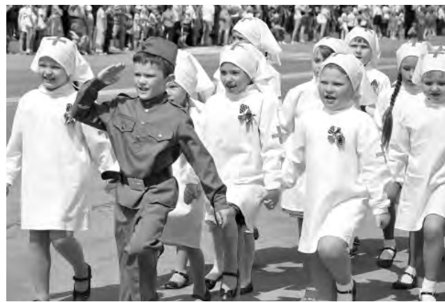
Алексеевские малыши с удовольствием маршировали по улице.