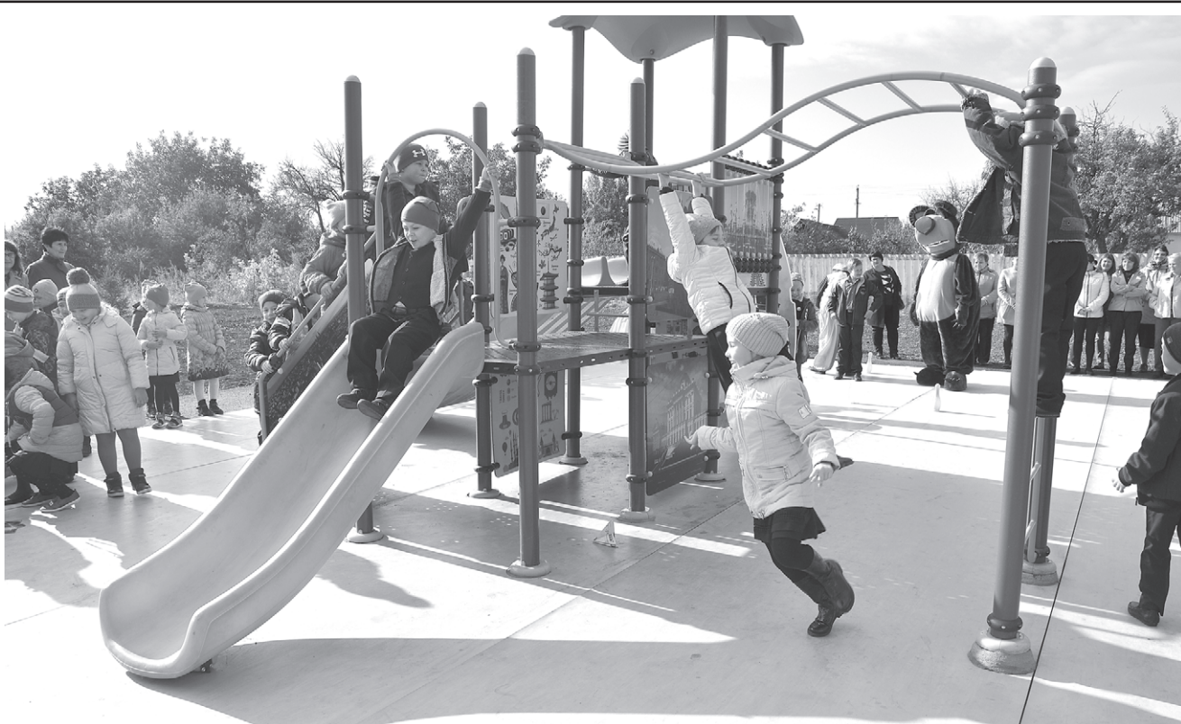
Радости детворы не было предела.

Красненская детвора облюбовала новую детскую площадку в райцентре. Игровая зона разместила неподалёку от многофункционального центра по оказанию услуг населению.