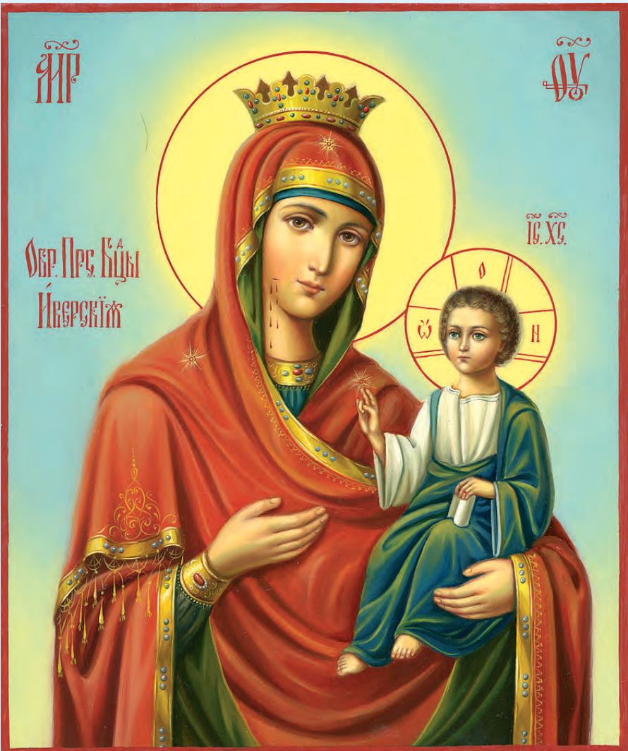
Икона Иверской Пресвятой Богородицы

8 АПРЕЛЯ — СВЕТЛОЕ ХРИСТОВО ВОСКРЕСЕНИЕ (ПАСХА) ДВУНАДЕСЯТЫЕ ПЕРЕХОДЯЩИЕ ПРАЗДНИКИ 1 апреля — Вход Господень в Иерусалим (Вербное воскресенье) 17 мая — Вознесение Господне 27 мая — День Святой Троицы. Пятидесятница. ДВУНАДЕСЯТЫЕ НЕПЕРЕХОДЯЩИЕ ПРАЗДНИКИ 7 января — Рождество Христово 19 января — Святое Богоявление. Крещение Господа Бога и Спаса нашего Иисуса Христа 15 февраля — Сретение Господне 7 апреля — Благовещение Пресвятой Богородицы 19 августа — Преображение Господне 28 августа — Успение Пресвятой Богородицы 21 сентября — Рождество Пресвятой Богородицы 27 сентября — Воздвижение Креста Господня 4 декабря — Введение во храм Пресвятой Богородицы ВЕЛИКИЕ ПРАЗДНИКИ 14 января — Обрезание Господне и память святителя Василия Великого 7 июля — Рождество Иоанна Предтечи 12 июля — Святых первоверховных апостолов Петра и Павла 11 сентября — Усекновение главы Иоанна Предтечи 14 октября — Покров Пресвятой Богородицы