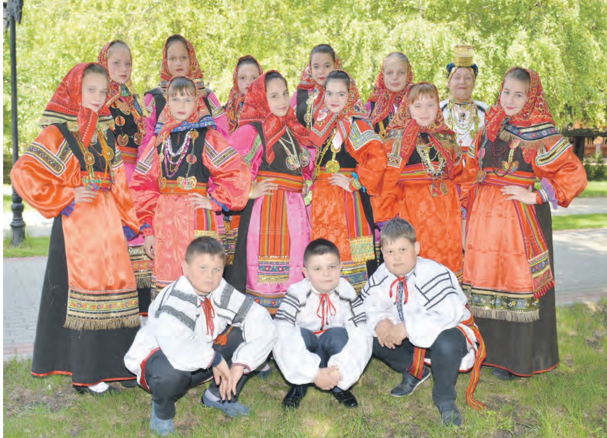
Звонкие и самобытные голоса у юных участников фольклорного ансамбля «Калинка».

Его создательницей, а вернее даже сказать, родительницей, была Заслуженный работник культуры РФ, обладатель на-