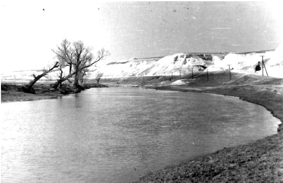
Тихая Сосна в районе Дмитриевского моста. 1960-е годы.