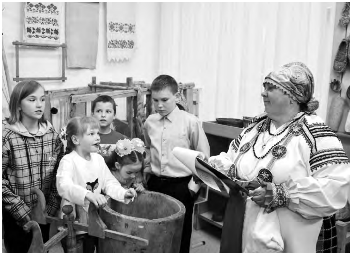
Музейные мероприятия всегда проходят интересно и многолюдно.