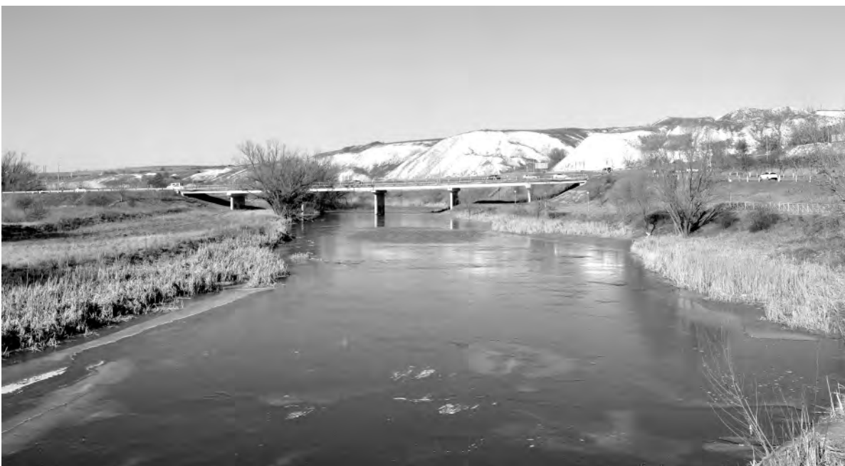
Это же место сейчас.