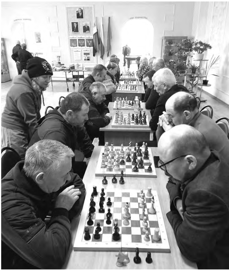
Турнир собрал представителей двух районов.