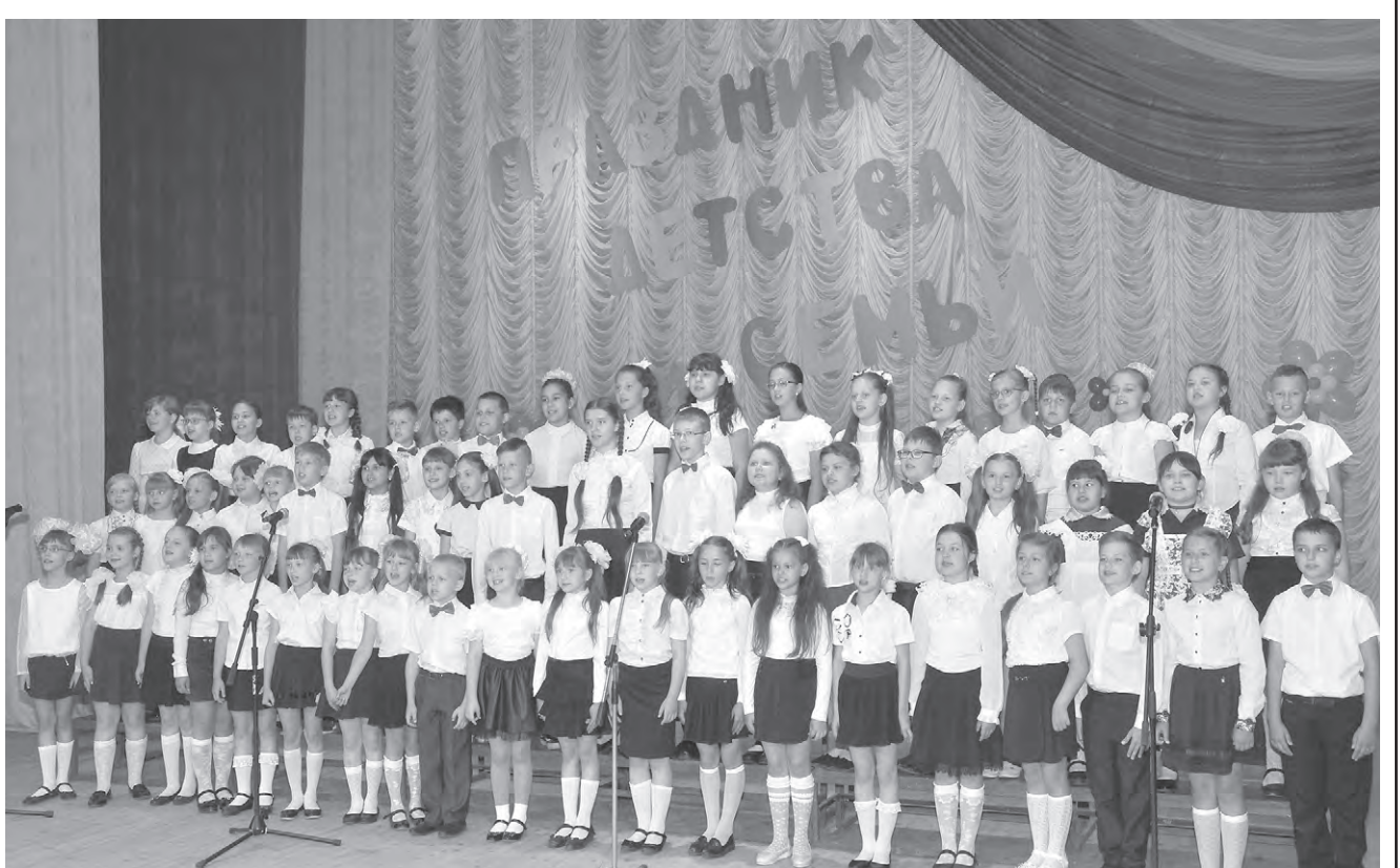
На сцене «Солнечного» детский хор исполняет «Гимн детей России».

ВТОРНИК, 5 июня: температура: днём +27°, ночью +17°; давление (мм рт. ст.) 741; ветер (м/с) 7, юго-западный, малооблачно, небольшой дождь.