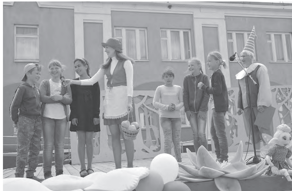
Театрализованное представление в Красном.