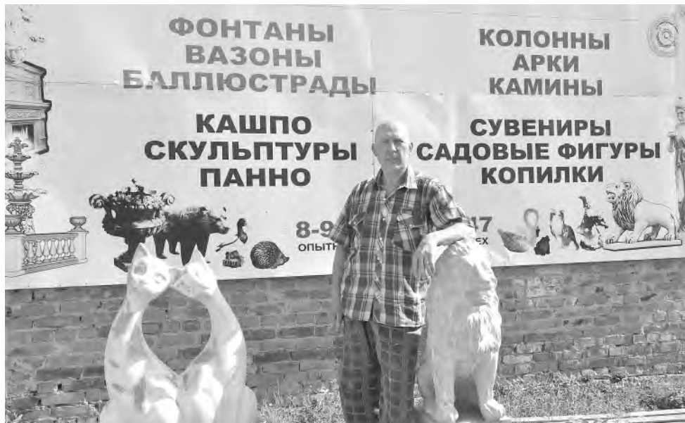
У творческого человека должна быть площадка для реализации идей.