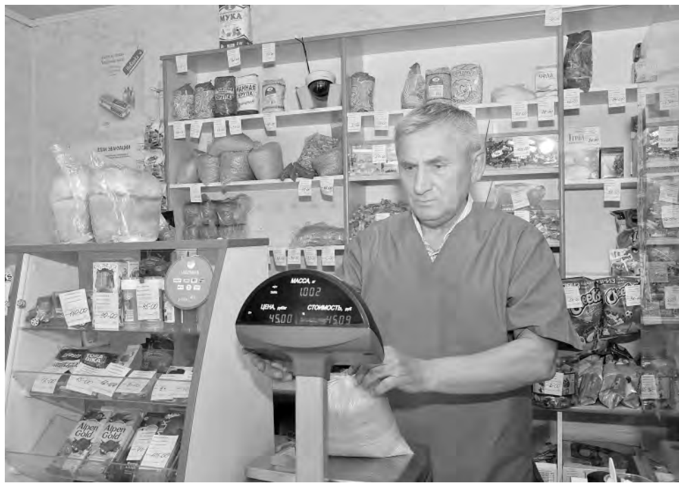
В магазине «Катюша» жители микрорайона могут купить всё необходимое.

Конечно, для этого им пришлось немало потрудиться. Сделали капитальный ремонт здания, провели газ, оборудовали автономное отопление, частично заменили окна,