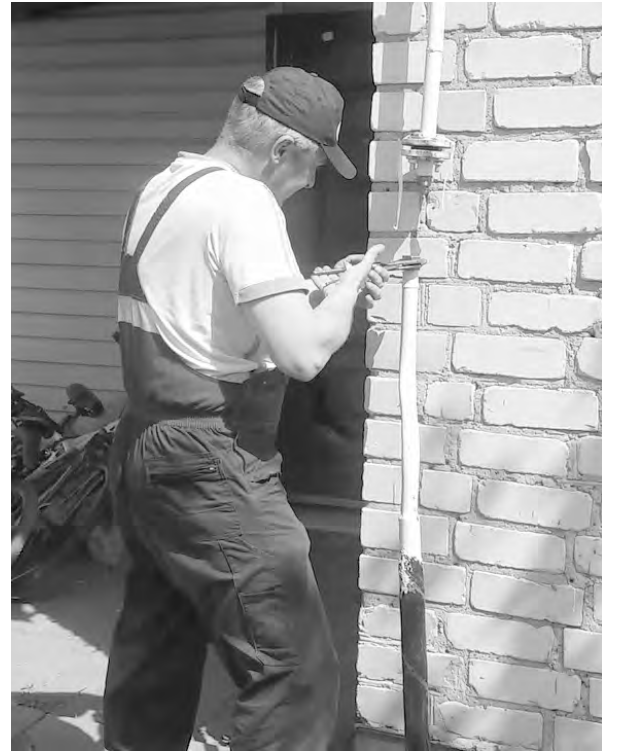
Ограничение поставки газа жителю Алексеевки.

бой оплатить долги за газ до 10.06.2018 и заключить договоры на техническое обслуживание газового оборудования.