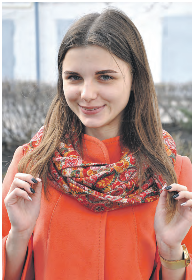
В планах Алины Петренко — стать врачом.

Никита КОТОЛЕВСКИЙ.