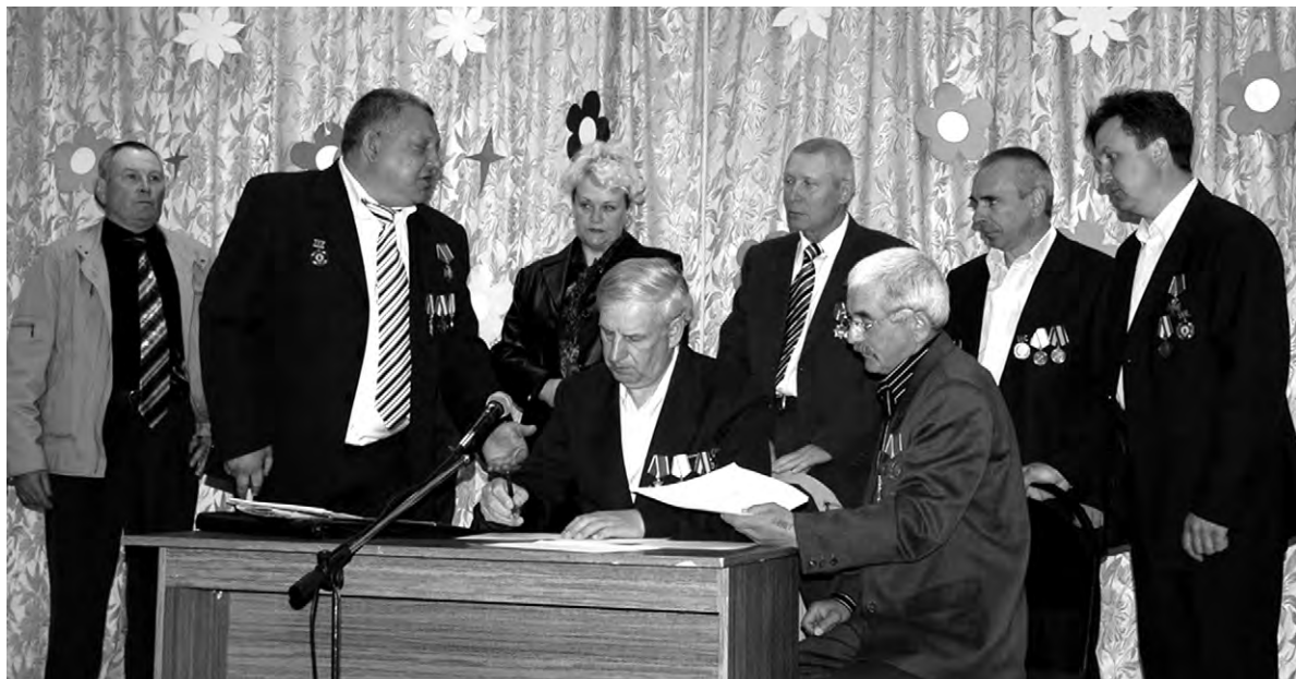
Алексеевские ликвидаторы обсуждают насущные задачи.

На «чернобыльском фронте» сражались более 120 Алексеевцев. Они в зоне повышенной радиации, рискуя здоровьем, занимались дезактивацией третьего и четвёртого энергоблоков, других сооружений. Некоторые из них в защитных костюмах