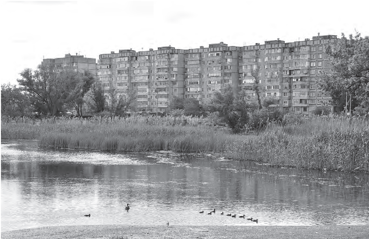
А город нежится и спит под одеялом тёплым лета.