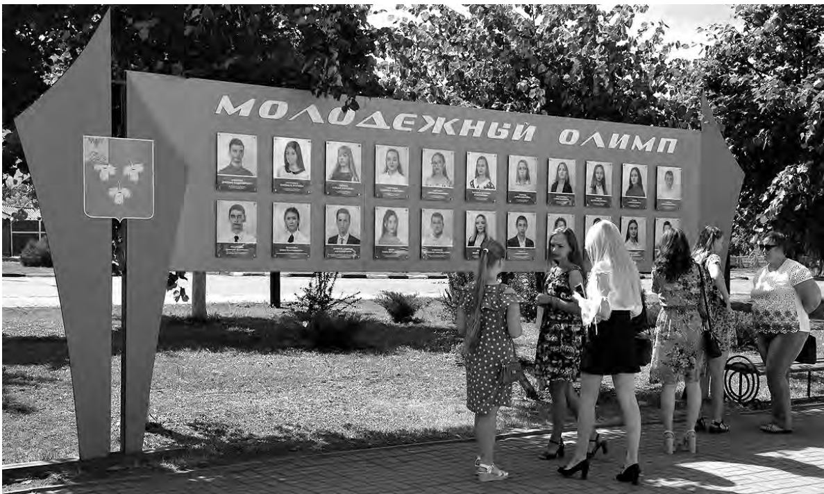
«Молодёжный олимп» пополнился новыми именами.