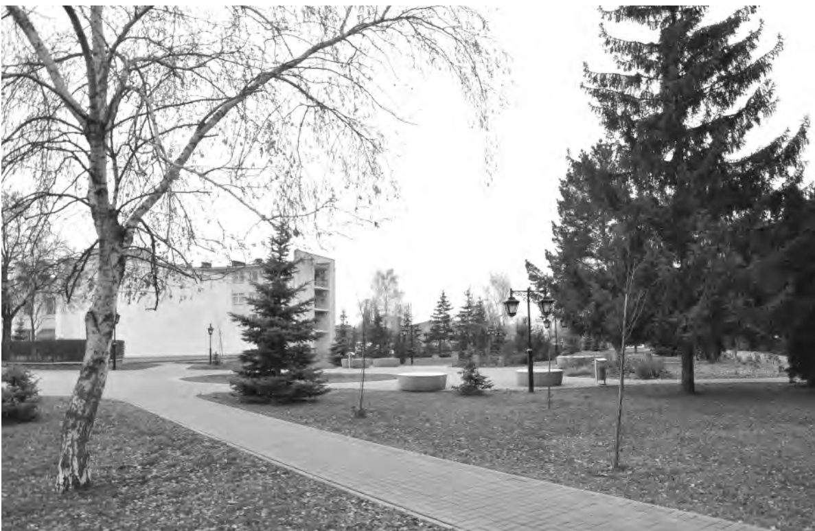
Это же место. Наши дни.