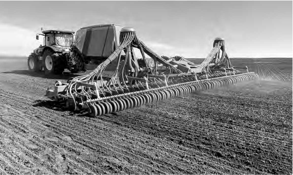
Внесение органических удобрений.

Щербаковское начали посевную сахарной свёклы, а в «Советском» — подсолнечника. Всего в муниципалитете предстоит засеять почти 46 тыс. га зерновыми и зернобобовыми культурами и около 31 тыс. га — техническими. Пресс-служба Алексеевского горокруга.