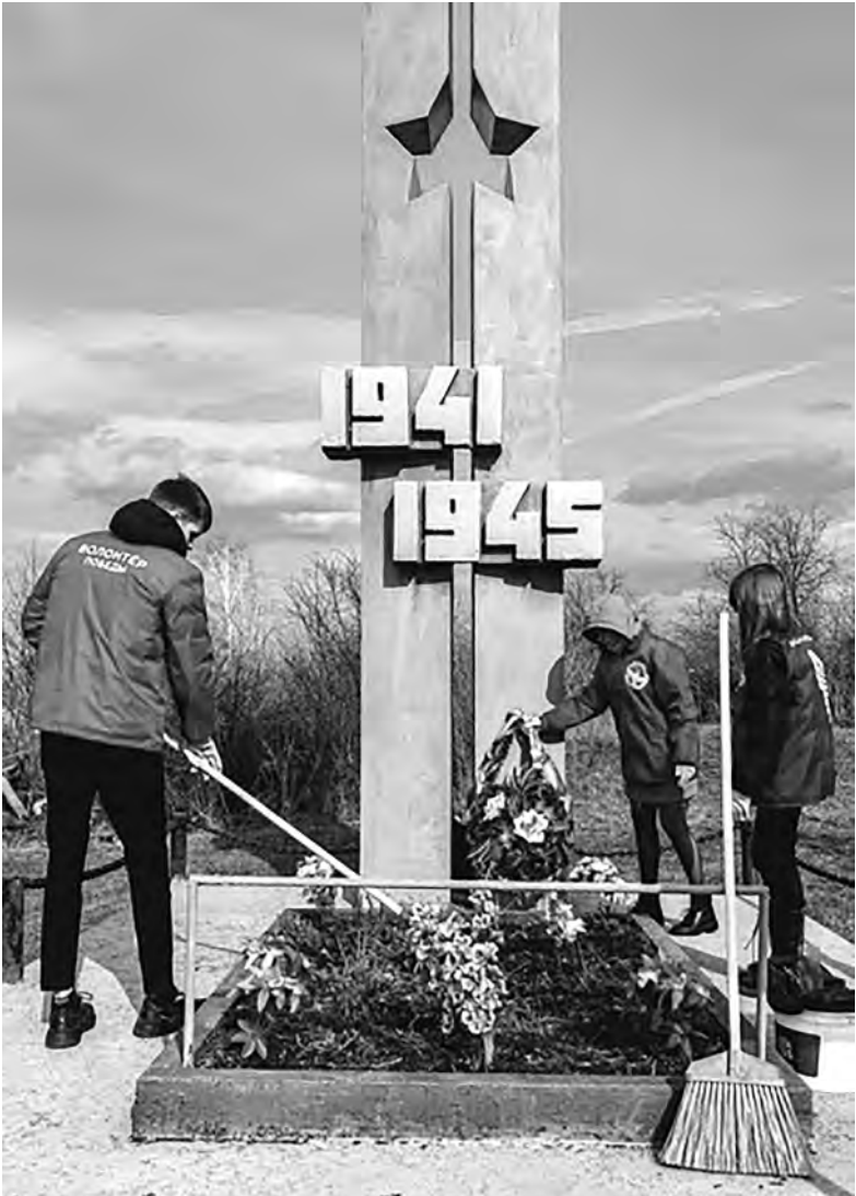
Волонтеры Победы следят за порядком на территории памятников.

родского округа с 16 по 24 апреля пройдёт тематическая акция с участием волонтёров культуры. Главной её целью станет поддержка добровольческих движений, популяризация бережного отношения к историческому и культурному наследию путём проведения массовых субботников на объектах культурного наследия с предварительной экскурсией или лекцией. Много интересного участники акции узнают об исторических местах, расположенных на территории Алексеевского горокруга. По завершении мероприятия будут сделаны памятные фото. Приглашаем всех желающих принять участие в акции и поделиться в социальных сетях историей объекта культурного наследия с упоминанием официальных хэштегов мероприятия: #сохранимнаследиевместе, #волонтёрыкультуры, #деньзаботыопамятниках2022. И это только начало! Ведь нам нужна сильная страна, сплочённый народ, образованная и любящая Родину молодёжь. Татьяна ДЕВИЦЫНА, Лариса ВОЙЛЕНКО, ведущий методист Централизованной клубной системы Алексеевского горокруга.