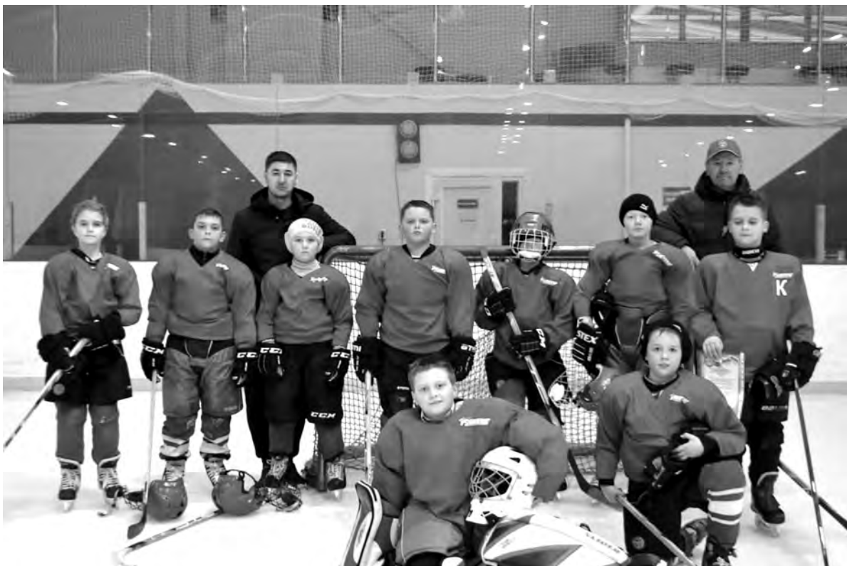
Красненские хоккеисты после турнира.