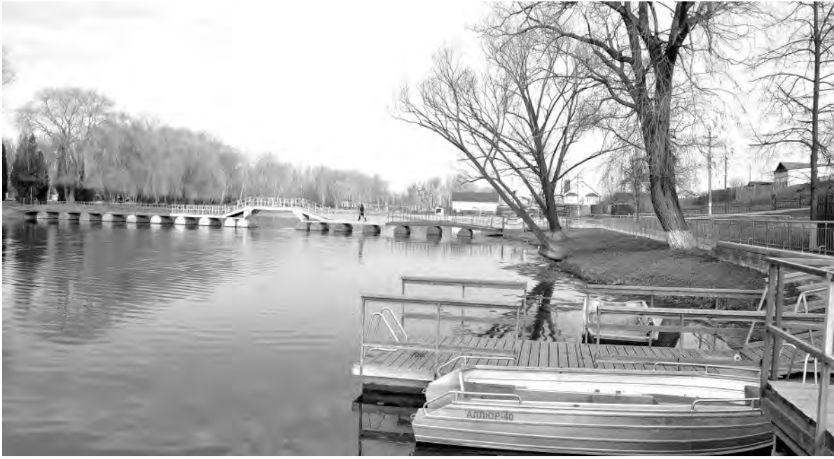
Серый апрельский фон скоро окрасится в зелёные цвета.