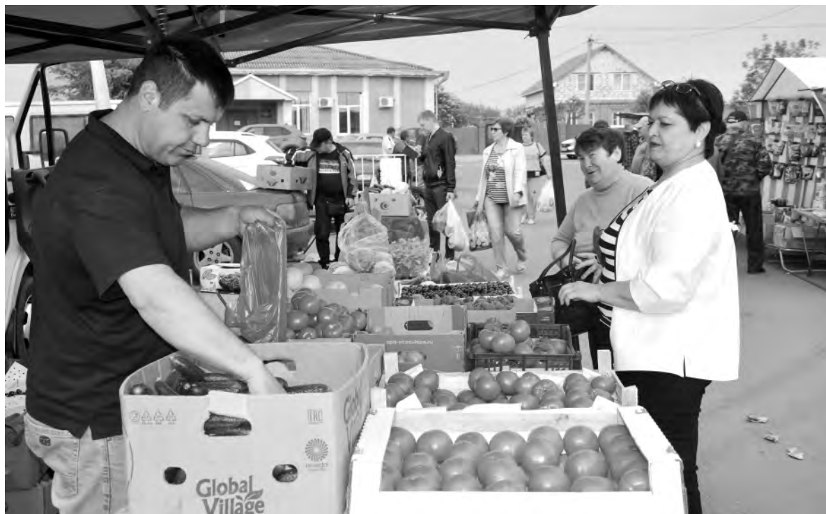
В ярмарочные дни торговые ряды красненского рынка наполнены разнообразной сельхозпродукцией.