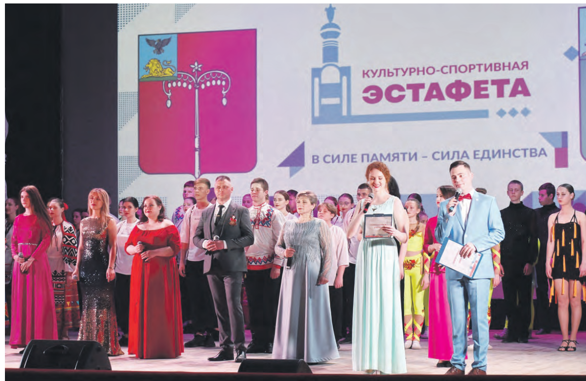
Представительная алексеевская делегация впечатлила зрителей соседнего района.