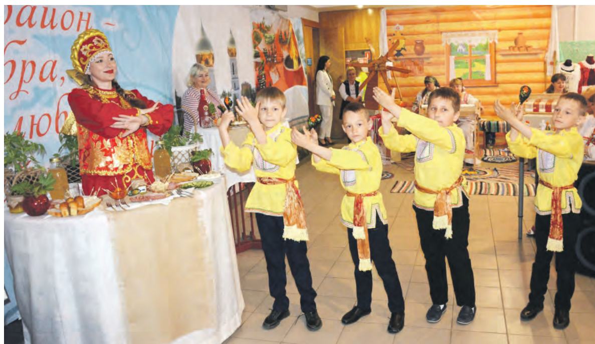
В фойе Центра культурного развития «Радужный» чернянцы показали калейдоскоп самобытных талантов.

Насыщенная концертная программа состояла из песен военных лет, патриотических композиций, светодиодного