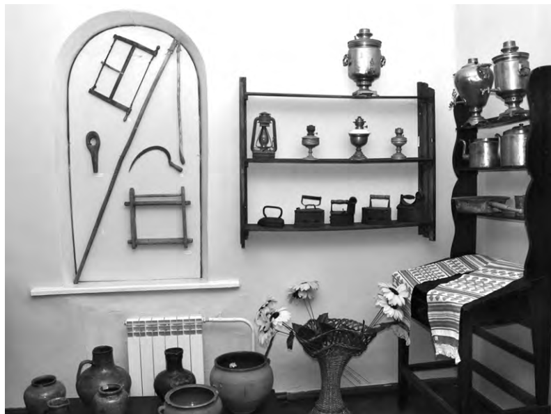
Инструменты и домашняя посуда алексеевцев.