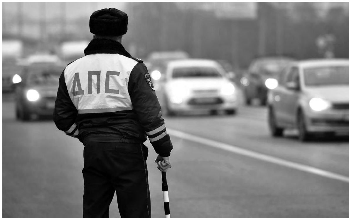
Автомобилистов в наступившем году ждёт очень много новшеств.

В целом, такое нововведение будет иметь смысл только за городом. А внутри населённых пунктов администрация получит законное право демонтировать все старые указа-