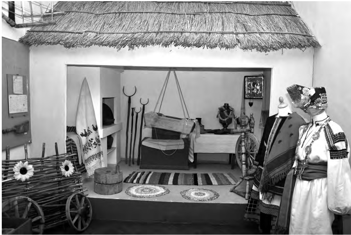
Внутренний вид крестьянской избы.

Не будет большой фантазией, если скажем, что профессор в первую очередь порадовался за алексеевцев, в среде которых испытал подневольные тяготы. А теперь с душевной отрадой осознавал переход их из зависимых от воли графа Дмитрия Шереметева в свободных сельских обывателей.