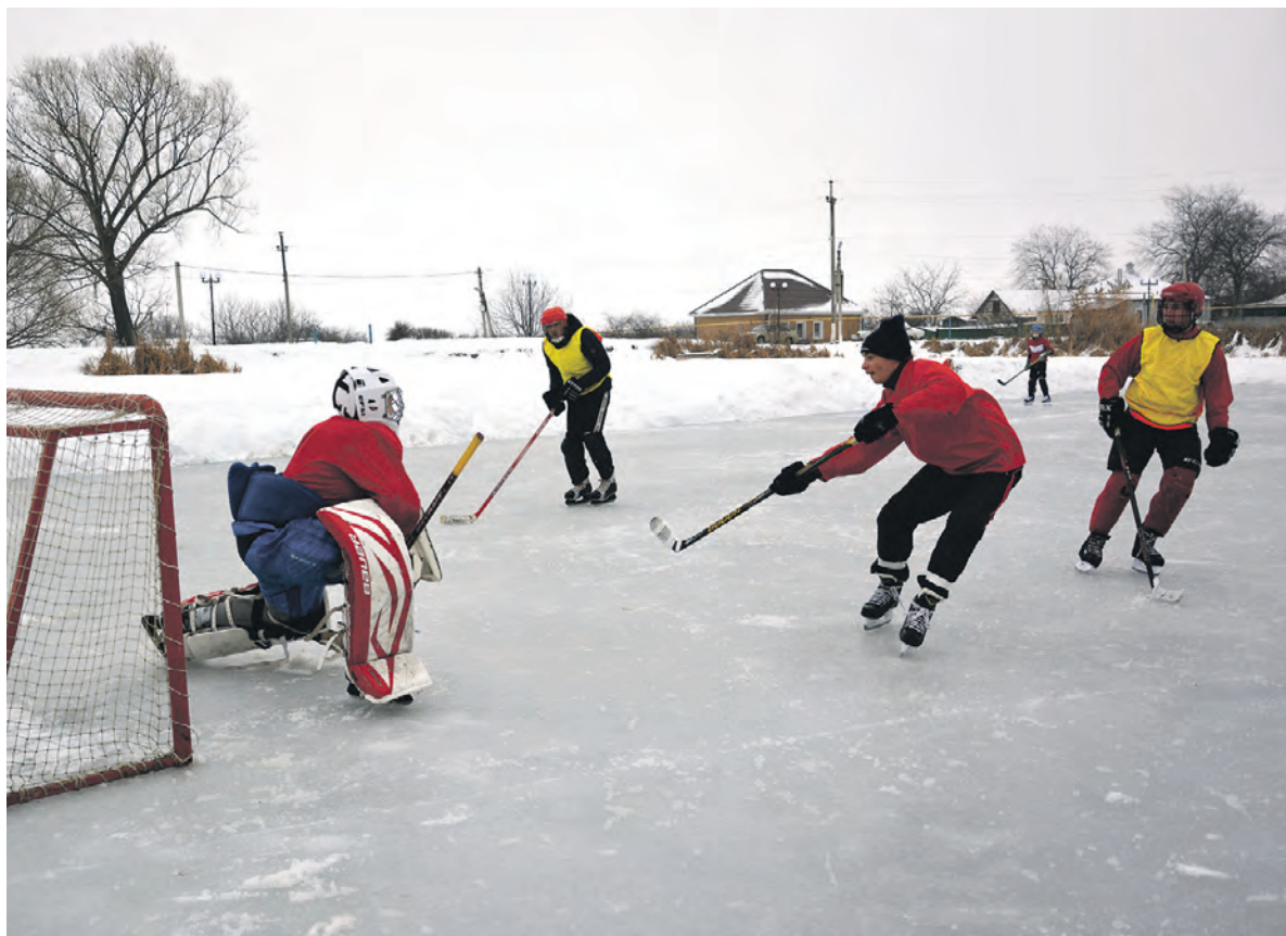
Вратарю «Прометея» было тяжело сдержать атаку «Оптимиста».

Заря Учредители: департамент внутренней и кадровой политики Белгородской области; администрация Алексеевского городского округа, администрация Красненского района Белгородской области, Совет депутатов Алексеевского городского округа Белгородской области, муниципальной совет муниципального района «Красненский район», АНО «Редакция газеты «Заря».