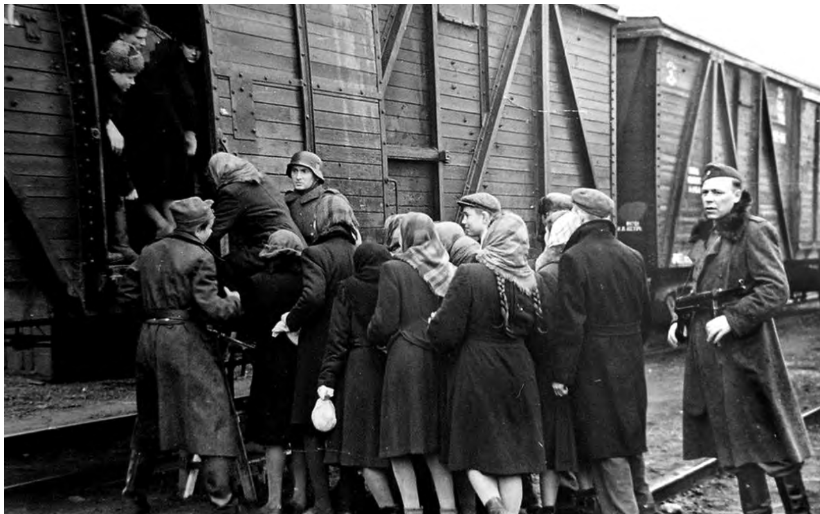
Так под дулами автоматов угоняли молодёжь в Германию.

Отобранных парней и девчат эшелонами отправляли в Германию. Затапливали в вагоны по 50-60 человек. При этом не всегда отделяя юношей и девушек, отчего им по дороге приходилось испытывать череду унижений. Естественные потребности они справляли, выламывая дырки в разных углах вагонов.