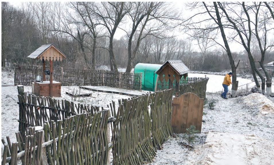
Живописный уголок: освященный источник в с. Иващенко.