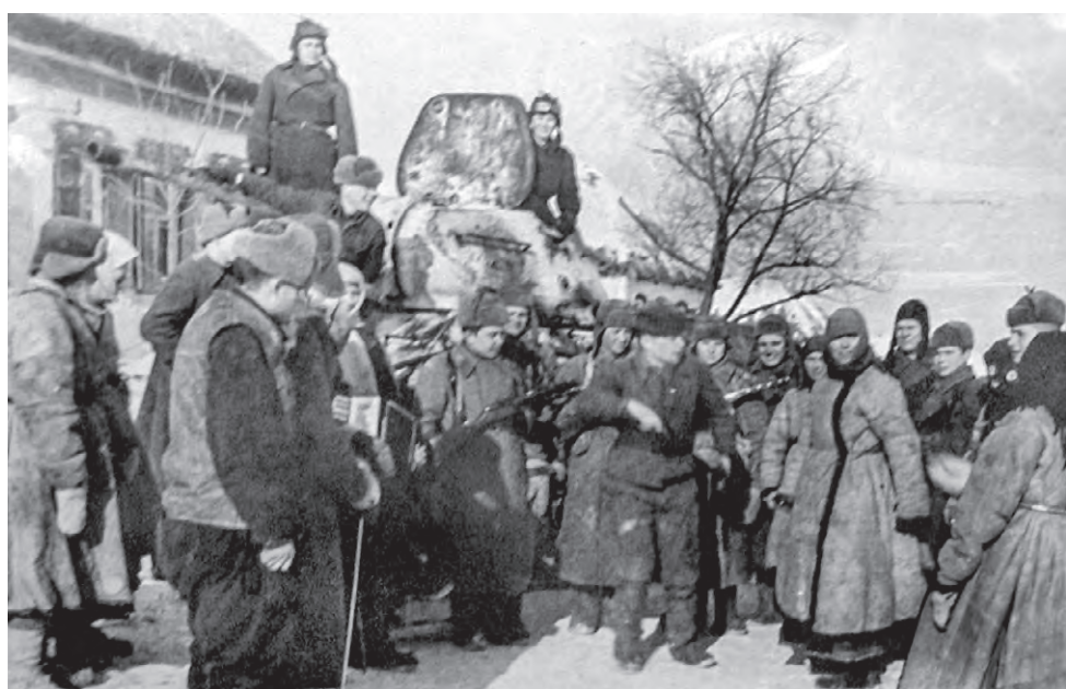
Жители Иловки встречают освободителей — танкистов Красной Армии в январе 1943 года.

В эти дни исполняется 75 лет освобождения Алексеевского и Красненского районов от фашистской оккупации в январе 1943 года. Произошло это в результате Острогожско-Россошанской наступательной операции Красной Армии, в которой принимали участие подразделения 305-й стрелковой дивизии, 18-го стрелкового корпуса и 3-й танковой армии. Что пережили местные жители, прежде чем пришло избавление от чужеземного ига?