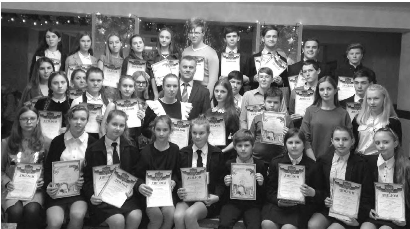
Ребята из второй школы в очередной раз успешно выдержали предметный марафон.

Данные предоставлены управлением и отделом культуры администраций районов.