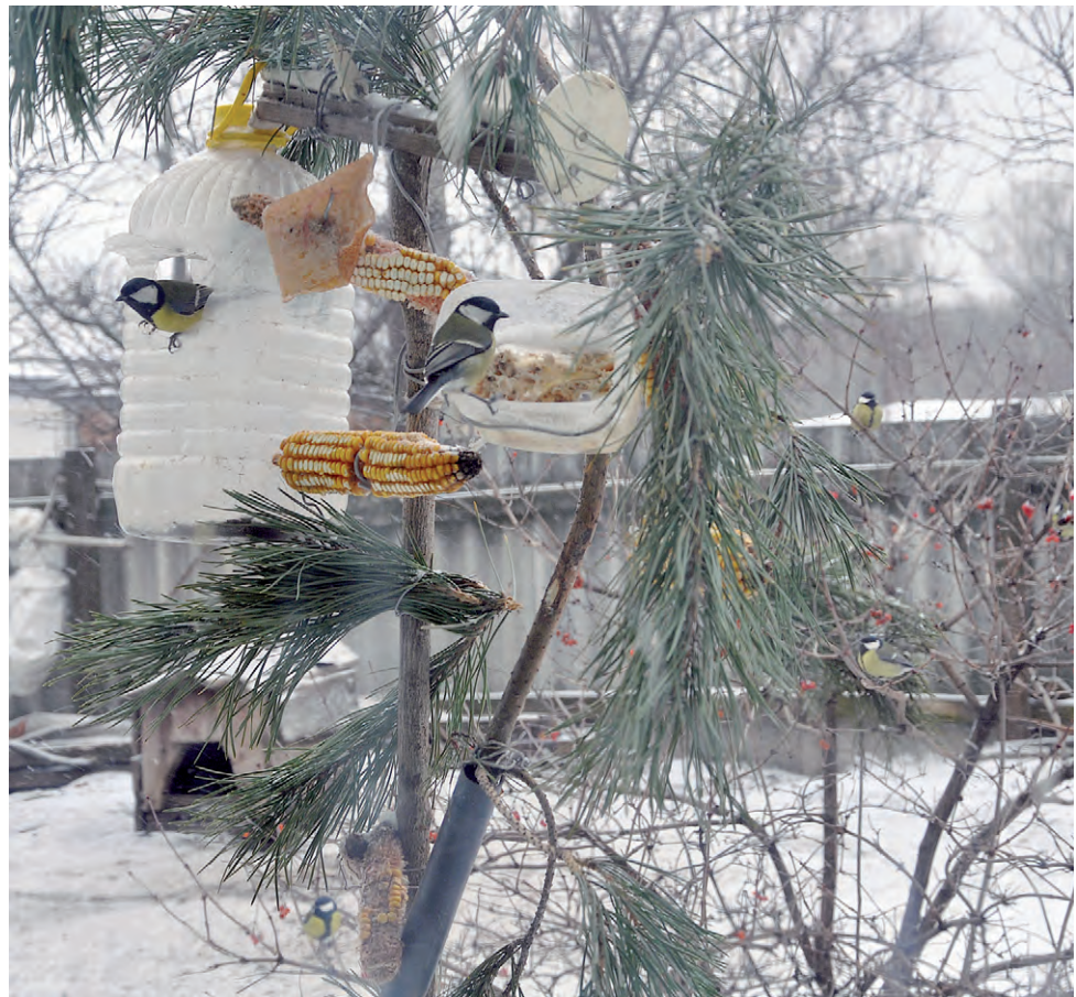
Пять синичек облюбовали птичью столовую.