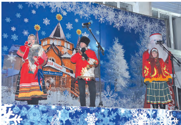
Соб. инф.

Закрытие резиденции Деда Мороза стало завершающим мероприятием в череде новогодних праздников. На центральной площади города собрались сотни взрослых и детей. Любимые всеми главные персонажи Дед Мороз и Снегурочка, ряженные, выступление творческого коллектива центра культурного развития, хороводы, игры — всё это позволило ещё раз окунуться в добрую сказку, которая несколько недель «жила» в Алексеевке и вернётся сюда только через год.