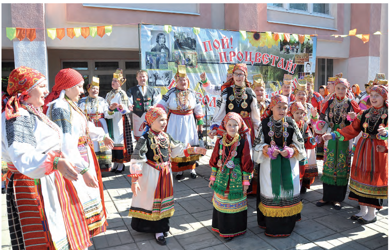
Фольклорные традиции передаются в Афанасьевке от поколения к поколению.