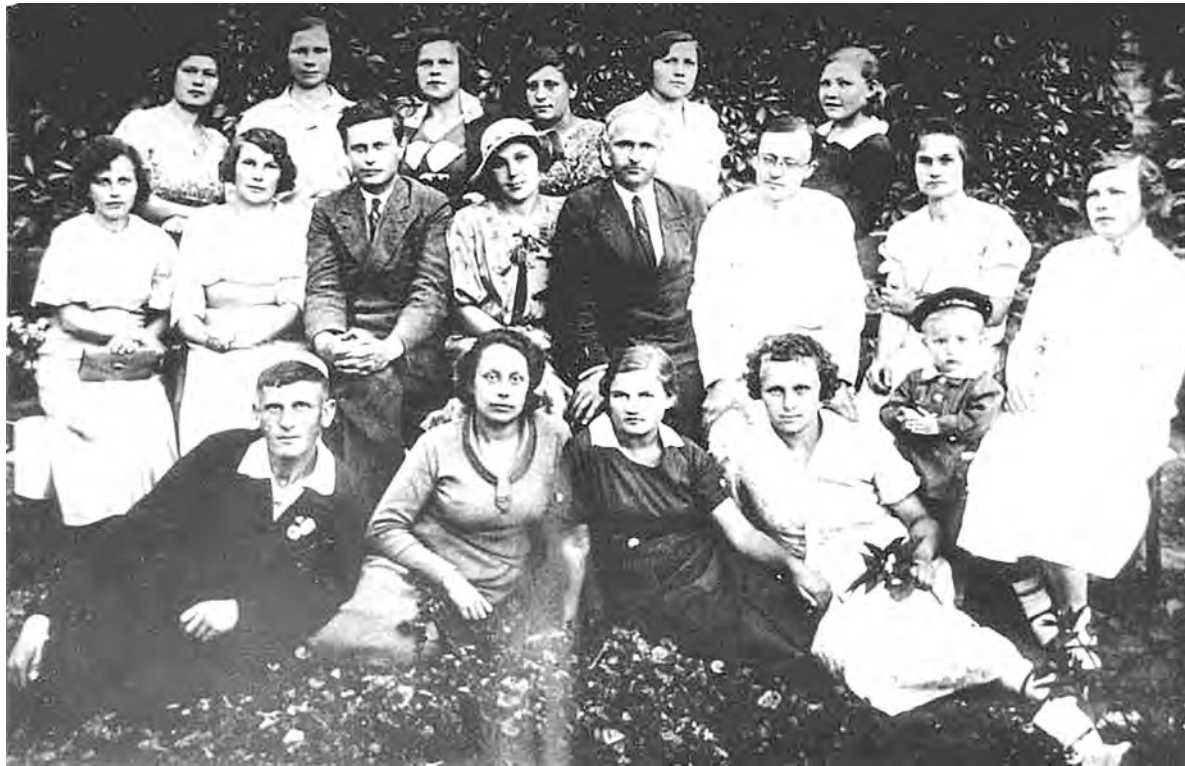
Группа работников эфирокombината, вместе со всем коллективом решившая до конца войны перечислять в фонд обороны однодневный заработок.

В середине осени 1941 года, когда гитлеровские войска напористо продвигались на восток, а в Белгороде уже хозяйничали, в Алексеевке без излишней спешки эвакуировали первые два вагона станков и аппаратов эфирокombината за Урал. Затем вывезли всю основную технику. Как только фронт в октябре того года под Белгородом стал устойчивым и, казалось, врага погонят вспять, оборудование весной 1942 года вернули на свои места, и производство вновь заработало.