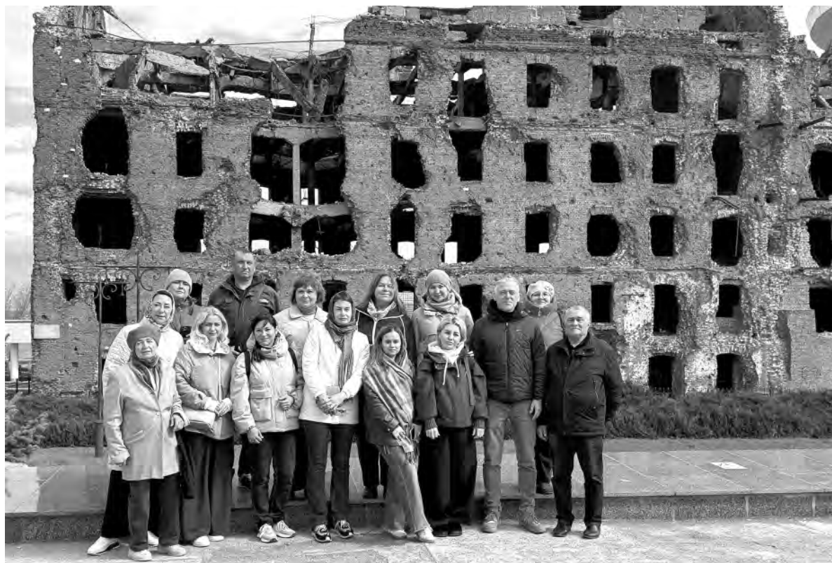
Редакторы газет Белгородчины у мельницы Гергардта.

Битва происходила с 17 июля 1942 года по 2 февраля 1943 года. Она началась с крупнейшей бомбардировки города авиацией и наступления немецко-фашистских войск, а закончилась безоговорочной победой Красной армии, окружением группировки войск вермахта и пленением фельдмаршала Паулюса. День окончания Сталинградской битвы включён в список дней