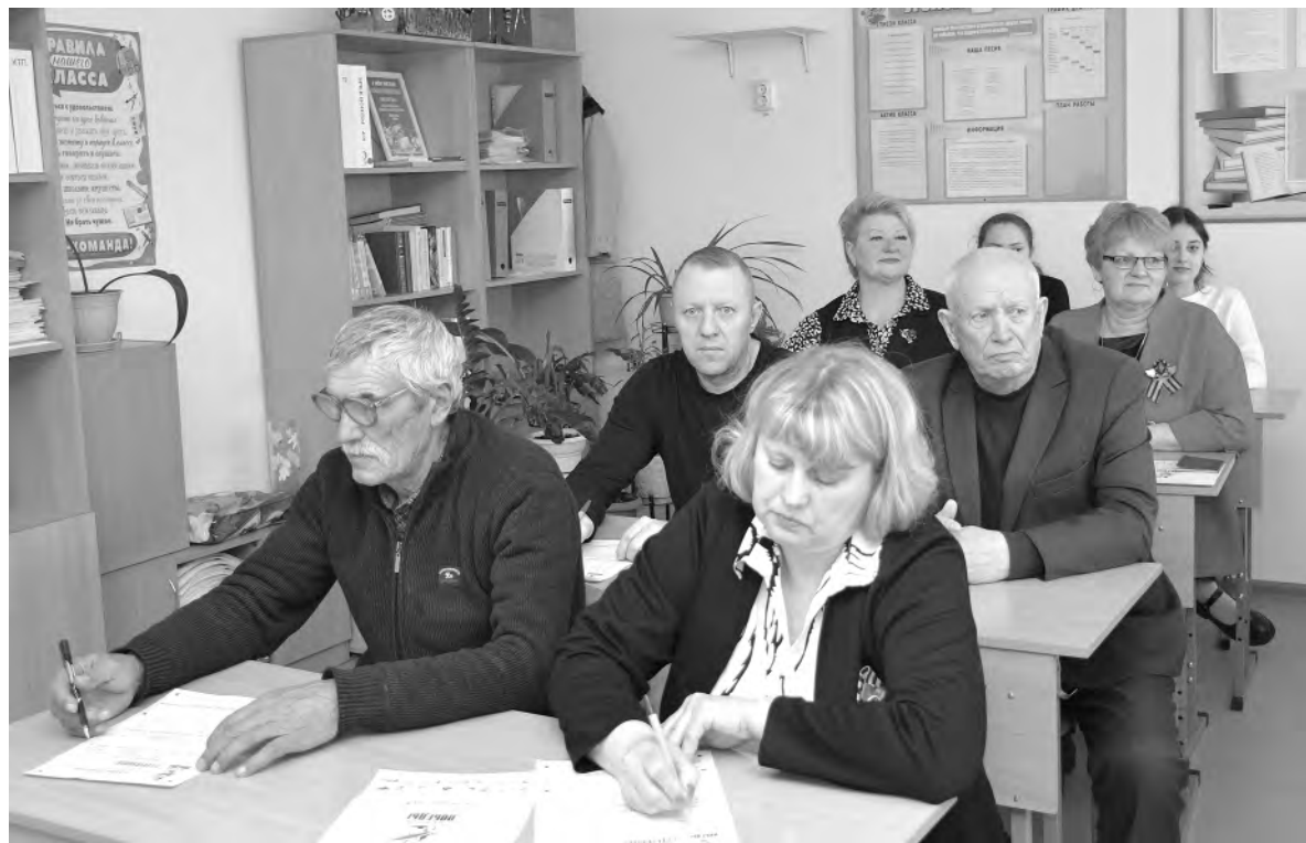
В Красненском муниципалитете акция прошла на 10 площадках.