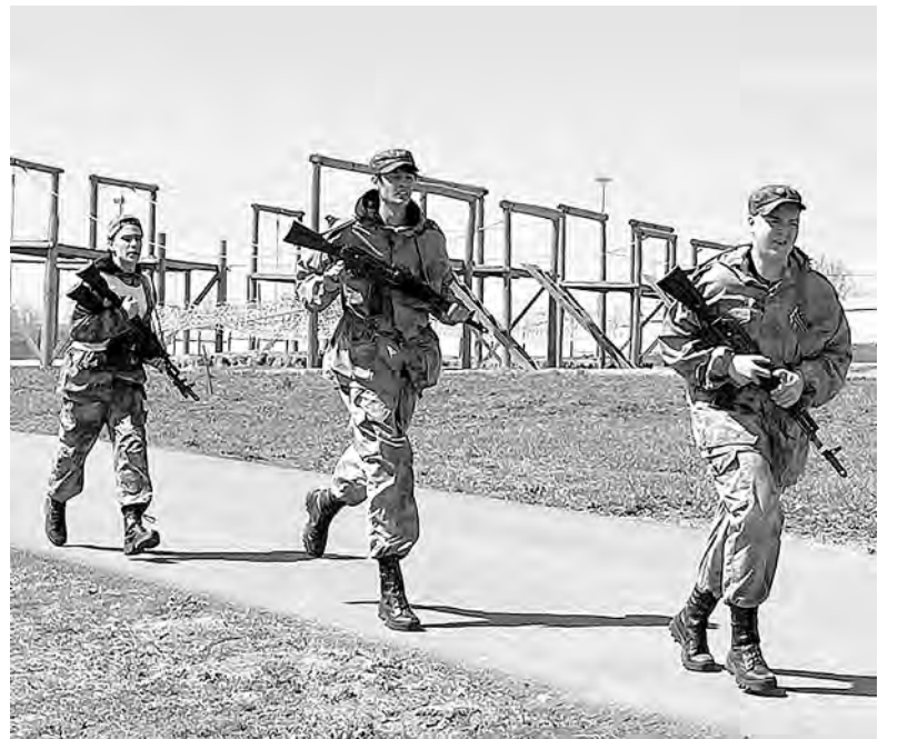
Наиболее трудный этап — марш-бросок с вооружением.

Текст и фото военно-патриотического объединения «Поколение».