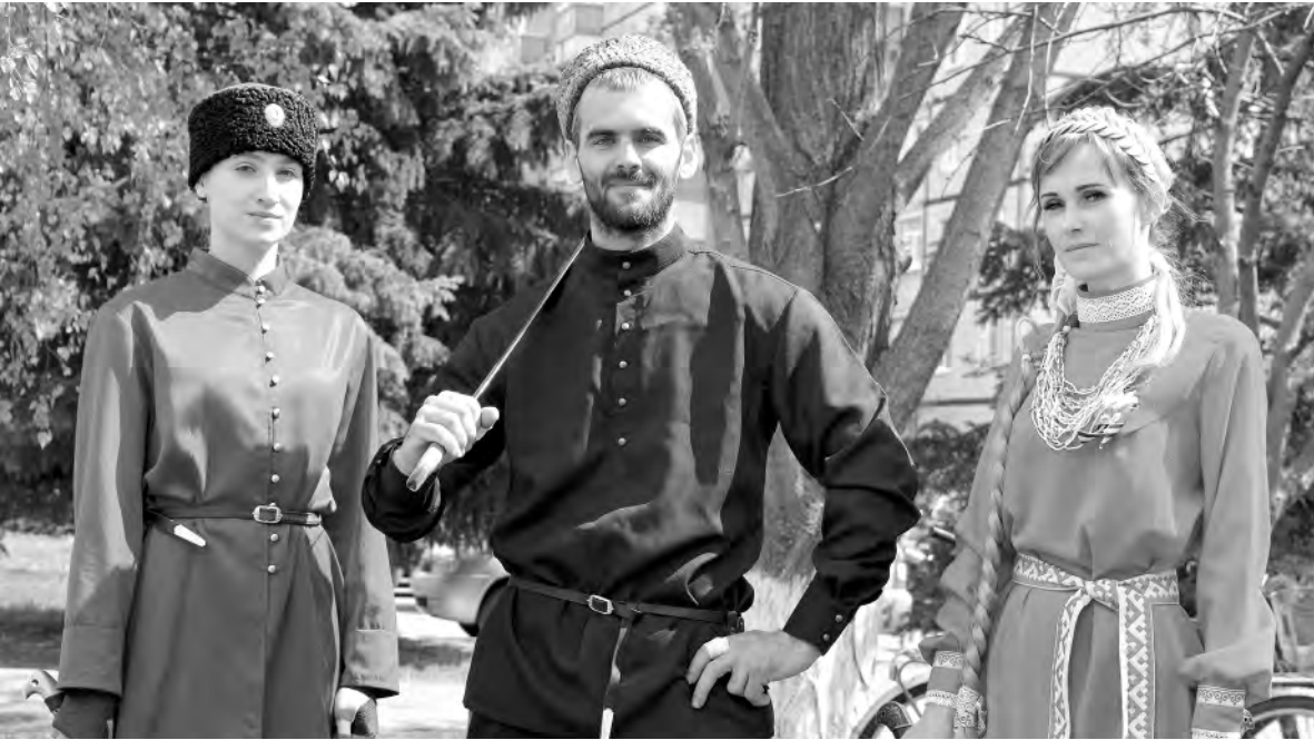
Представители Белгородского муниципалитета с удовольствием приняли участие в празднике казачьей культуры на алексеевской земле.