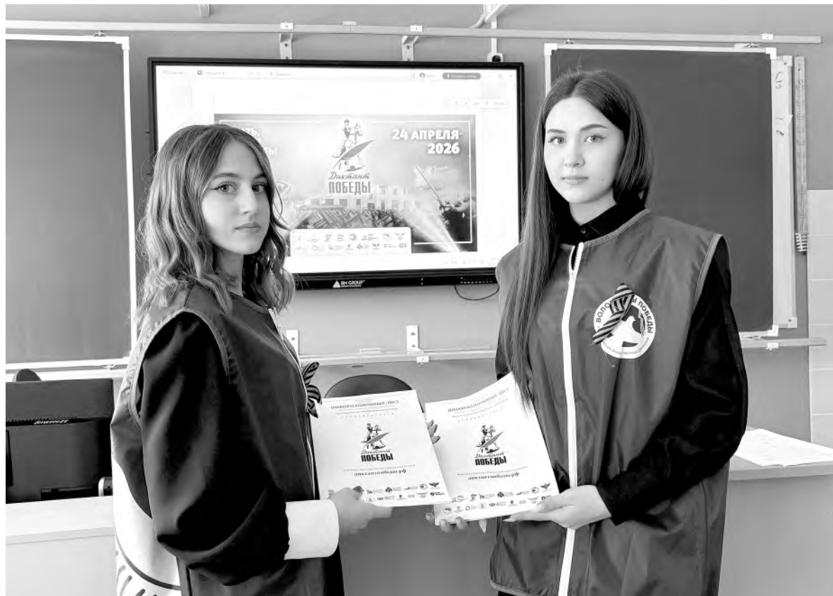
Алексеевские волонтеры перед написанием «Диктанта Победы».