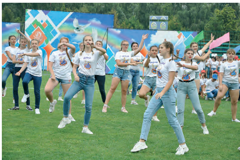
Хореографическая композиция в исполнении ансамбля «Василёк».