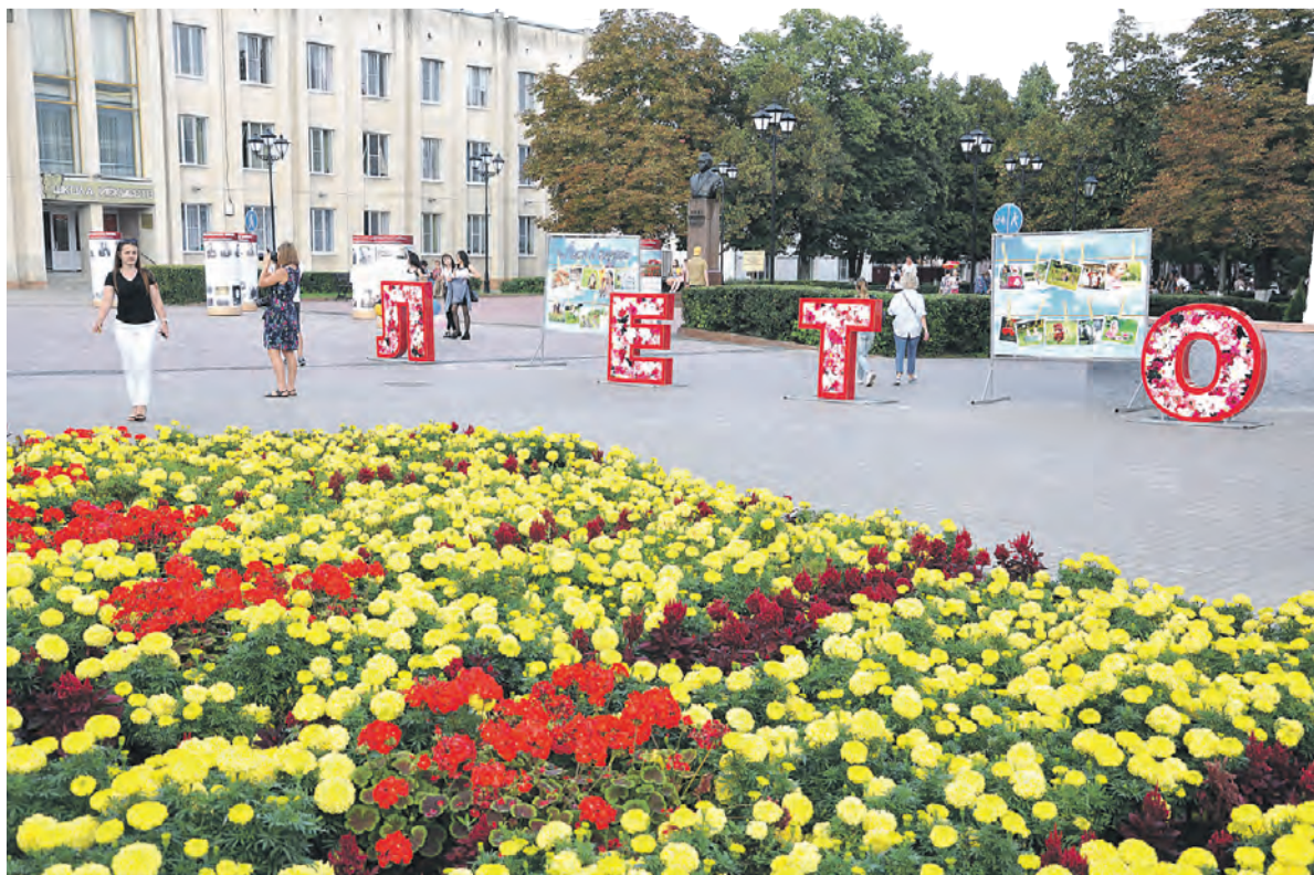
Праздник получился ярким ещё и потому, что всюду было много цветов и композиций.