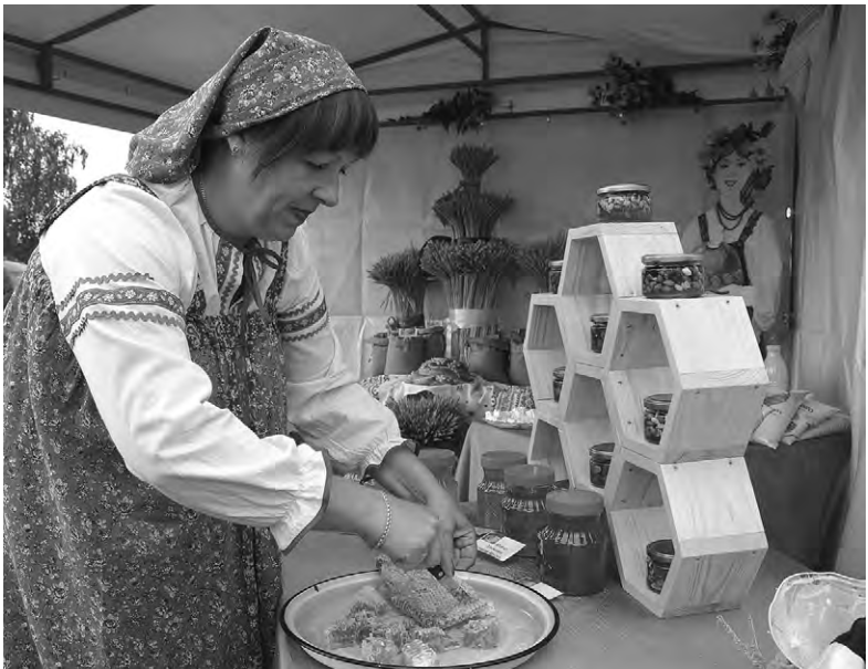
Сотовый мёдом из бортей угощали недавно гостей районного праздника.