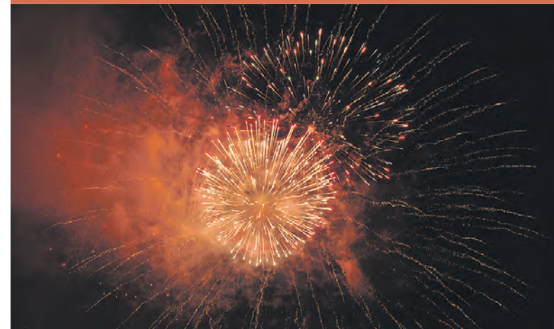
Фейерверк — это всегда красивое зрелище!

С первой любовью моей. Здесь мои выросли дети, Внуки увидели свет — Места родней на планете, Чем Алексеевка, нет. Вместе навеки с тобою. Ты в моём сердце, судьбе, Город над Тихой Сосною, С праздником, счастья тебе! Юрий КУЧЕРОВ. г. Алексеевка.