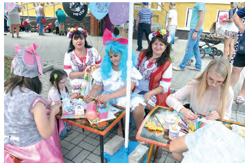
Один из множества мастер-классов на Алексеевском Арбате.