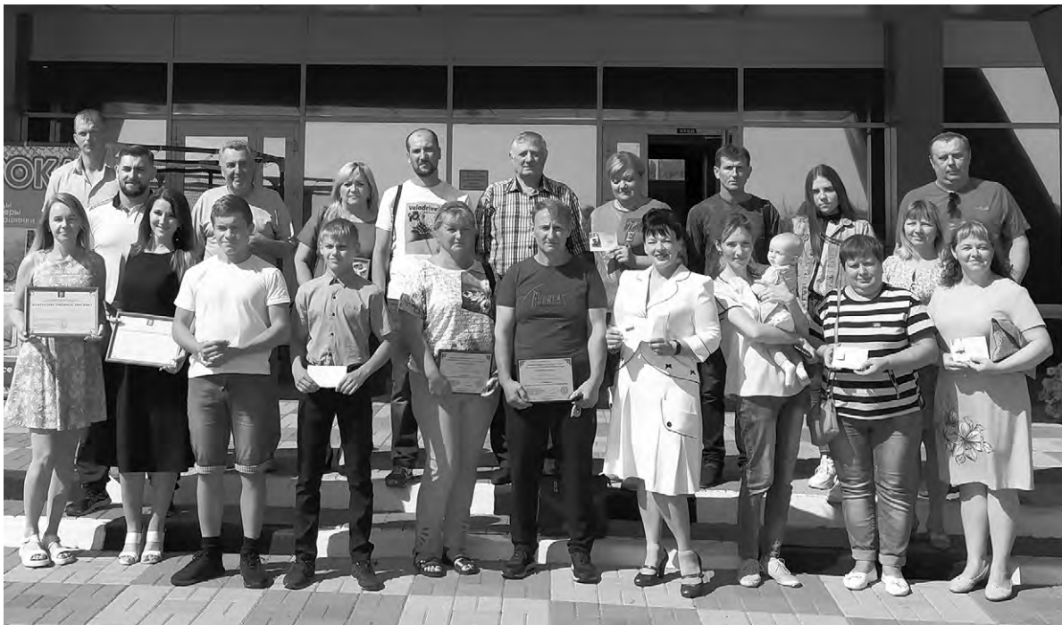
Награждённые активисты спортивного движения Алексеевского горокруга.