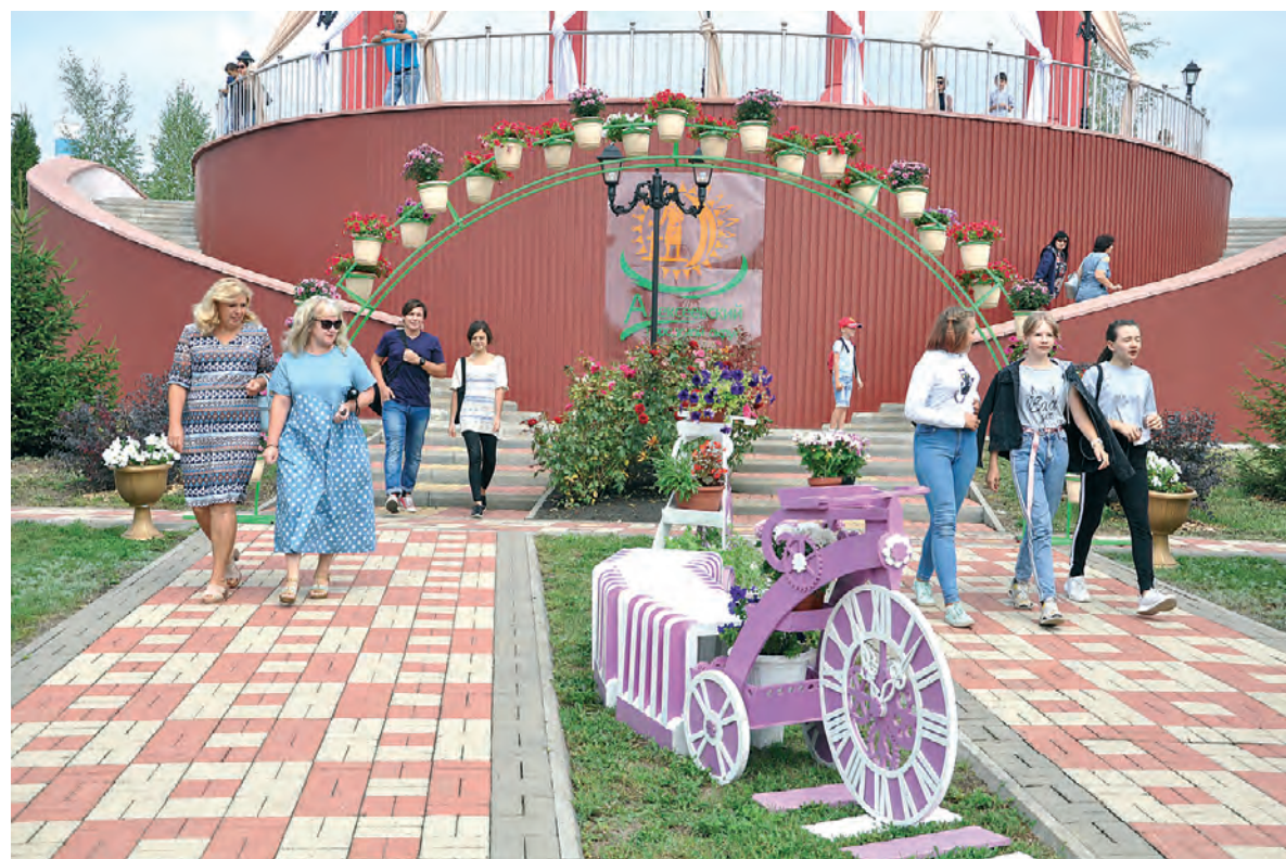
Красивые ландшафтные композиции привлекали внимание своей необычностью, оригинальными задумками.