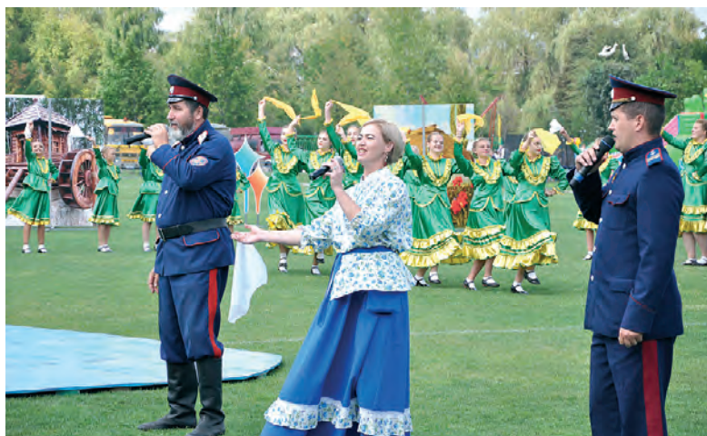
Звучит казачья песня «Пролягала она, путь-дорожка».