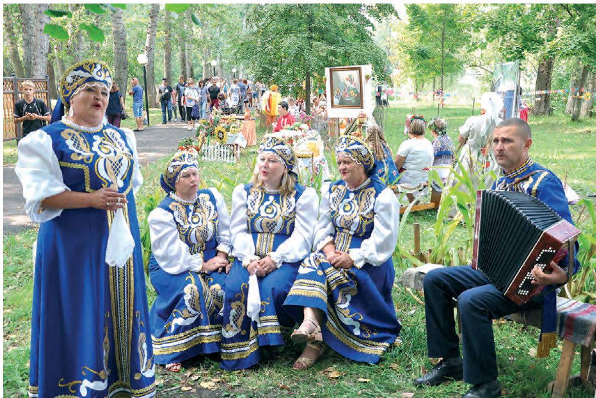
Песни в парке лились рекой.

Ключевым мероприятием стал традиционный, проводимый в пятый раз парад колясок и детских велосипедов «Счастье