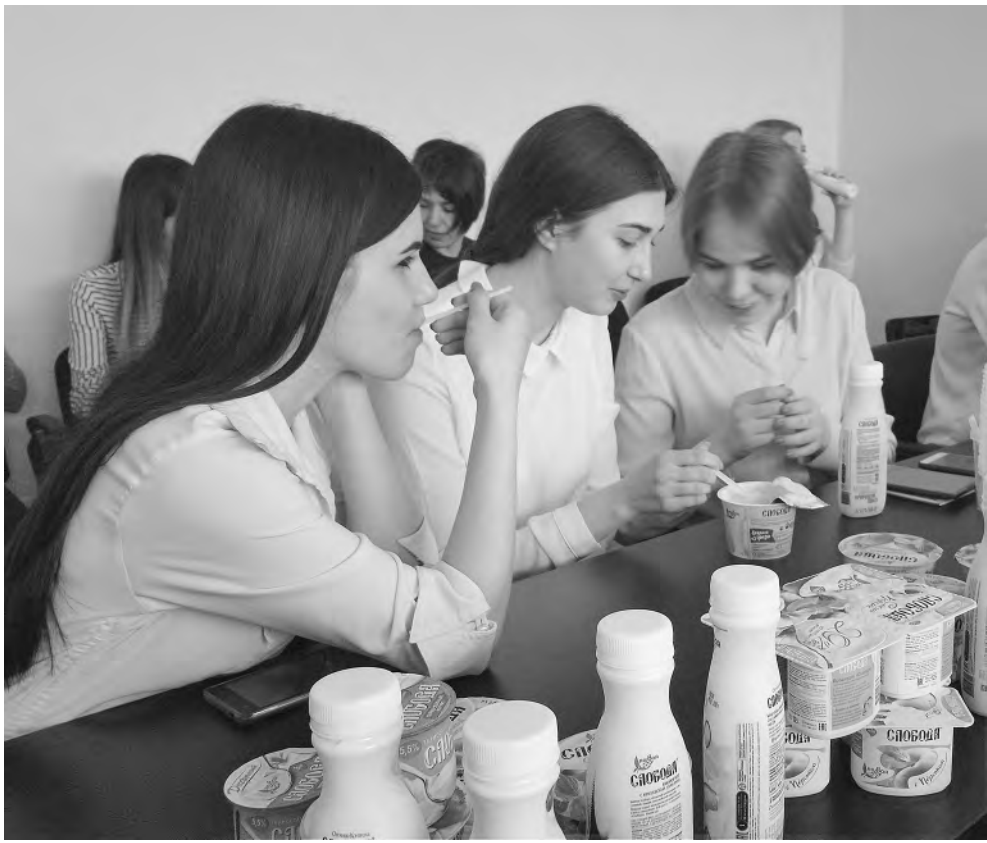
Студенты дегустируют йогурты торговой марки «Слобода».