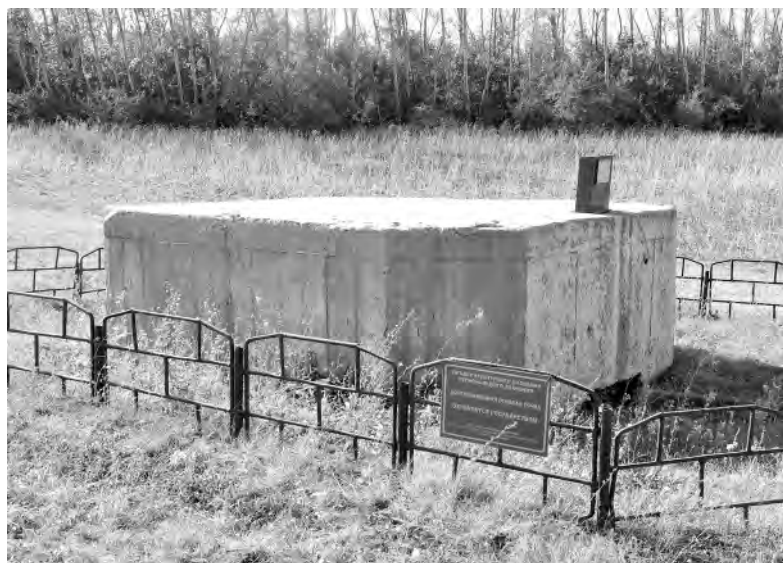
Дот (долговременная огневая точка) на участке автодороги Ильинка-Сидоркино. Фото 2024 года.

Молодые воины противостояли превосходящим силам противника. У «пульбаты» не было достаточно ресурсов,