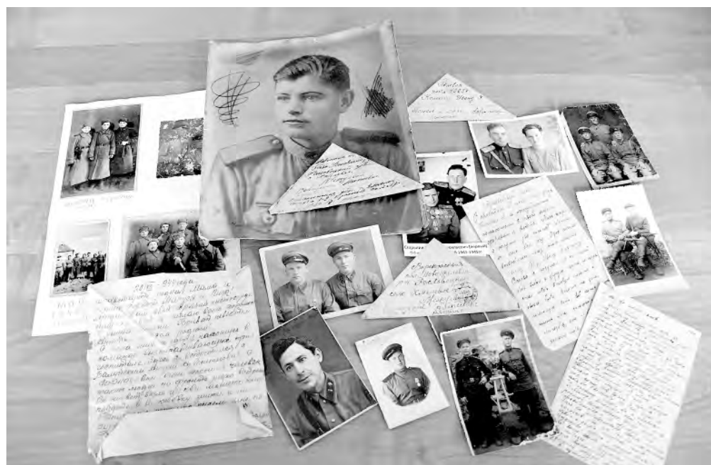
Наградные документы, фотографии и биографии героев Победы реконструируют историю военных лет.