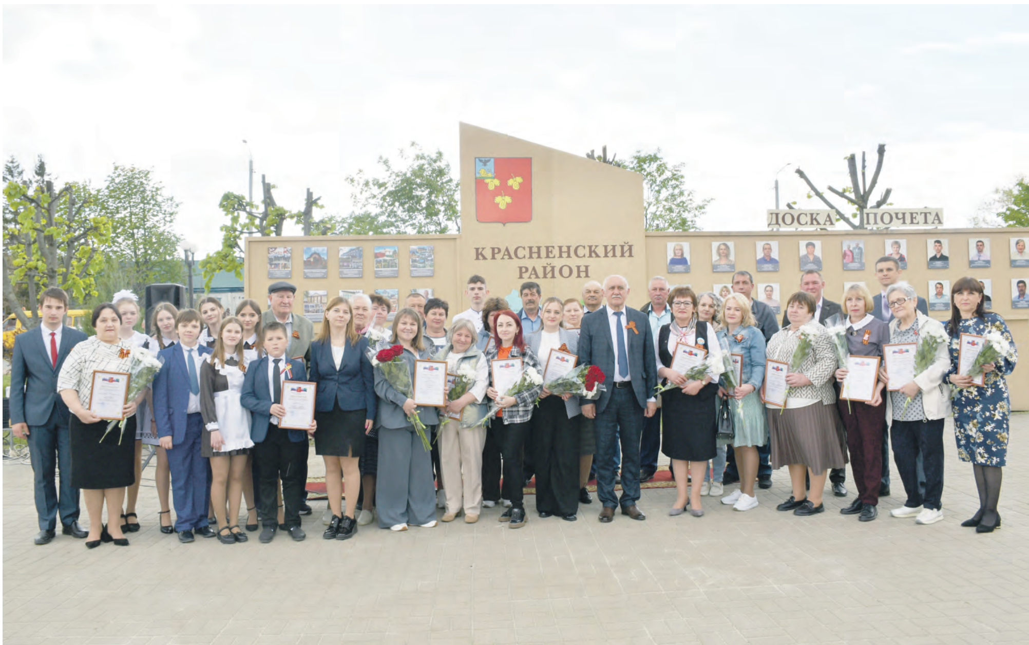
Лучшие по профессии сделали традиционное фото на память на фоне обновлённой Доски Почёта.