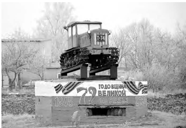
Дот возле села Круглое с установленным на нём трактором.

чтобы заstopорить продвижение гитлеровцев. Стояла суровая задача — задержать наступление врага фактически ценою собственных жизней, чтобы основные силы сумели организованно переправиться через Дон.