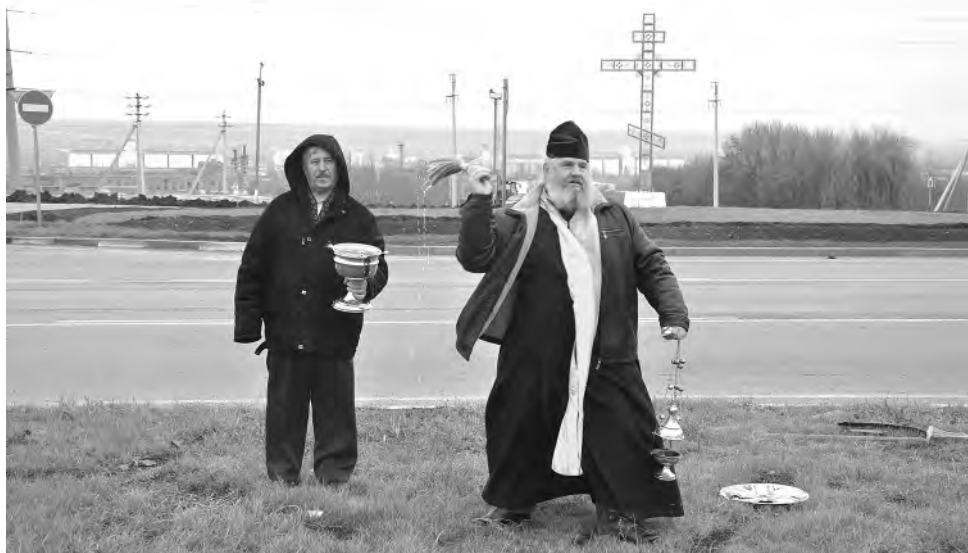
«На Бога надейся, а сам не плошай!» — эту поговорку нелишне усвоить некоторым водителям.