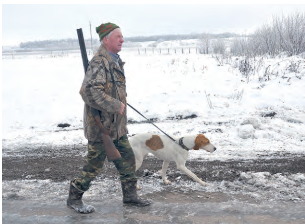
Соб. инф.

Такой вот увлечённый миром животных человек живёт в Ковалёве.