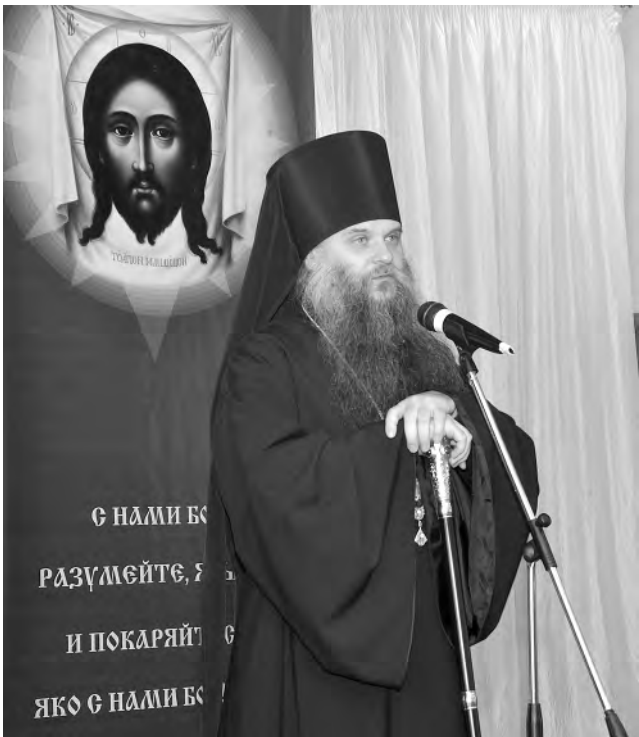
Епископ Савва выступает на образовательных чтениях.