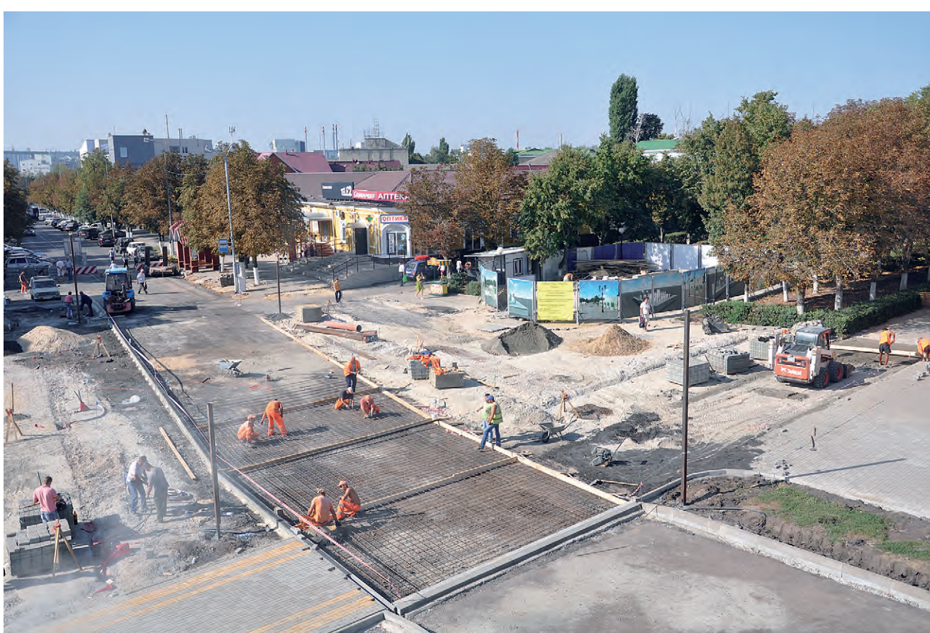
В центре города, на перекрестке улиц Мостовая и Гагарина, работа кипит вовсю.