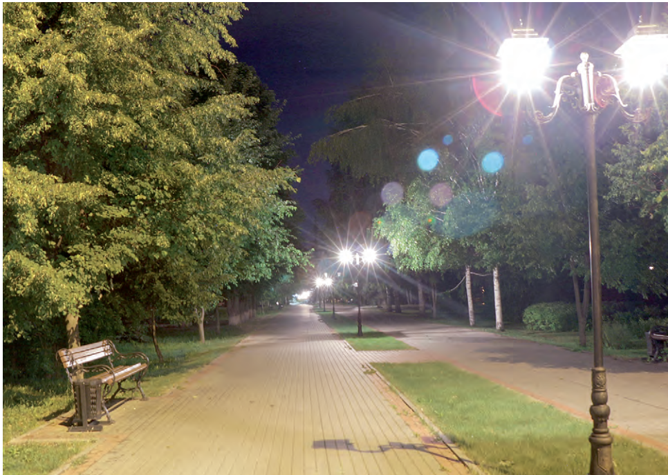
Фото «Что скрывает свет» уже находится на пороге первой десятки конкурсного голосования.