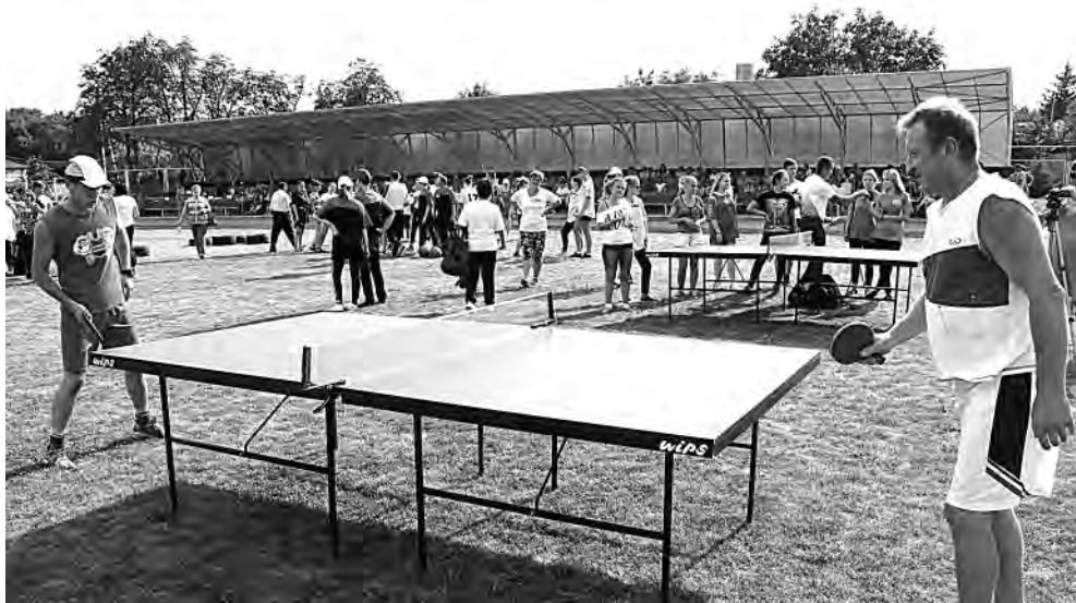
Желающих поиграть в настольный теннис было хоть отбавляй.