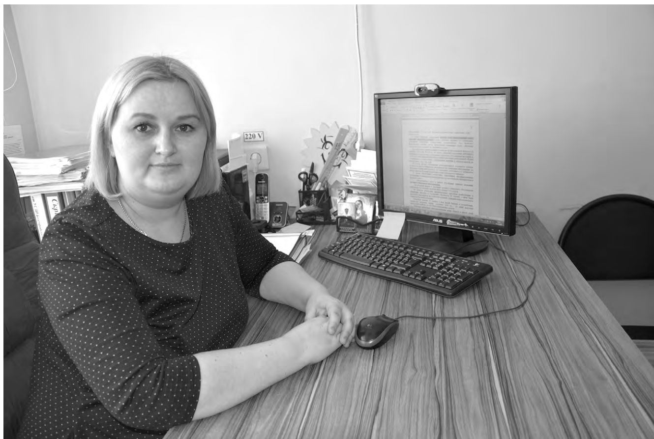
Наталья Викторовна знает все тонкости социальной работы.