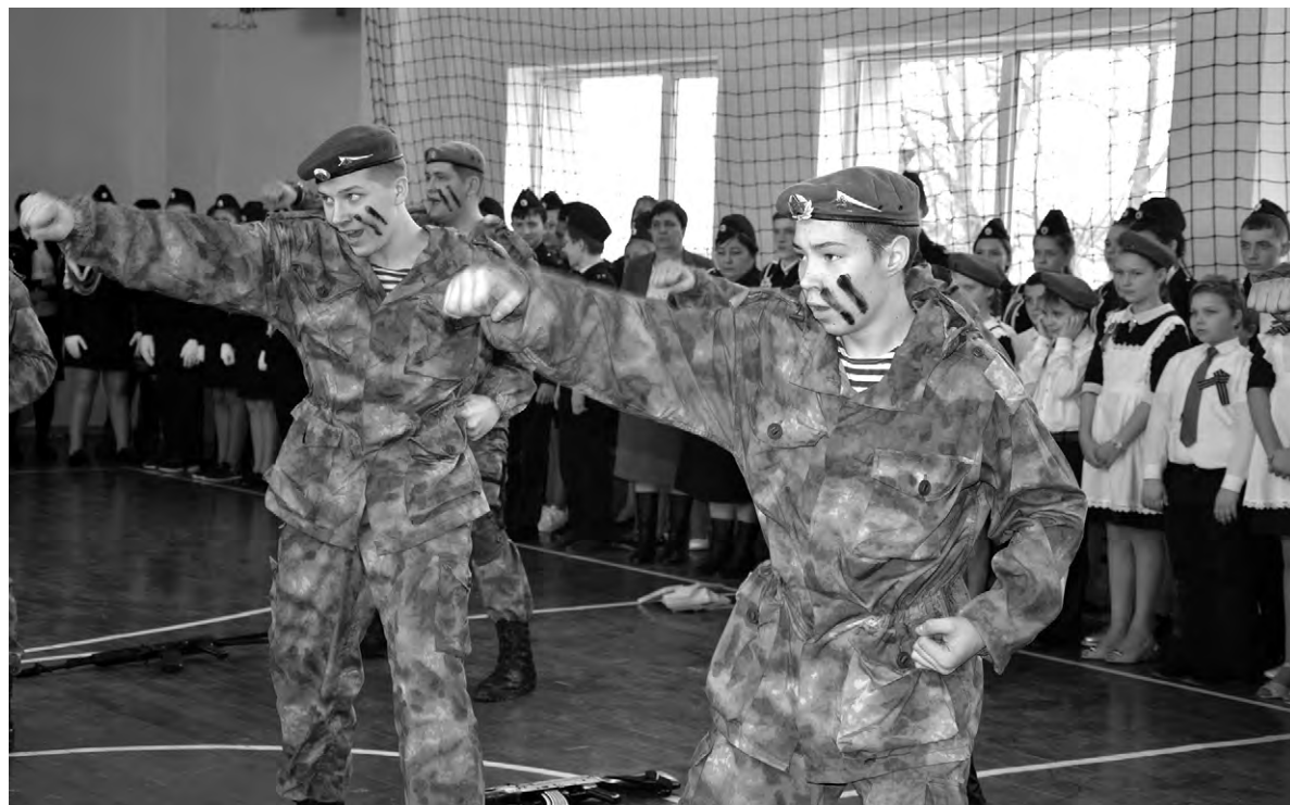
Курсанты «Калибра» на показательных выступлениях в Красненской средней школе.