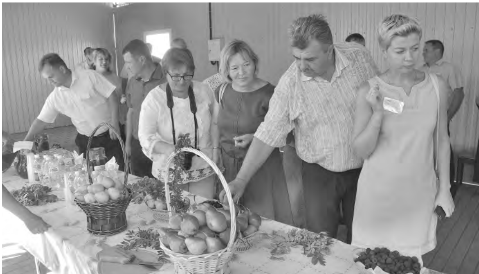
Дегустация плодов и продукции «Колтуновских садов».