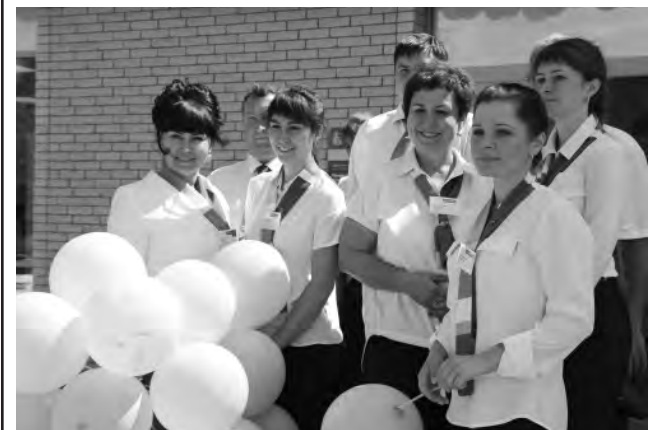
Коллектив Россельхозбанка ждёт новых клиентов.