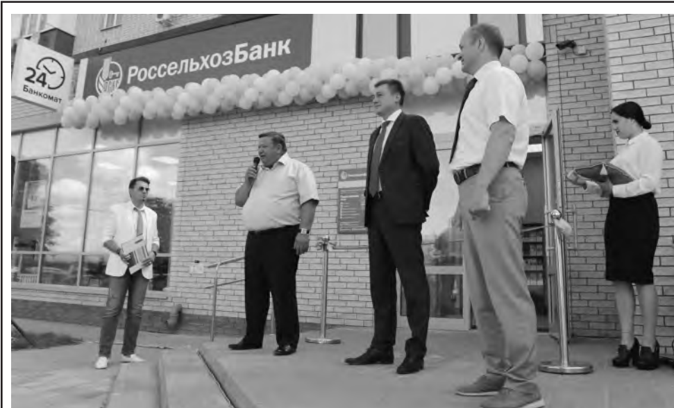
У банка удобное расположение — в центре города.