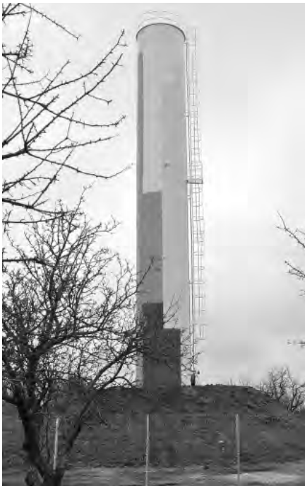
Новая водонапорная башня, имеющая своеобразный дизайн.