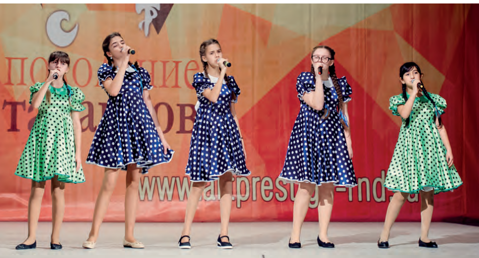
«Ручеёк» — на воронежской сцене.