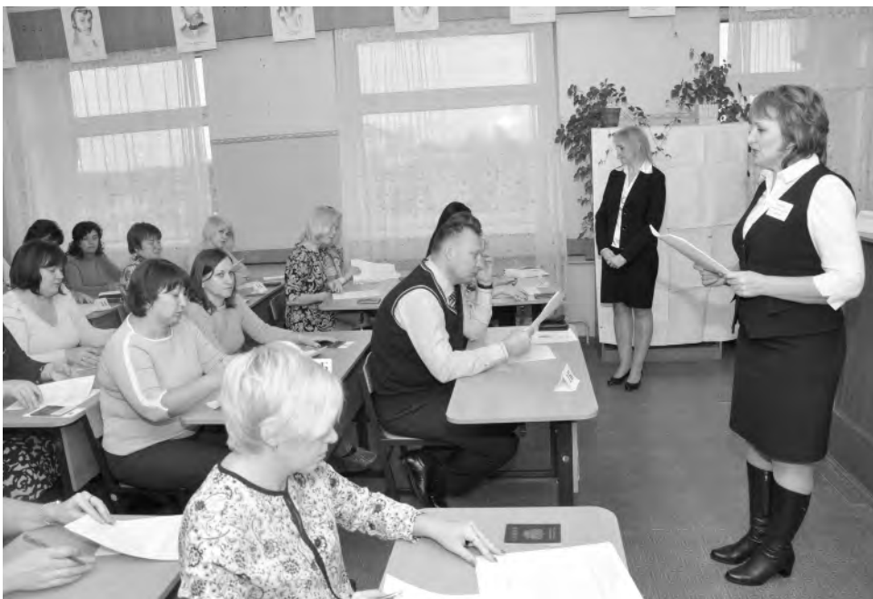
Родителям пришлось пережить те же волнения, что вскоре предстоят их детям.