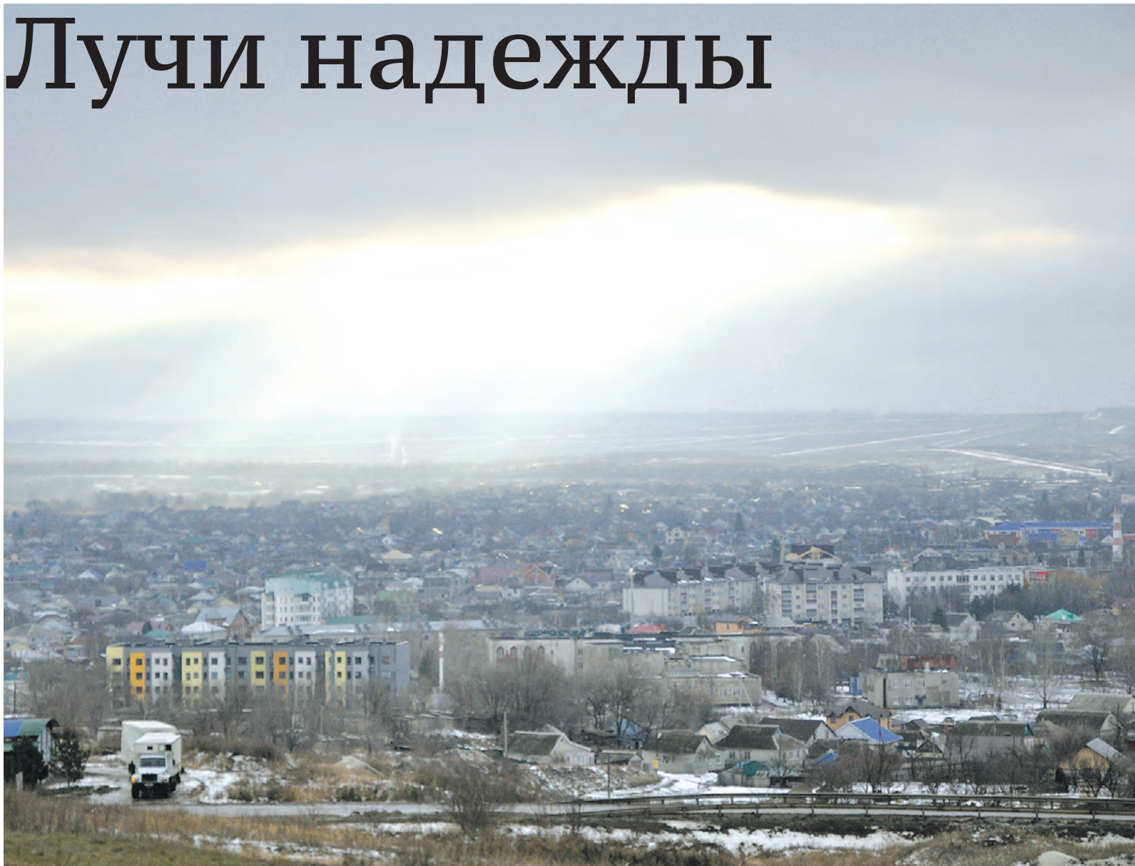
Необычный зимний вид на Алексеевку.