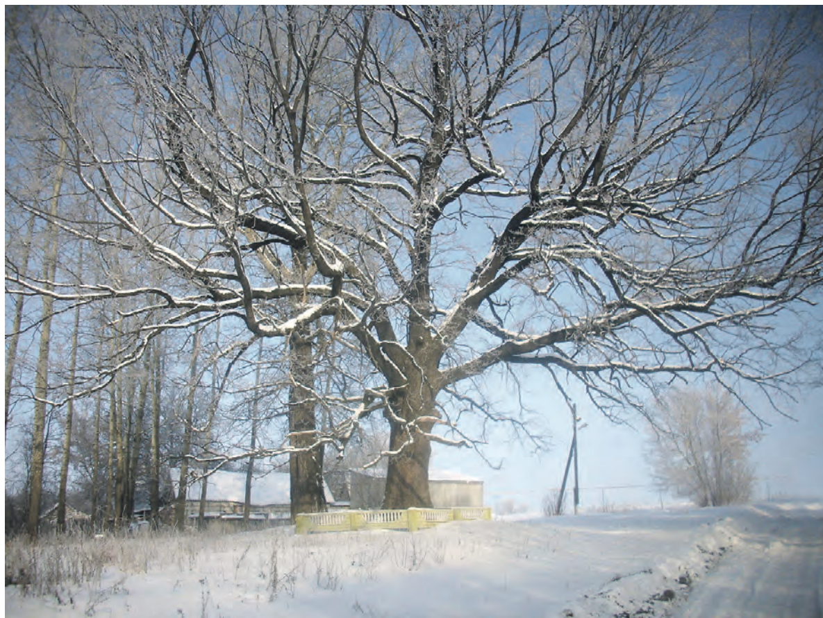
Этому величественному дубу с кудрявой кроной и широким стволом более трёх веков.

Заря Учредители: департамент внутренней и кадровой политики Белгородской области; администрация Алексеевского городского округа, администрация Красненского района Белгородской области, Совет депутатов Алексеевского городского округа Белгородской области, муниципальной совет муниципального района «Красненский район», АНО «Редакция газеты «Заря».