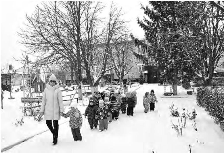
Воспитанники детского сада на зимней прогулке.

Когда наш детский сад стал победителем муниципального этапа данного конкурса, предстояло очень много задач: подготовить необходимые документы, раскрыть основные