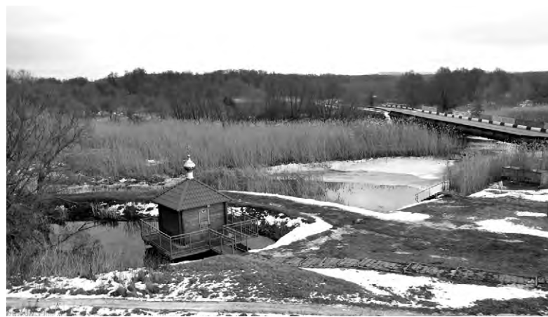
В освящённой купели двери всегда открыты для желающих окунуться с верой в её освежающий источник.

В прошлом году коллектив Мухомудеровской средней школы стал победителем в конкурсе Президентских грантов. На её базе был реализован проект музейной образовательной площадки «Память сильнее времени».