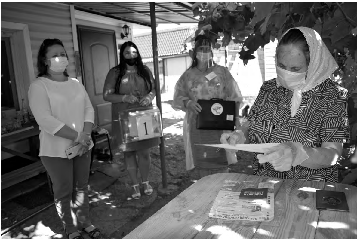
Голосование на дому проходит в районе со всеми мерами предосторожности.