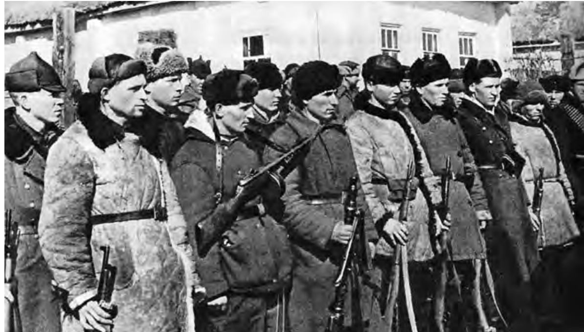
Партизанский отряд в Воронежской области.