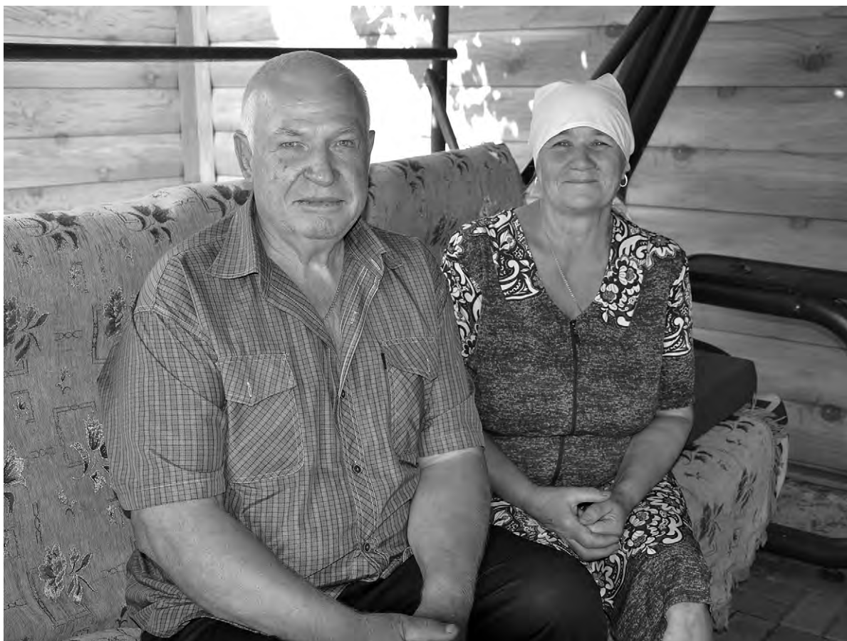
Супругам Черных, привыкшим к труду, на пенсии не скучно.