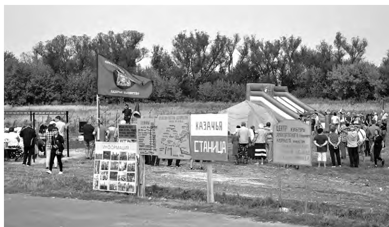
Так выглядела праздничная площадка на берегу реки.