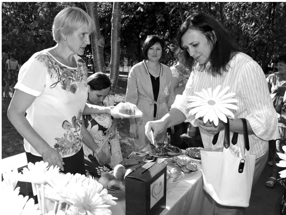
На ярмарке в Красном каждый жертвователю получал символ праздника — белый цветок.