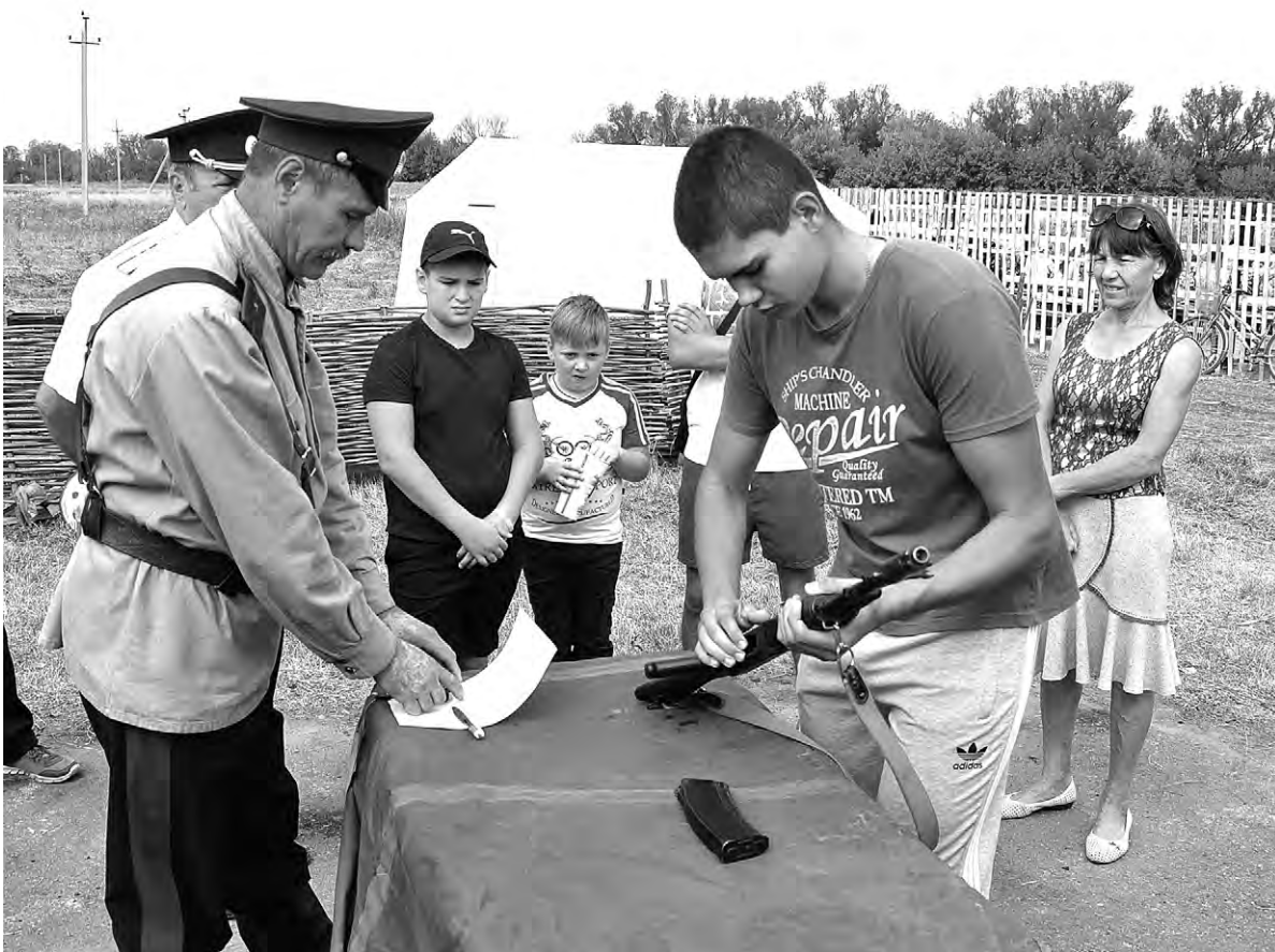
Юный алексеевец учится разбирать и собирать автомат.