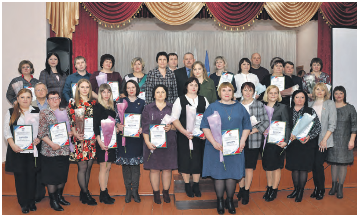
Удостоенные дипломов секретари первичных отделений партии, представившие проекты, и члены конкурсной комиссии.

С начала марта в Алексеевском местном исполкоме партии проводился приём заявок от первичных отделений. В итоге было подано 22 заявки. Все они