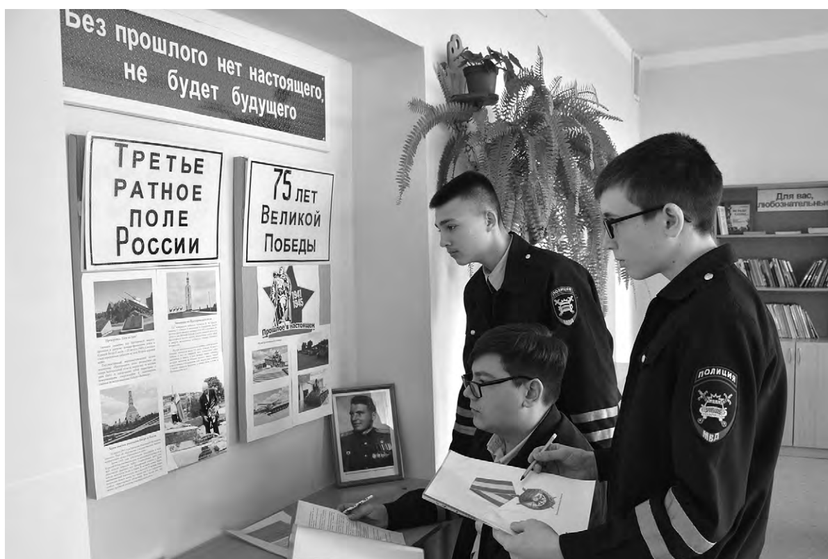
Право посидеть за «партой героя» предоставляется наиболее отличившимся школьникам.