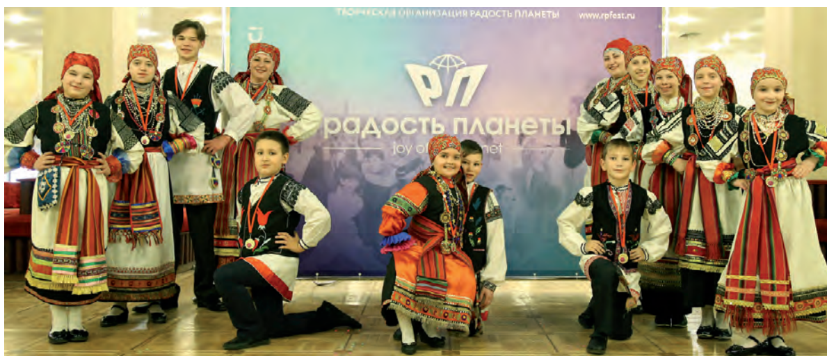
Афанасьевские фольклористы, добились признания на столичном фестивале.

В итоге у представителей Афанасьевки — кубок, дипломы лауреатов, памятные медали, сертификат на сумму 15 000