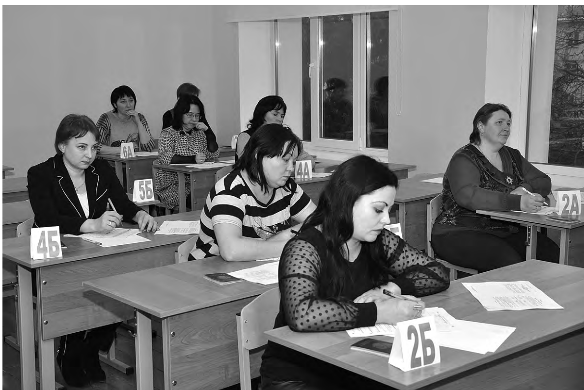
Родителям пришлось в полной мере прочувствовать атмосферу экзамена.