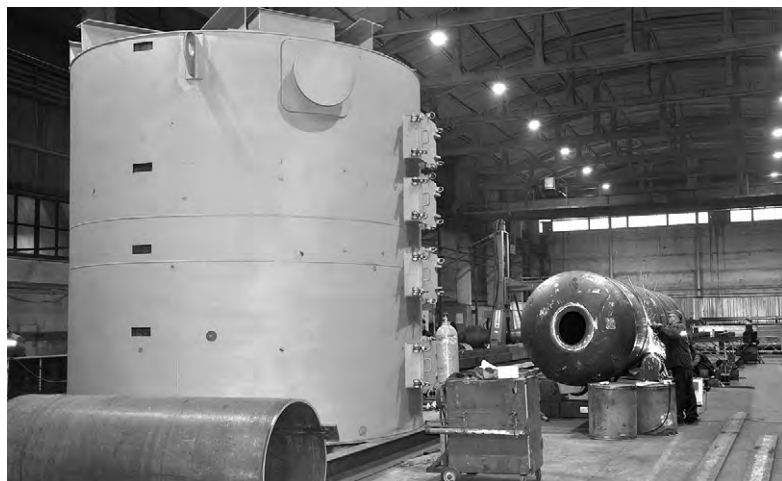
«Высокорослая» продукция завода.

Анатолий КРЯЖЕНКОВ.