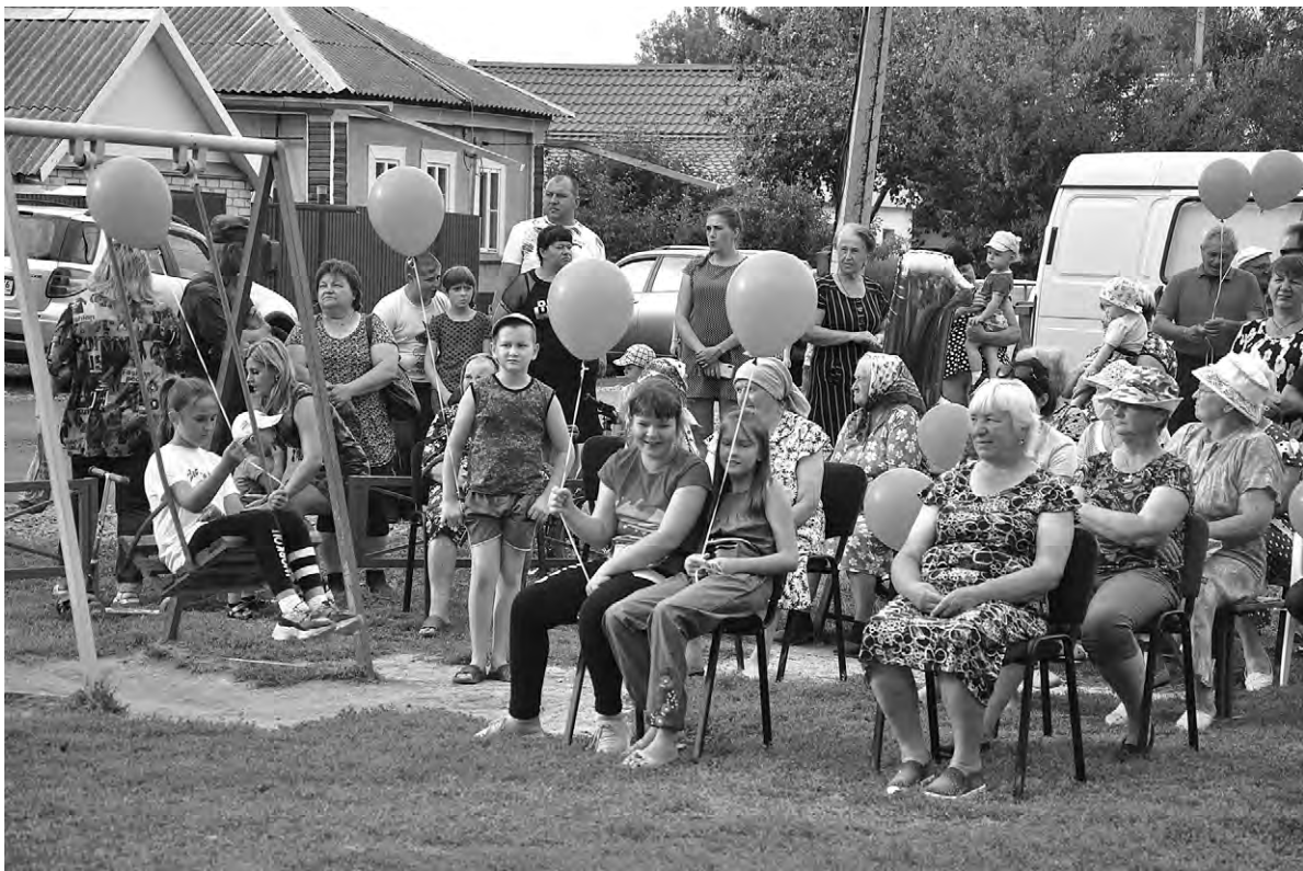
Народ соскучился по «живому» зрелищу.