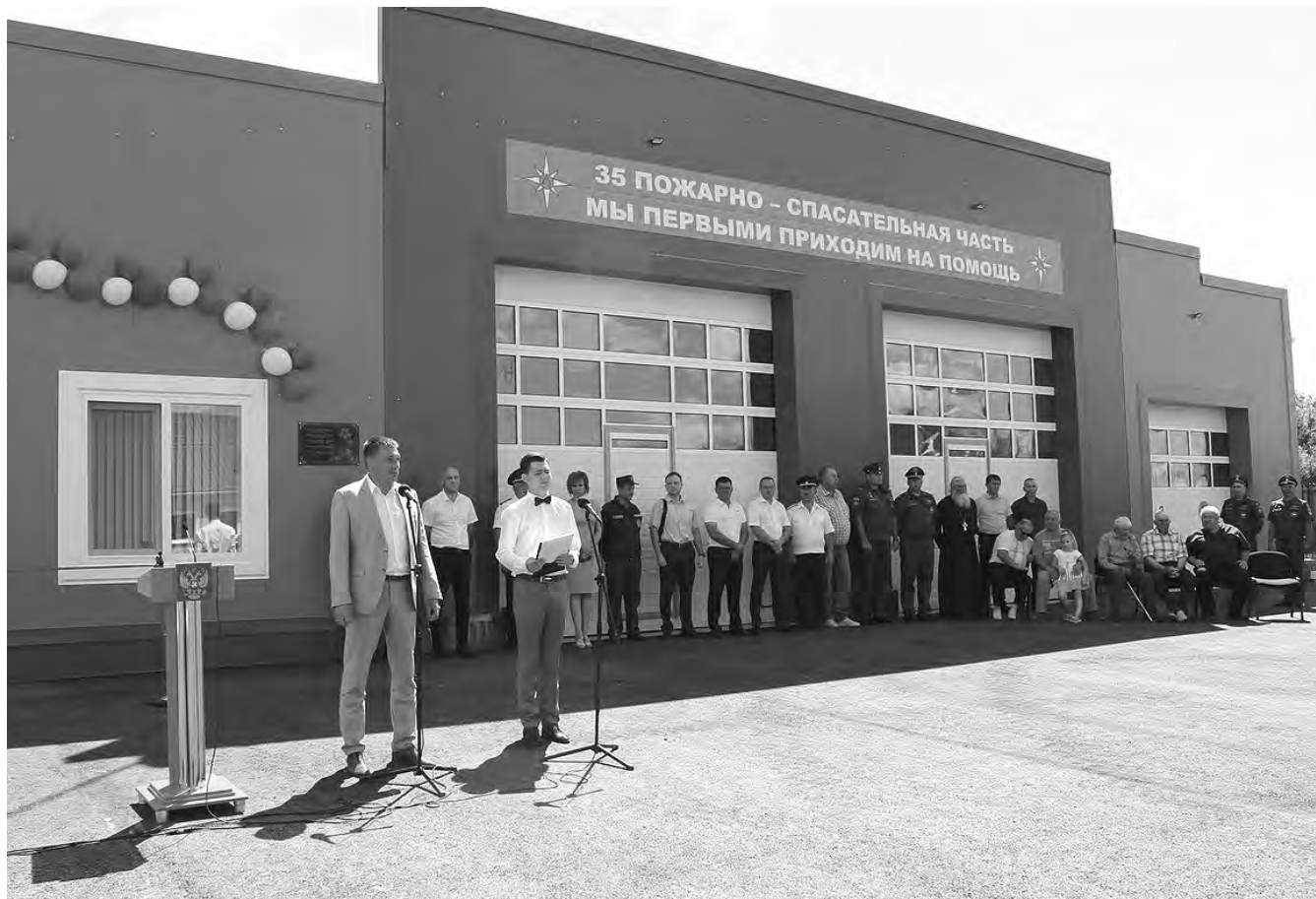
Новая пожарно-спасательная часть оснащена всем необходимым.