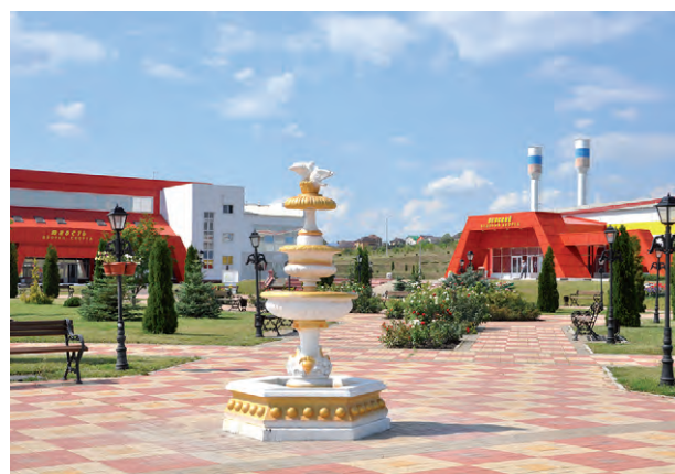
Соб. инф.

На снимке: территория спортивного парка «Алексеевский» — одна из визитных карточек города.