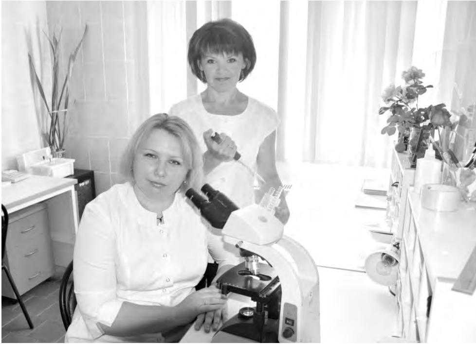
Коллеги-тёзки на рабочем месте.

— Одна у нас в отпуске, другая — в декрете, — поясняют лаборанты. — Но мы и в таком составе с обязанностями справляемся.