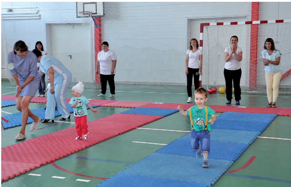
На дистанции — «Бегуны»!