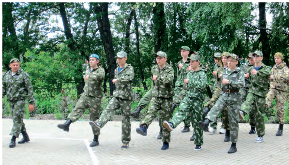
На занятиях по строевой подготовке.